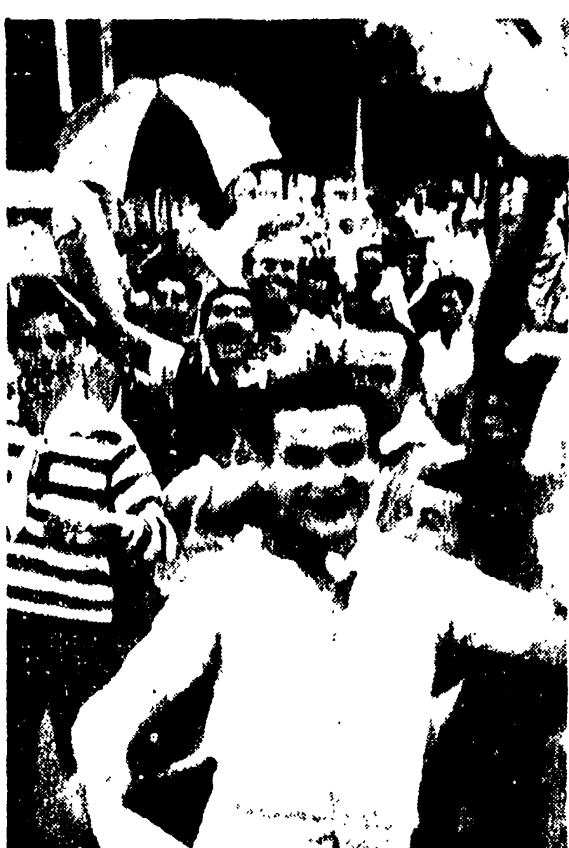
Una immagine delle scene di entusiasmo scatenate dai tifosi baresi a Bologna dopo la vittoria dei galletti.

LE SODDISFAZIONI NON SONO MANCATE DA PARTE DEGLI UOMINI DI BINDA