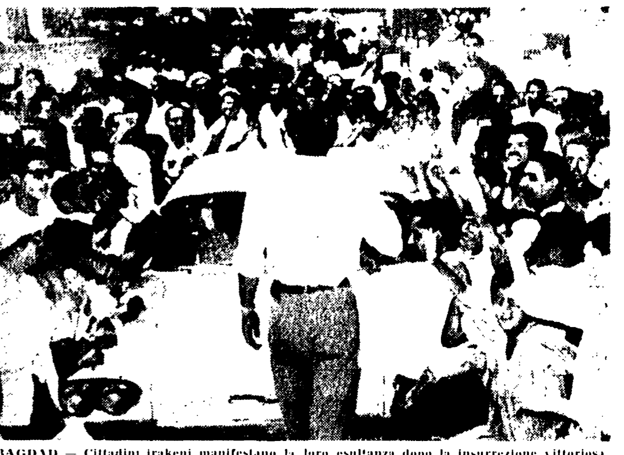
BAGDAD - Cittadini irakeni manifestano la loro esultanza dopo la insurrezione vittoriosa (Telefoto)