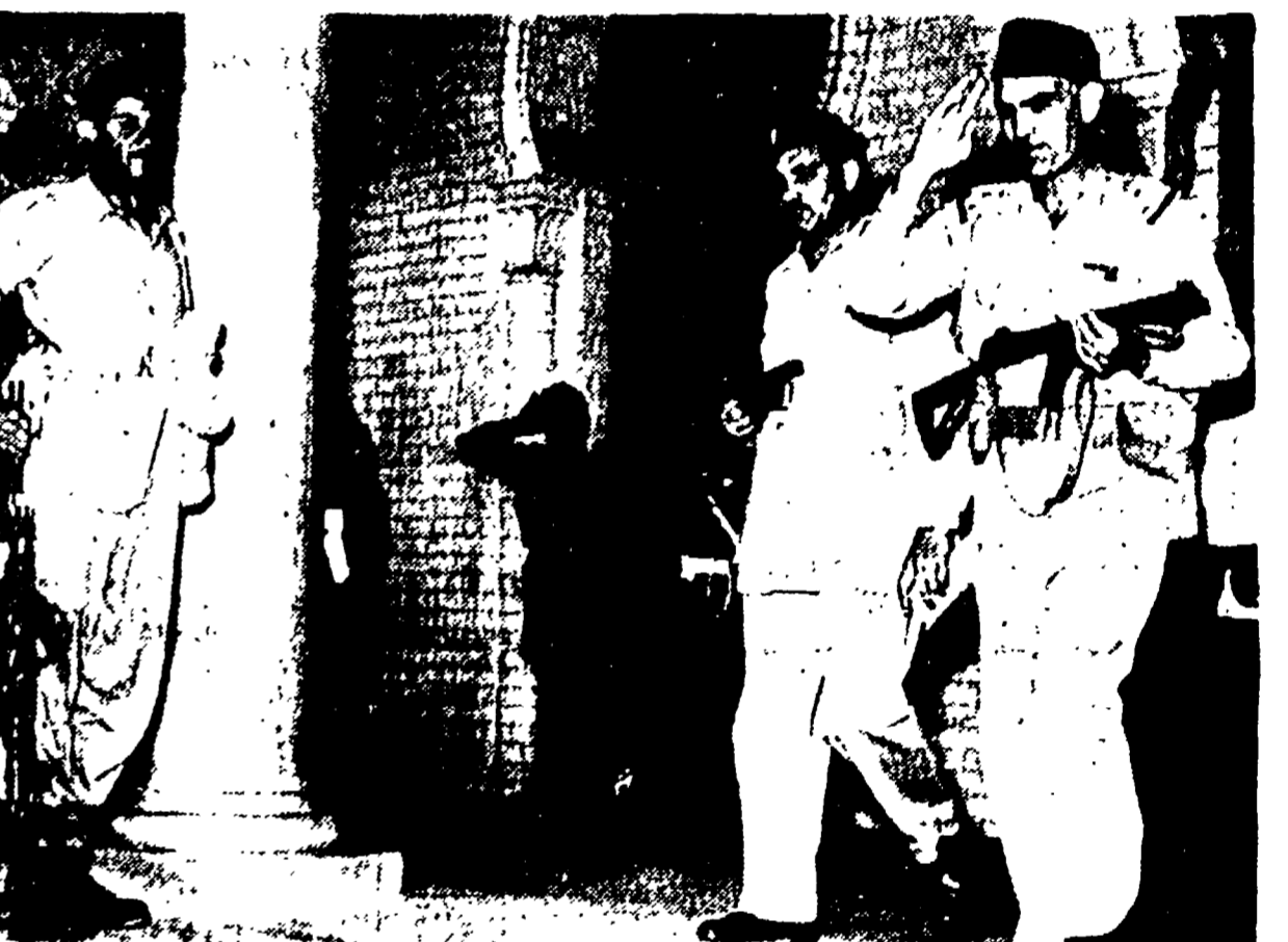
BAGDAD — Il presidente del Consiglio della Repubblica irachena, gen. di brigata Abdel Karim Kassim (a destra con un mitragliatore in braccio) esce dal quartiere generale delle forze rivoluzionarie accompagnato dal ten. col. Washi Taher, ex aiutante di campo di Sadi As Sadi. (Telefoto)

Venanzio, dall'on. Calandroni, da Caserta e da Gaglianico. LIVORNO: Il centro bloccato per ore da un'imponente dimostrazione. Una imponente manifestazione popolare contro l'aggressione ha bloccato a Livorno, ieri sera, per alcune ore, il centro cittadino. Contro il centro di piazza Garibaldi, con l'apporto di un'abbassa gli aggressori, hanno percorso le strade della città forzando i nodi della polizia che si accingeva a far ripartire il traffico. Il corteo, partito da Piazza Cavallotti, ha avuto un primo scontro con le forze di polizia al