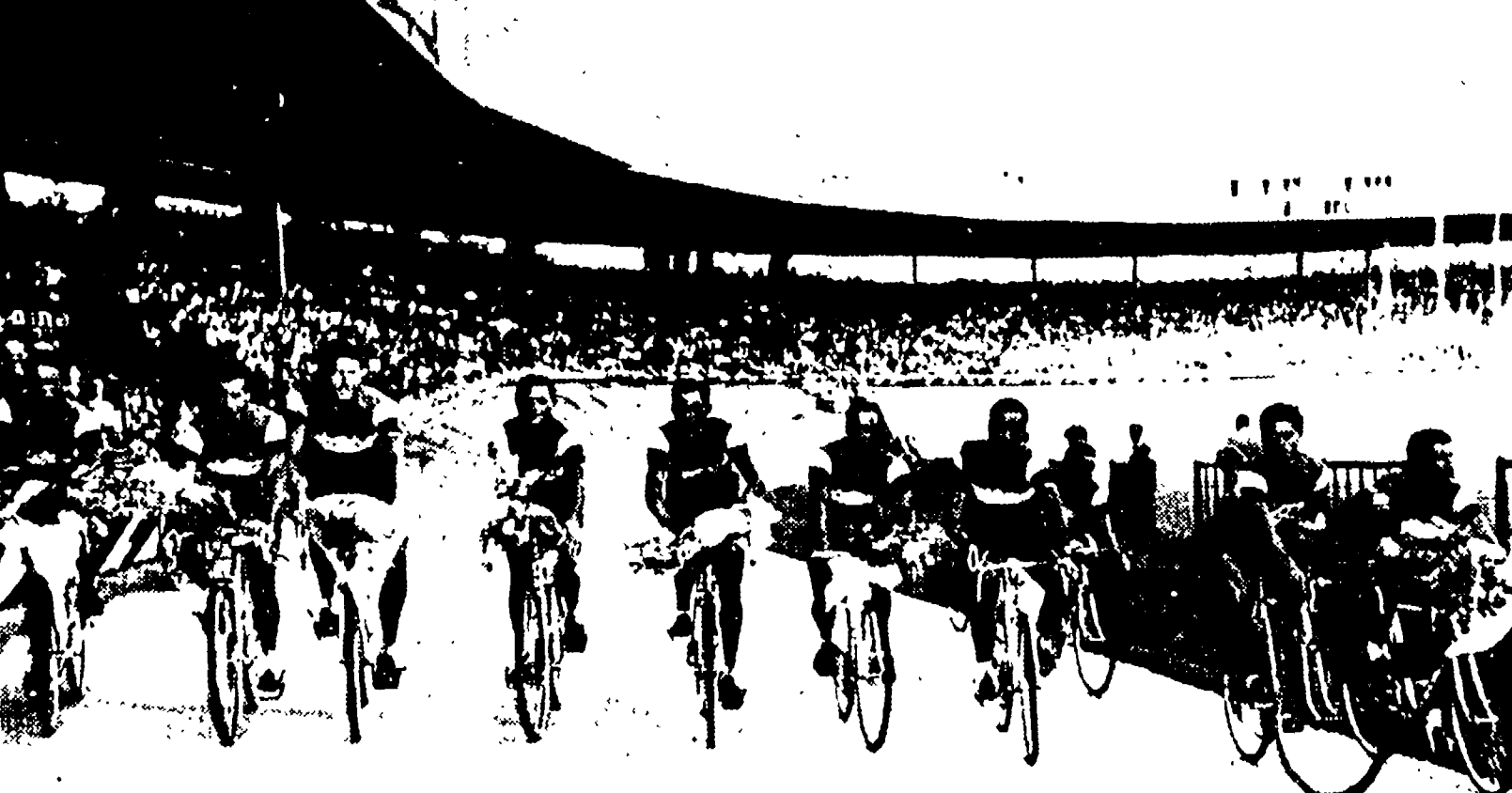
Il piazzamento di Favero, le cinque vittorie di tappa e il secondo posto nella classifica a squadre costituiscono un lusinghiero bilancio per gli azzurri.

GRANDE SUCCESSO DELLA PRIMA EDIZIONE DELLA NUOVA CORSA A TAPPE