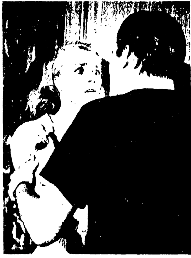
JAMES MARION - INGER STEVENS in «LAMA ALLA GOLIA» - il più sensazionale film del «brivido» finora prodotto