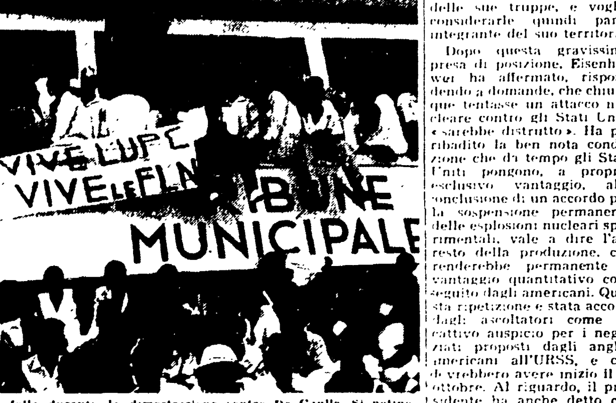
ALGERI — Un aspetto della folla durante la dimostrazione contro De Gaulle. Si notano i cartelli che inneggiano al Fronte di Liberazione Nazionale algerino (F.L.N.). (Telefoto)