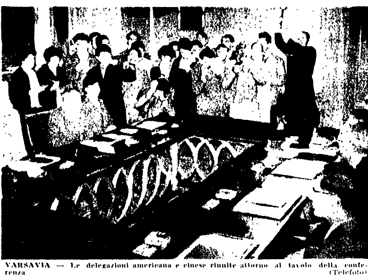
Varsavia - Le delegazioni americana e cinese riunite attorno al tavolo della conferenza.