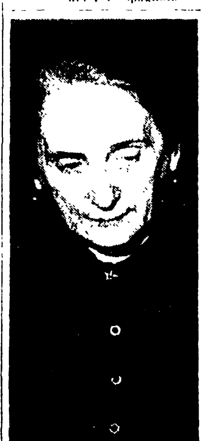
La compagnia Dolores Ibaruri, segretario generale del P.C. spagnolo.

«Nonostante i primi successi della lotta politica e economica della dittatura, la lotta per l'annientamento di questa forza gigantesca, a fronte della quale la dittatura non potrebbe resistere...»