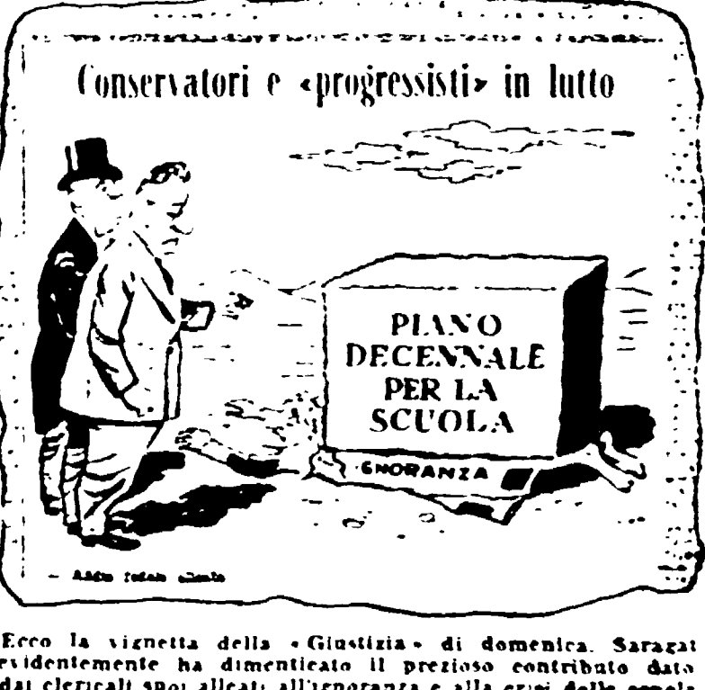
Conservatori e «progressisti» in lutto. Piano decennale per la scuola. Ecco la signetta della «Giustizia» di domenica...