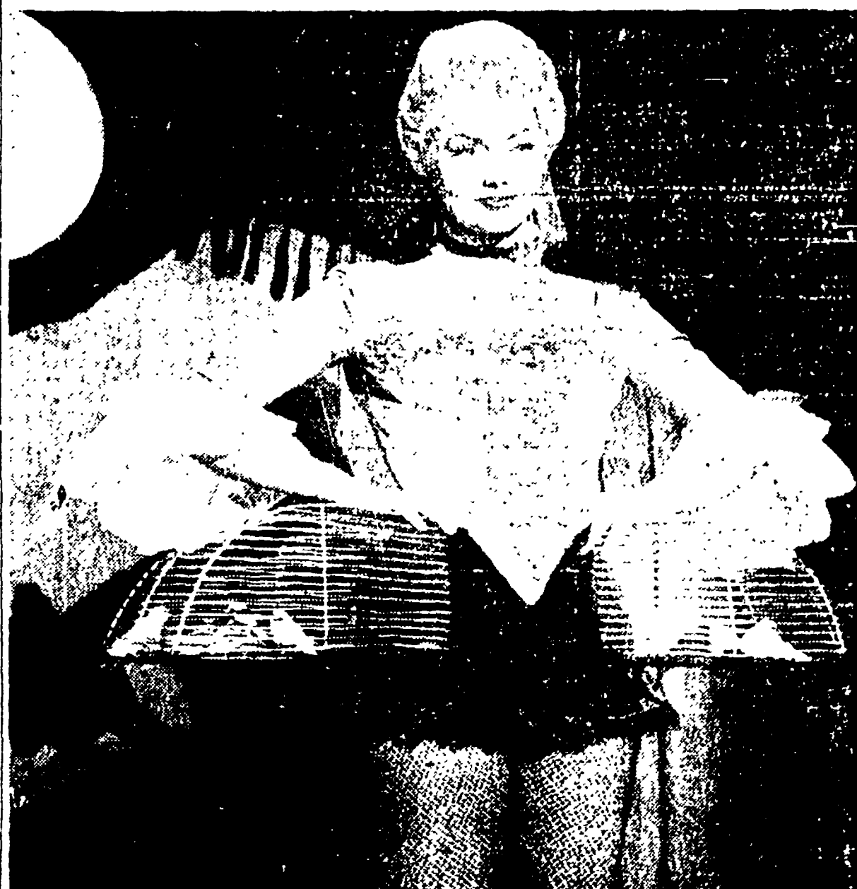
Nel film «Tutto a Parigi» Sylvia Kossina si scatenò. Nel film vi è persino una scena di...