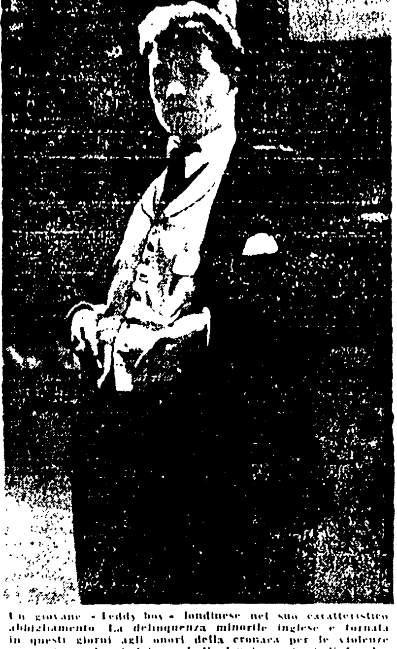
Un giovane "Teddy boy" londinese nel suo caratteristico abbigliamento...