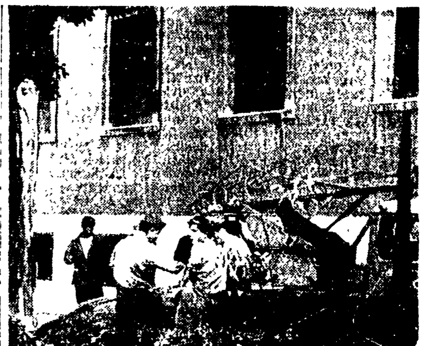
Gli alberi stramati, abbattuti, mutilati nella giornata di ieri si contano a decine. In alto: un danno alle prese con alcune ramaglie

Dopo circa quattro mesi di siccità, nel pomeriggio di ieri — subito dopo le ore 16.45 — un breve ma violentissimo temporale si è abbattuto su Roma. Il vento ha soffiato a 70 km. l'ora, e ha provocato danni di varia natura. In alcune zone, il vento ha strappato i tabelloni delle fermate, e ha fatto cadere alcuni alberi. In altre zone, il vento ha soffiato contro i vetri delle finestre, e ha fatto cadere alcune schegge di vetro. In alcune zone, il vento ha soffiato contro i tetti, e ha fatto cadere alcune tegole. In alcune zone, il vento ha soffiato contro i balconi, e ha fatto cadere alcune persiane. In alcune zone, il vento ha soffiato contro i cortili, e ha fatto cadere alcune piante. In alcune zone, il vento ha soffiato contro i vicoli, e ha fatto cadere alcune scale. In alcune zone, il vento ha soffiato contro i vicoli, e ha fatto cadere alcune scale.