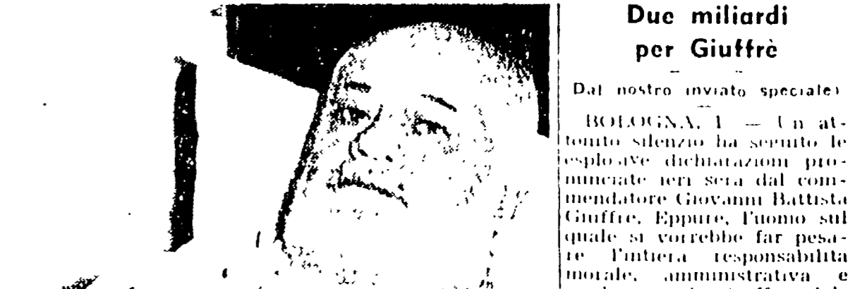
Dal nostro inviato speciale

L'astrofazione clericale che esce finalmente fuori dalla commissione d'inchiesta parlamentare sul caso Giuffrè ha raggiunto ieri la sua fase culminante. I democristiani, con la complicità dei socialisti, eretici e delle destre, e profittando della confusione che regna in altri gruppi parlamentari, hanno prodotto ogni sorta di tentativi di impedire alla commissione Finanze e Tesoro della Camera e ai massimi tutori della legalità parlamentare di lavorare in piena libertà.