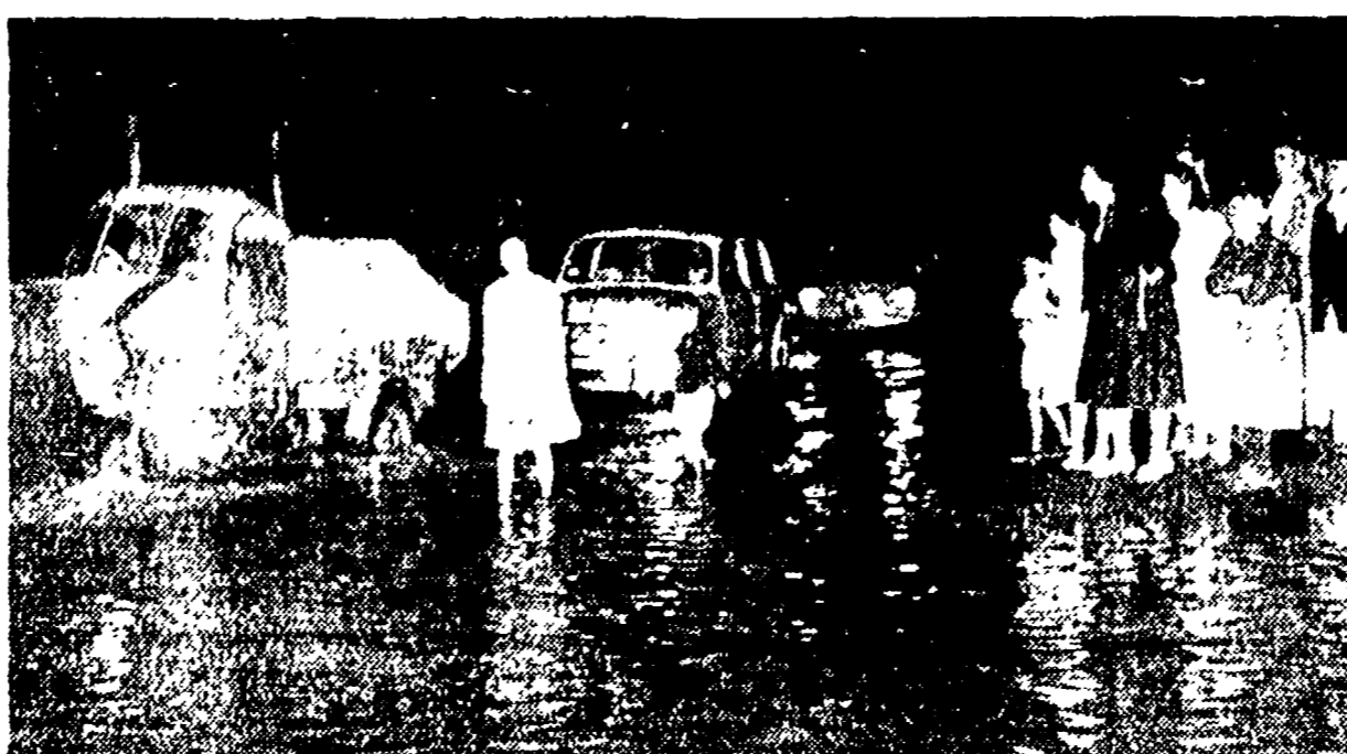
Dopo pochi minuti di pioggia nelle strade della periferia già si ammassava a mezzogiorno

Decine di chiamate ai vigili del fuoco - Anche il Transatlantico di Montecitorio invaso dalle acque - Il traffico aereo seriamente ostacolato - Un pesante ferito da alcune schegge di vetro - Il vento ha soffiato a 70 km. l'ora