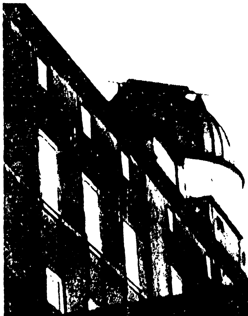
CASTELGANDOLFO - Le finestre degli appartamenti per il Papa sono chiuse da teloni di stoffa.