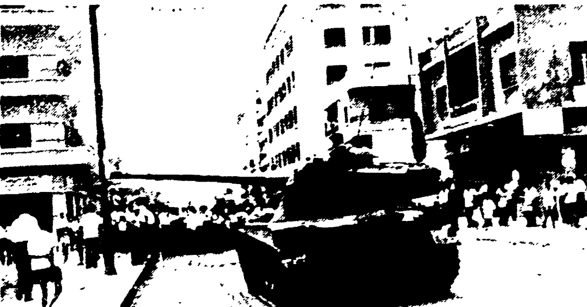
BEIRUT - Un carro armato dell'esercito libanese interviene nella zona del porto contro un gruppo di ribelli chamounisti.

Autoblindo e soldati disperdono i facinorosi, che avevano appiccato incendi - Due morti a Beirut