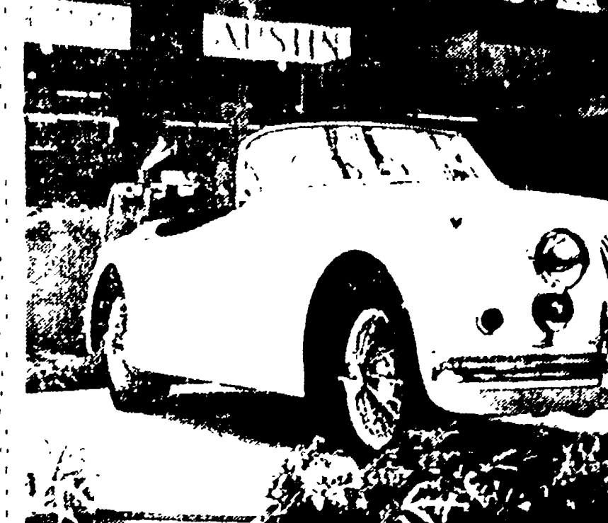
La NSU Prinz, una tra le vetture di grande successo dell'anno.

Una ripresa troppo sorprendente. Il mercato delle utilitarie è in declino, mentre si afferma la vettura media. Una ripresa troppo sorprendente. Il mercato delle utilitarie è in declino, mentre si afferma la vettura media.