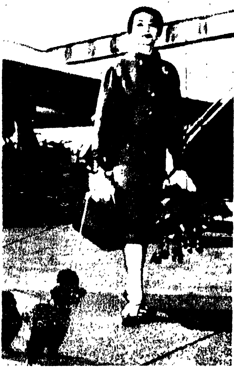
NEW YORK. — La giunta in volo all'aeroporto internazionale di New York. La cantante Maria Meneghini Callas. E' venuta dall'Italia per un giro di concerti.