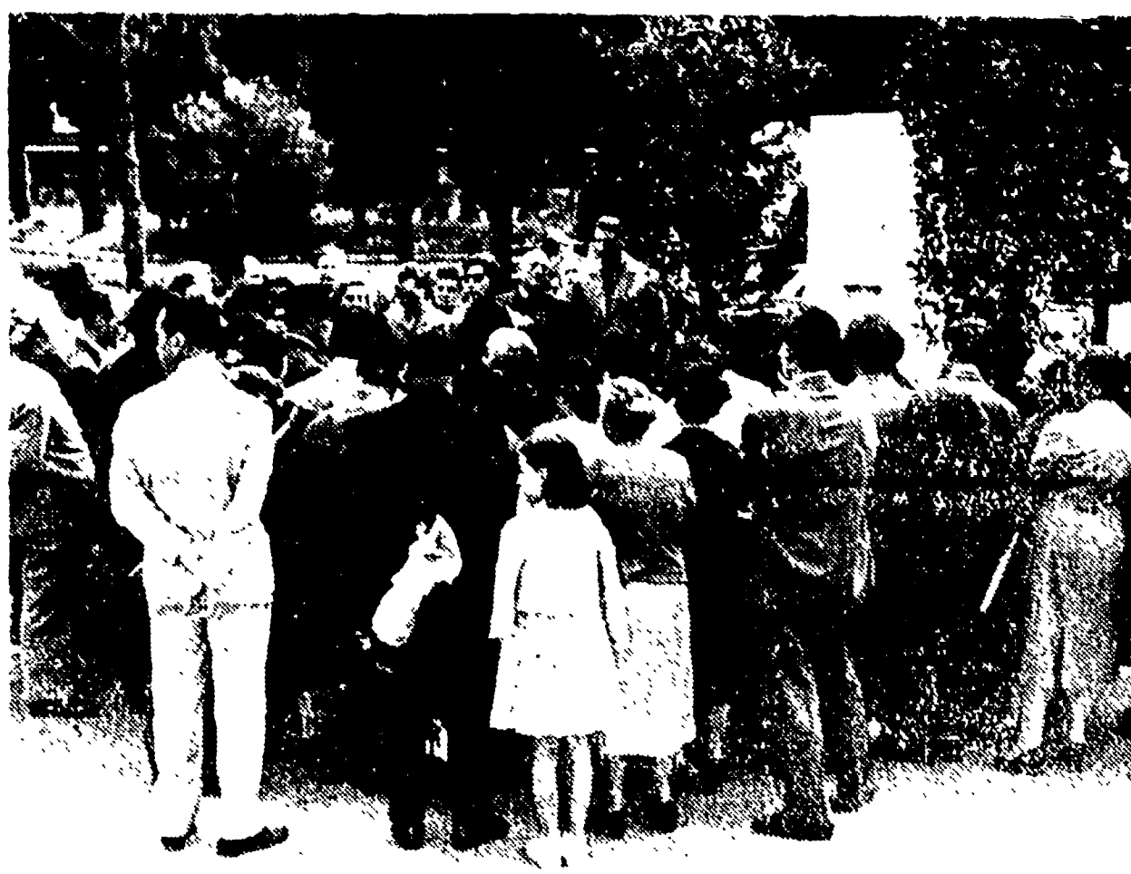
QUINDICI ANNI - Sono passati quindici anni dal giorno delle deportazioni in massa degli ebrei il 16 ottobre del 1943. Le SS naziste piombarono nelle prime ore del mattino nel ghetto e caricarono sui camion interi famiglie che furono successivamente internate nei campi della morte della Germania di Hitler...