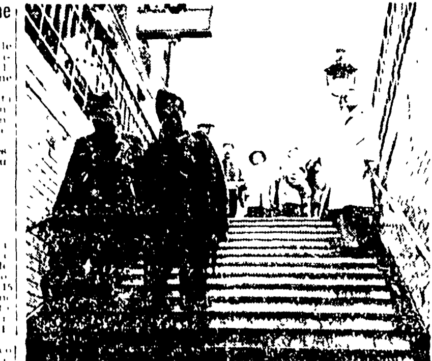
Un scena del film "ORDINE DI UCCIDERE" attualmente in programmazione a Roma...