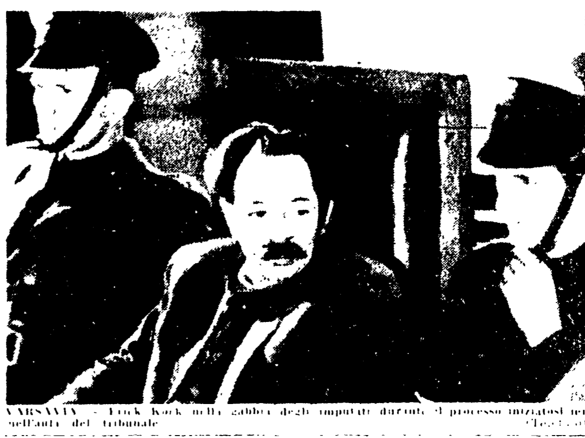
VARSAVIA. Koch, nella stanza degli imputati durante il processo iniziato nell'aula del tribunale.

Il gauleiter nazista polacco, imputato di aver ucciso in un'unica città della Polonia occupata 7.000 ebrei, è davanti ai giudici.