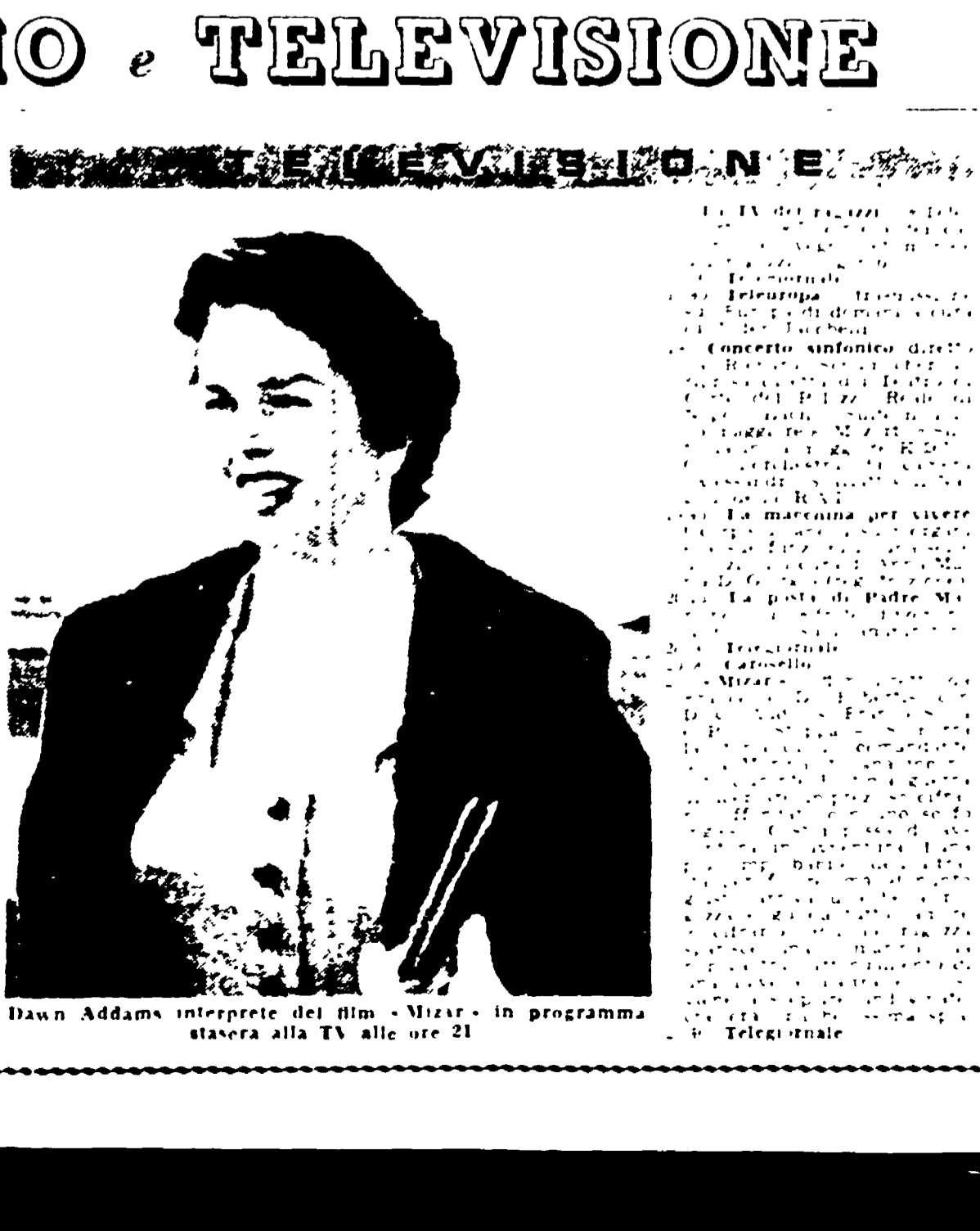
Dawn Addams interprete del film "Mizar" in programma stasera alla TV alle ore 21