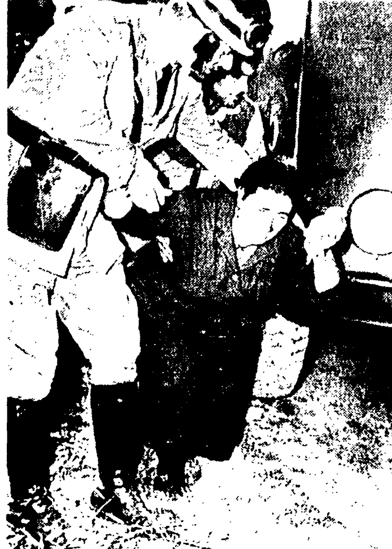
Una straniera immagina le moche di uno degli operai morti a Casal di Principe, un mese dopo il crollo.