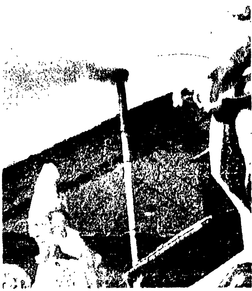
La fumata nera di ieri mattina

Una informazione di questo genere, riferita con beneficio di inventario e che tuttavia rispetta i dubbi e la perplessità che agitano il vasto mondo clericale, rimasto al di qua della barriera di chiusura. Un vasto mondo che, a non frequentarlo, non appare affatto completamente all'oscuro di quanto si svolge all'interno del Conclave. Tale sensazione è stata possibile ricavarla non tanto dalle voci, dai pettegolezzi, dai primi aneddoti che cominciano a circolare sul conto dei conclave, ma da una serie puntuosa nota di dati di fatto. Nell'ultima fra domenica sera lunedì e ancora nella tarda