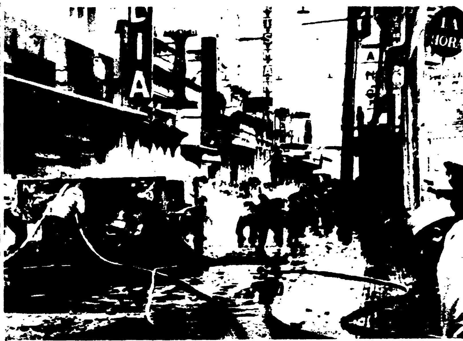
Buenos Aires — Violenti scontri tra studenti e polizia hanno avuto luogo a Tucuman. Nella foto: si nota un gruppo di pompieri che, al riparo di una barricata, tentano di disperdere la manifestazione con violenti getti d'acqua

IVREA, 27. — La direzione della Olivetti, ha comunicato al Consiglio di gestione ed ai rappresentanti della FIOM, Cisl e «Autonomia aziendale» (Comunità) che l'azienda ha deciso di proporre (e di applicare) una riduzione del 20 per cento degli stanziamenti per il servizio assistenza, a partire dal 1960.