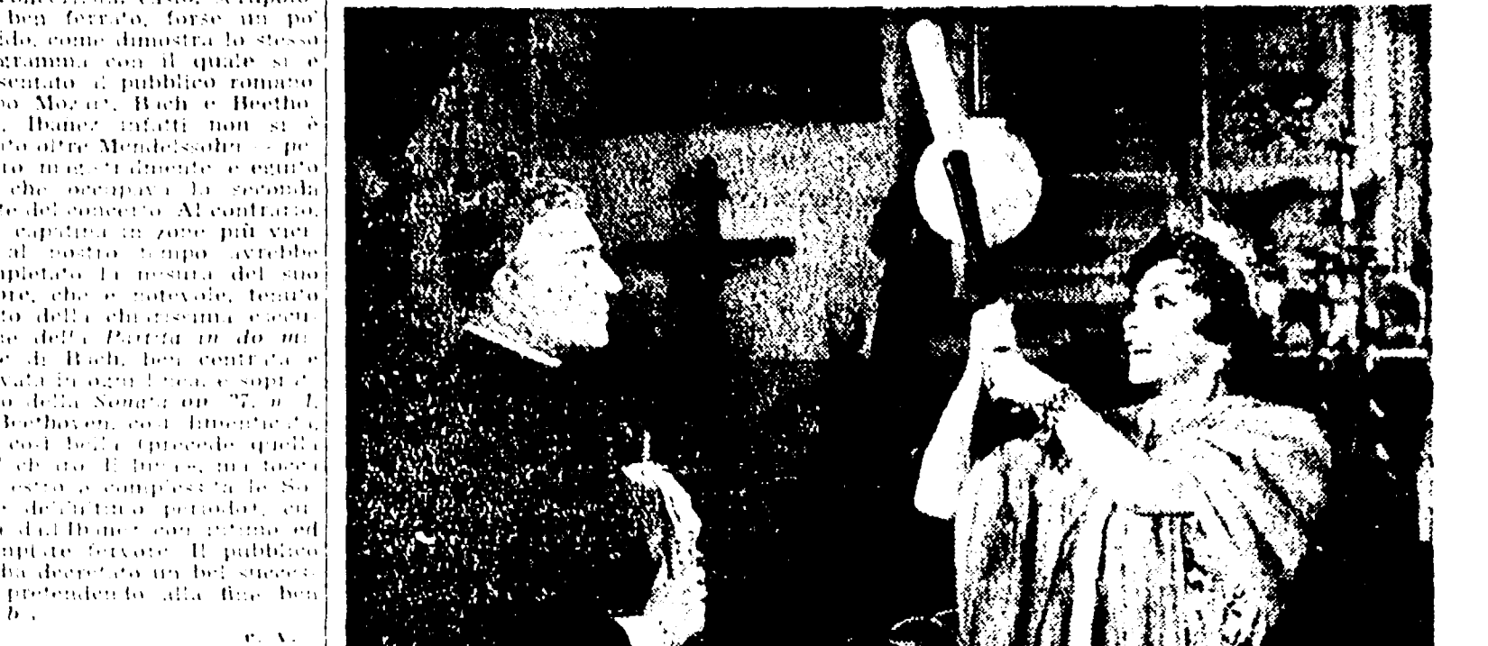
Gina LOLLORIGIDA e Vittorio DI SICIA in una scena del film ANNA DI BROOKLIN...