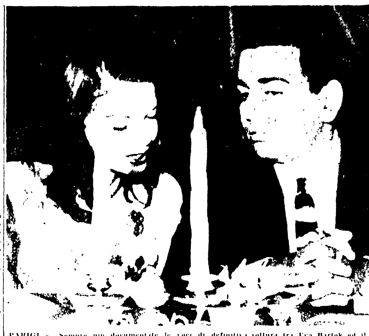
PARIGI. - Sempre più documentate le voci di definitiva rottura tra Eva Bartok ed il marchese Milford Haven a causa di una relazione sentimentale. Tra l'altro, per il momento, si attende che il marito di questa famosa attrice si dimetta dal suo posto di direttore della capitale francese. Si vedono in primo piano l'attrice ed il principe indiano.

Risultato chiaro, da queste ultime annotazioni che riportiamo dalla rivista Economie et Politique, l'esistenza in Algeria e nella