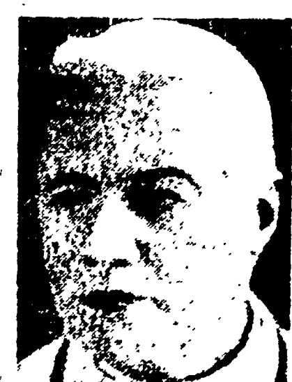
Pio X, Papa Sarto