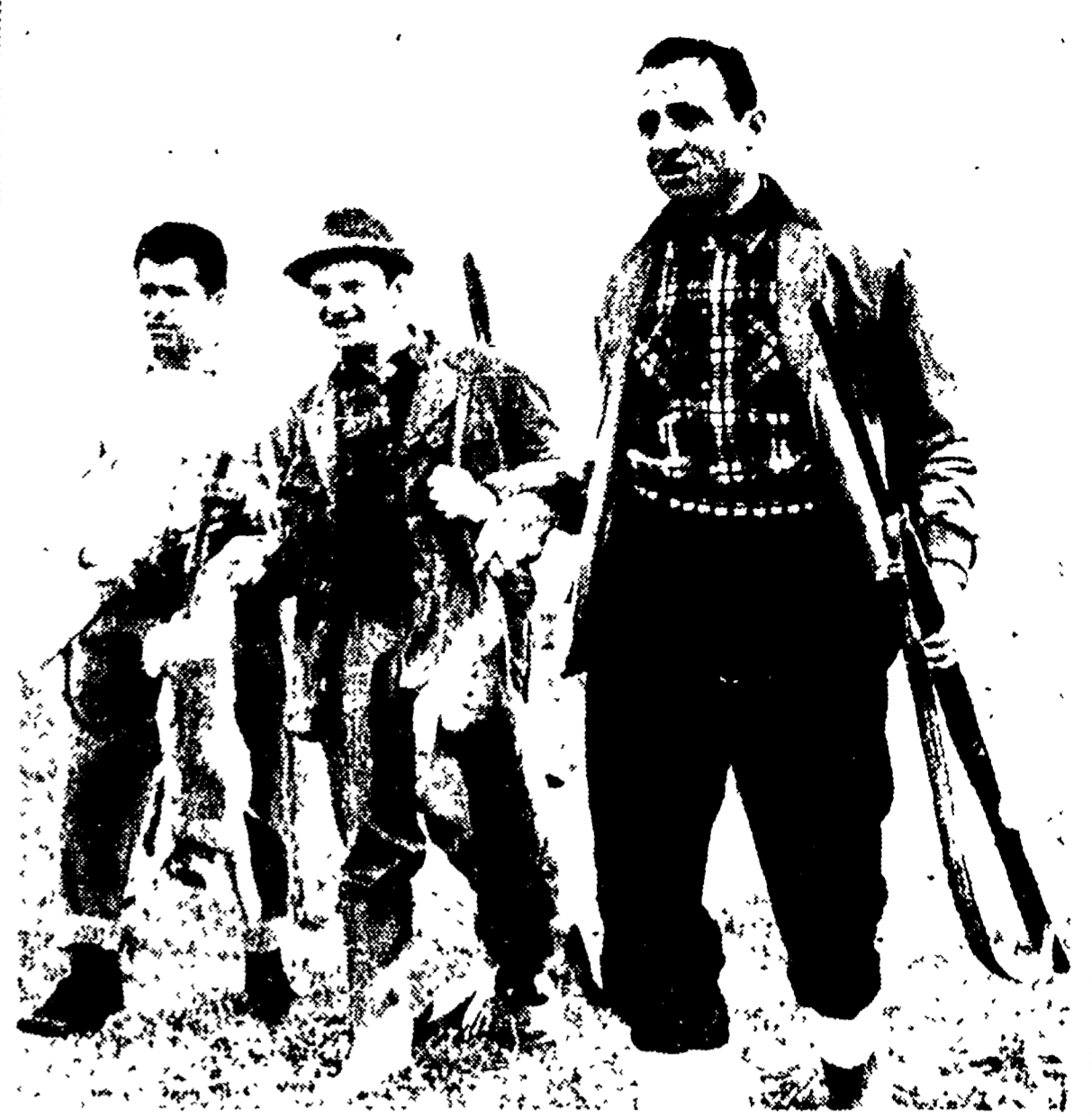
LEONARDO FAGGIN si è preso il lusso di battere il campione del mondo Frodo Baldini...