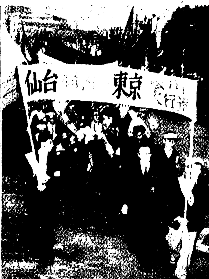
TOKIO. - Un aspetto della manifestazione popolare contro l'inflazione in corso nella capitale giapponese. In primo piano, un gruppo di studenti che hanno organizzato una manifestazione di protesta contro l'aumento dei prezzi.

ziosa, e sia pure a scapito di qualche altra decina di migliaia di voti per il partito, i repubblicani non farebbero mai scendere il PSI ad avvicinarsi alla DC. Il segretario ha concluso la sua replica con l'annuncio della sua alleanza con La Malfa. «Non mi sembra disonorevole», ha detto pateticamente Reale, mentre Pacciardi scuoteva la testa - «di stare accanto a La Malfa, una delle più alte coscienze democratiche del paese». Questa ultima affermazione, pronunciata fra applausi fragorosi, ha avuto l'effetto sperato perché contrapposta a una grave dichiarazione resa in mattinata dallo stesso Pacciardi durante il suo feroce discorso.