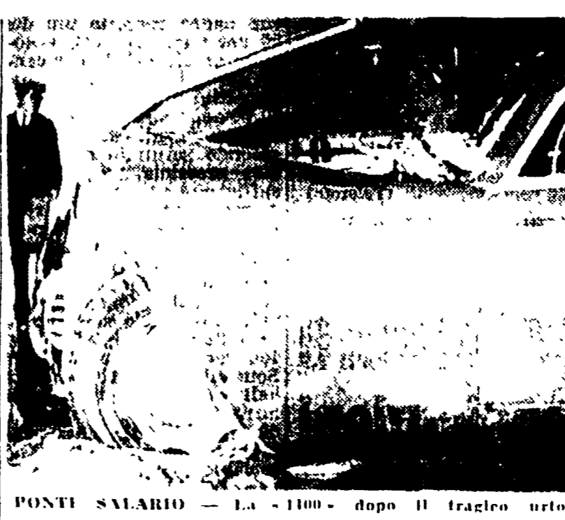
PONTI SAIARIO - La «1400» dopo il tragico urto