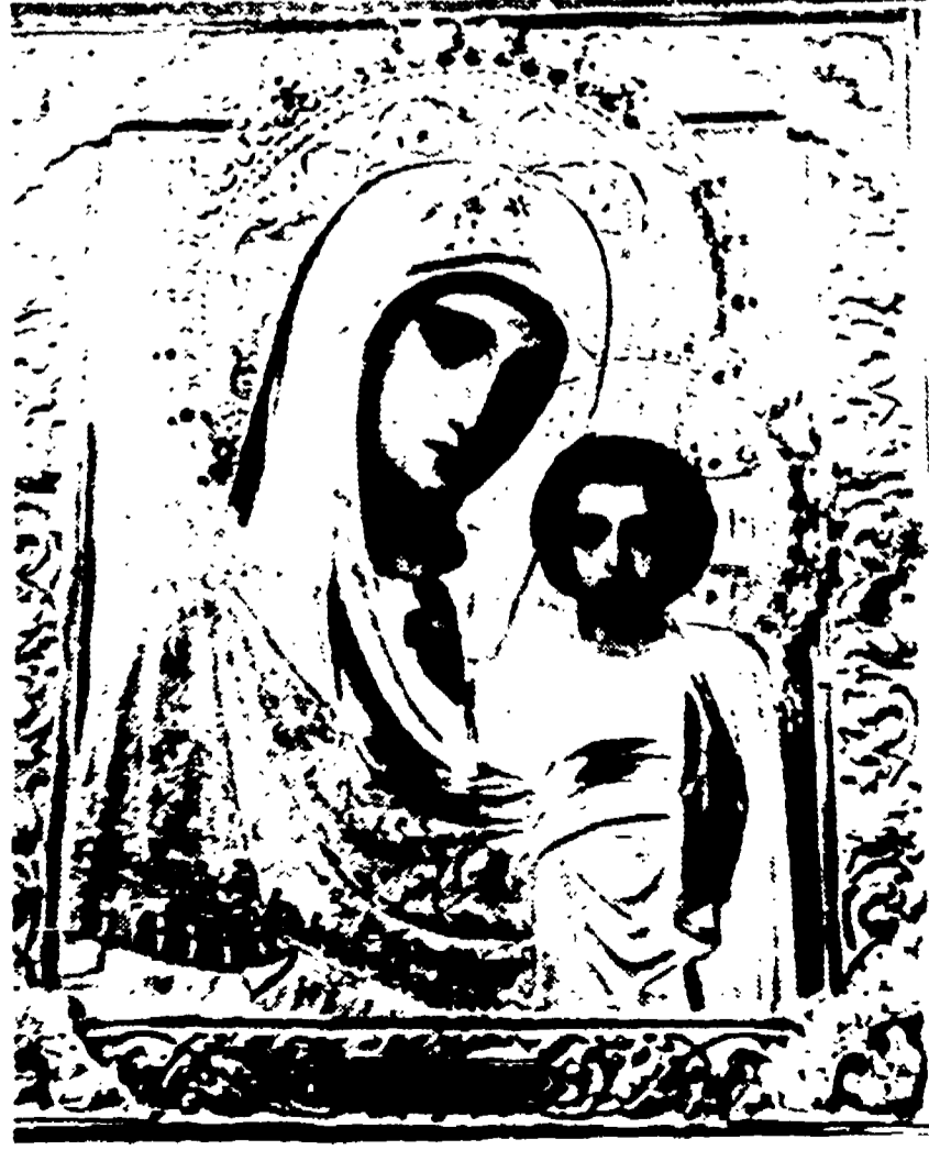
COVENTRY. - Alla cattedrale di Coventry è giunto un dono significativo. In alto, raffigurata una Madonna col Bambino, inviata dalla cattedrale di Stalingrado. Il messaggio, che accompagnava il dono, dice: «A simbolo di amicizia e di simpatia, Stalingrado e Coventry sono fra le città che più hanno sofferto nell'ultima guerra mondiale, a causa dell'aggressione nazista».