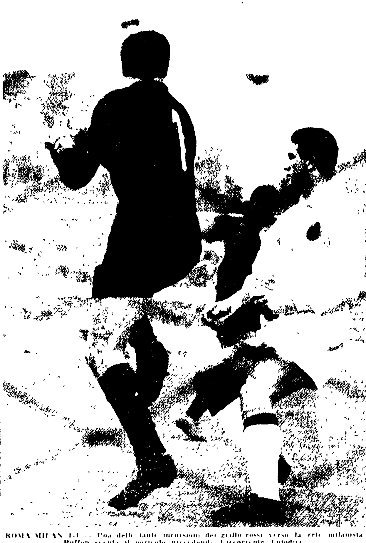
ROMA-MILAN 1-1. Una delle tante incursioni del giallo rosso verso la rete milanista...