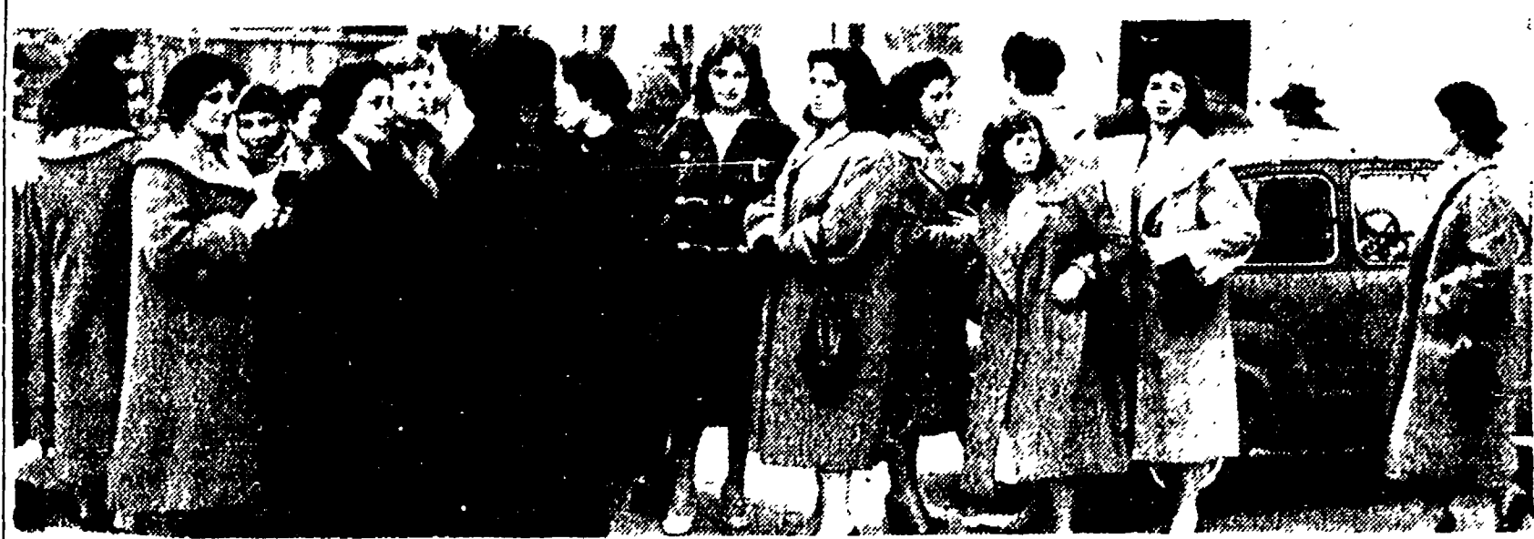
TRATTATIVE PER LA «SARACENI» - Ieri mattina le operai della «Saraceni», in sciopero da 5 giorni per rivendicare il pagamento del salario arretrato, sono confluite davanti all'ufficio del lavoro dove hanno avuto inizio le trattative. Successivamente le trattative si sono spostate presso l'azienda.