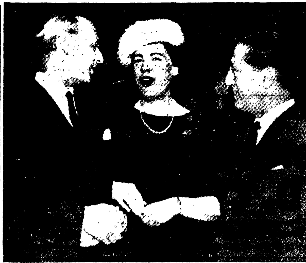
NEW YORK - Il teatro Metropolitan di New York ha offerto un ricevimento al Waldorf Astoria in onore del soprano italiano Renata Tebaldi...