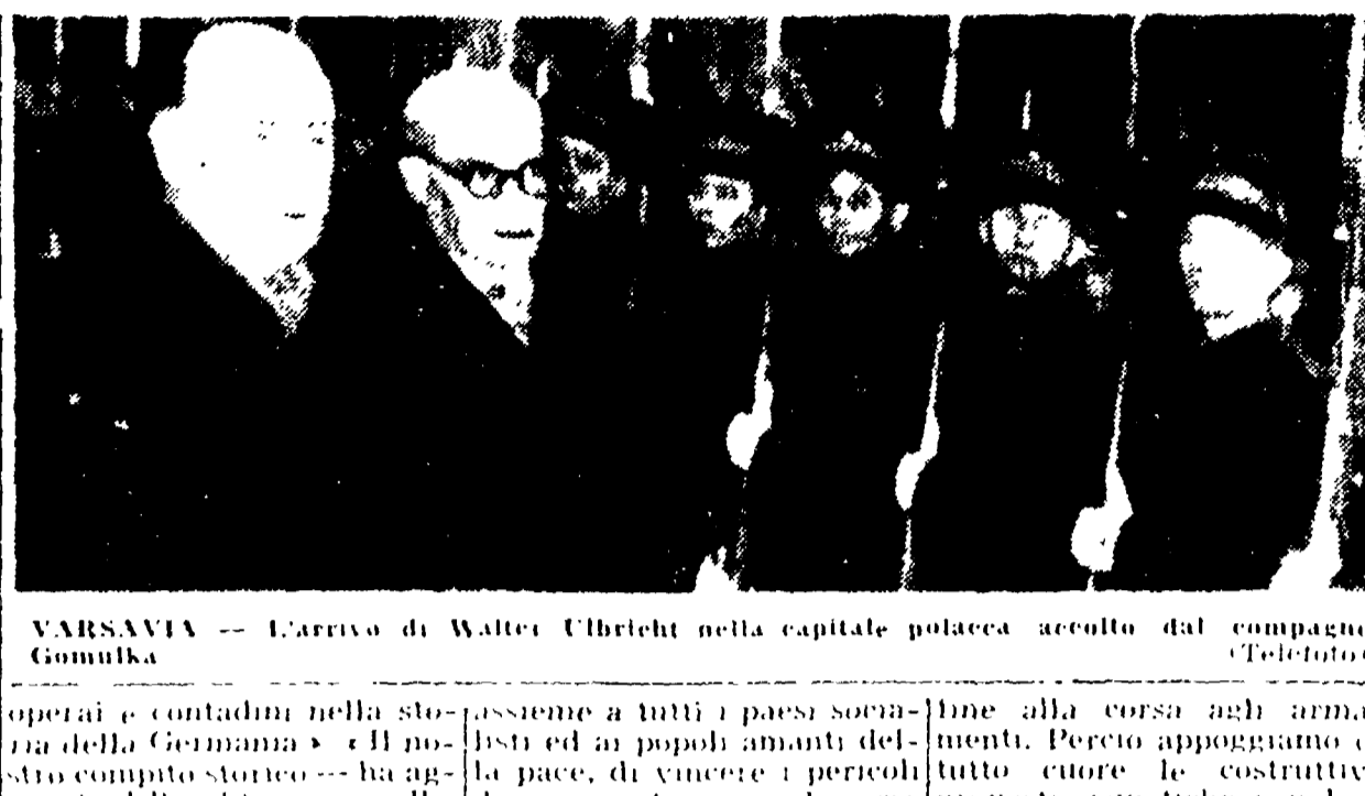
VARSAVIA - L'arrivo di Walter Ulbricht nella capitale polacca accolto dal compagno Gomulka.

Entrambi i nostri popoli che vivono nella grande famiglia dei paesi socialisti. Tutte le nostre forze unite difendiamo la libertà e la sovranità della Repubblica Democratica Tedesca e la pace in Europa.