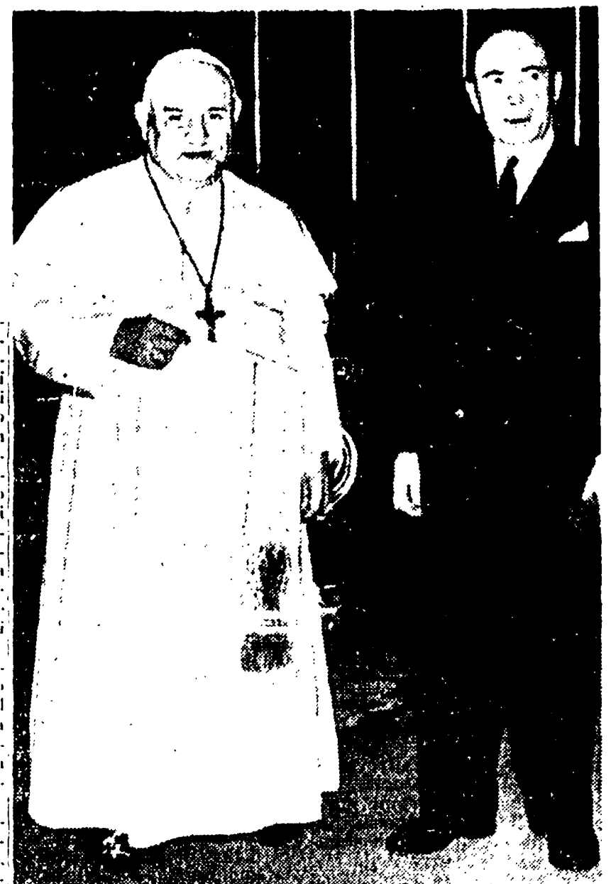
Il ministro gollista Pinay e Giovanni XXIII al termine del lungho colloquio nel quale sarebbero state gettate le basi di un concordato tra la Francia e il Vaticano

Tre ore di colloqui di Pinay col Papa e il segretario di Stato Tardini - Imbarazzo per il viaggio di Andreotti a Bonn - Confermato il limite di 60 miliardi per gli statali