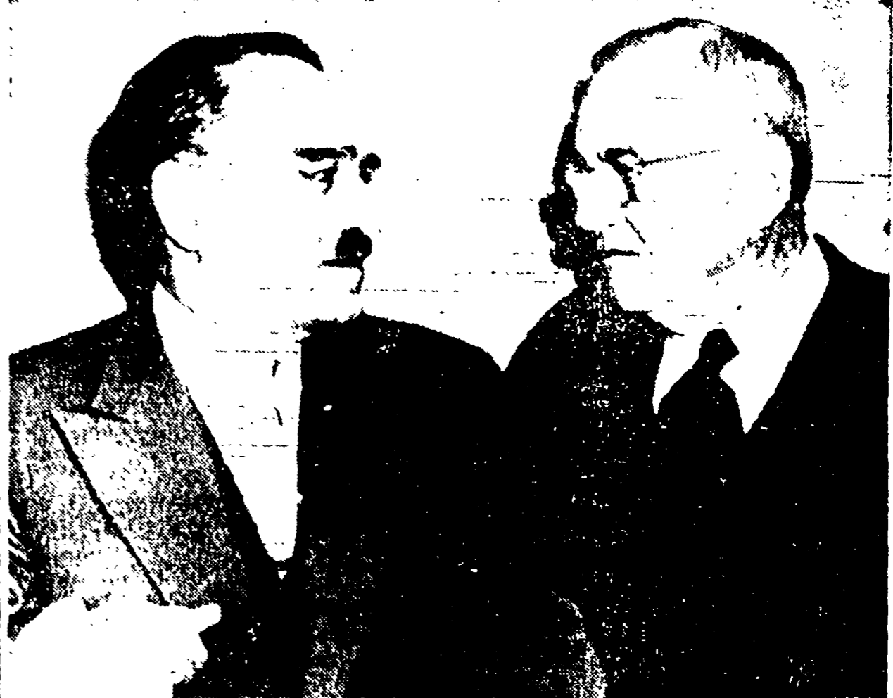
WASHINGTON - Mikojan e Foster Dulles durante il loro colloquio