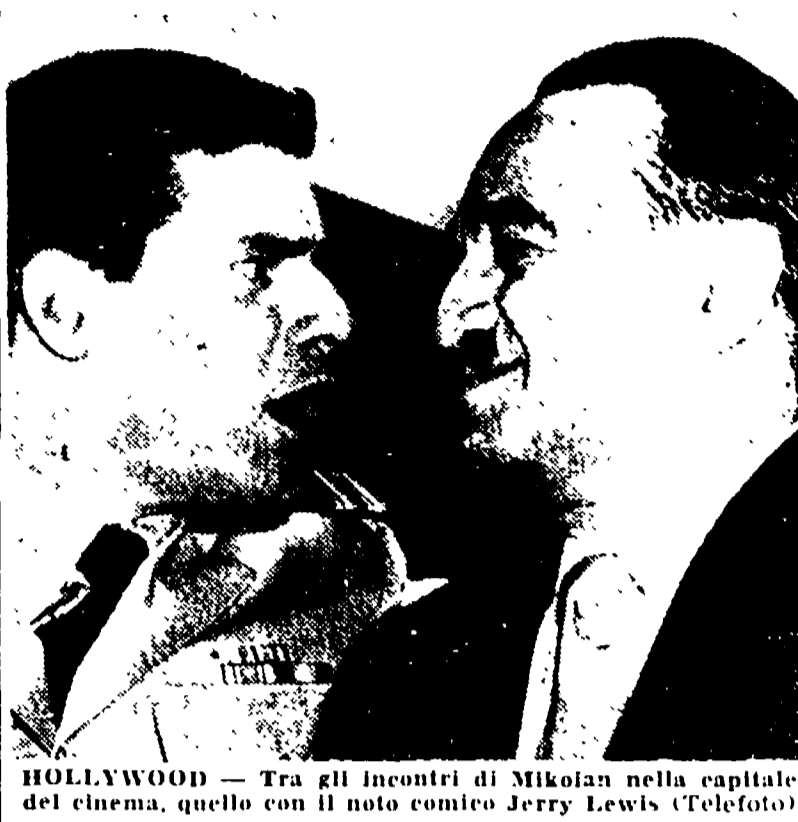
HOLLYWOOD — Tra gli incontri di Mikoyan nella capitale del cinema, quello con il noto comico Jerry Lewis

WASHINGTON, 14. — Mikoyan ha iniziato oggi il suo soggiorno newyorchese partecipando al banchetto offertogli, come preannunciato dalla First National City Bank. I contatti con gli uomini d'affari della grande metropoli statunitense — tra i più importanti che egli abbia avuto finora — occupano quasi per intero i due giorni che lo statista sovietico trascorre a New York. Domani sera Mikoyan ripartirà per Washington per incontrare Dulles e, successivamente Eisenhower.