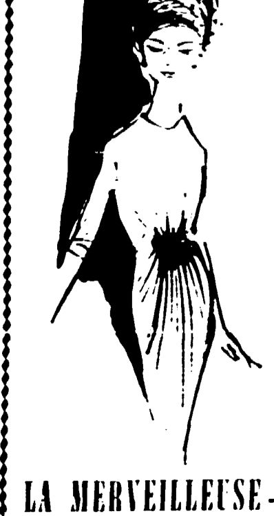
LA MERVEILLEUSE - Roma - Via Condotti, 12