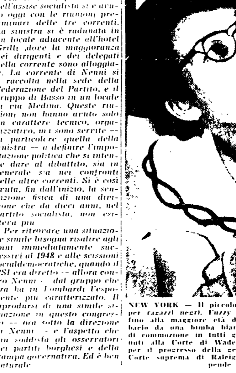
NEW YORK - Il piccolo Fuzzy Simpson con la madre in una stanza del riformatorio per ragazzi neri...