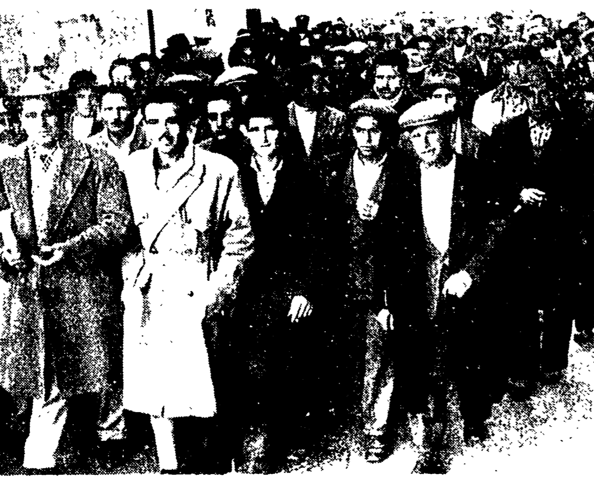
MANDURIA - I braccianti in sciopero manifestano per le vie cittadine al grido di "L'impossibile non si tocca"