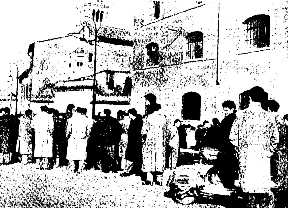
VIA DELLA GRECA — I disoccupati davanti all'Ufficio di collocamento

Il comizio che l'on. Cianca avrebbe tenuto venerdì mattina alle ore 10,00, in via della Greca, a disoccupazione, è stato vietato dalla Questura all'ultimo momento con la motivazione che si tratterebbe di un comizio di tipo "disturbato".