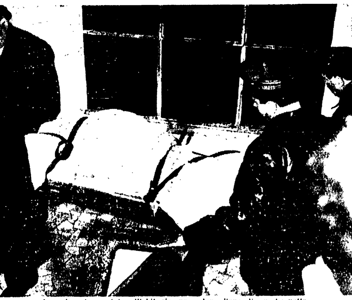
La salma trasportata all'obitorio, poco dopo l'una di questa notte

strana. Ad ogni modo, gli ufficiali inquirenti stanno vagliando la testimonianza che potrebbe anche risultare erronea.