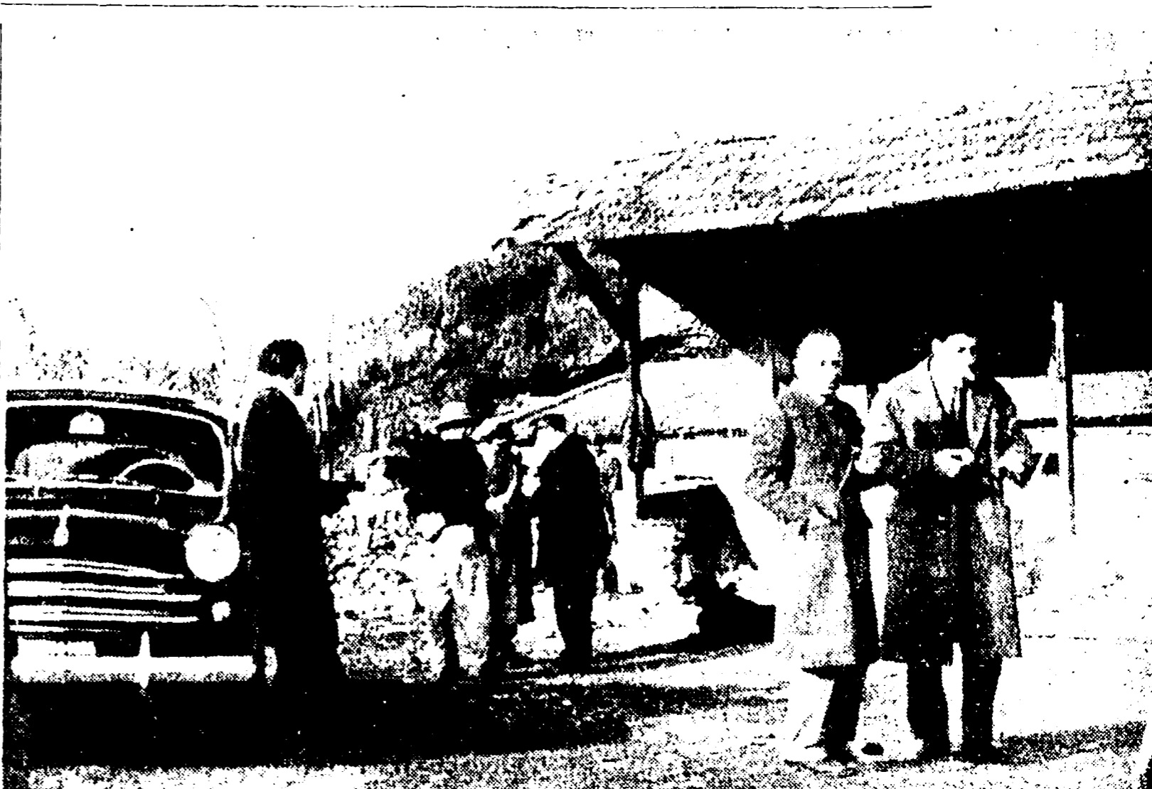
CASTEL DI LEVA — Polizia e carabinieri nella fattoria dove il contadino ha fatto il macabro rinvenimento

Un bambino nato da sole tre quattrini era stato ucciso e tagliato a pezzi e poi gettato nella pattumiera. I resti del corpo erano stati trovati in un mucchio di rifiuti da un automezzo del Comune nella zona di piazza Annibaliano, via Massaciucoli e corso Trieste.