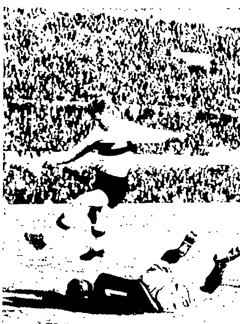
BOLOGNA-ROMA 1-0 - Selmusson non ha difeso al meglio delle sue possibilità contro i petroniani. Nella ripresa...