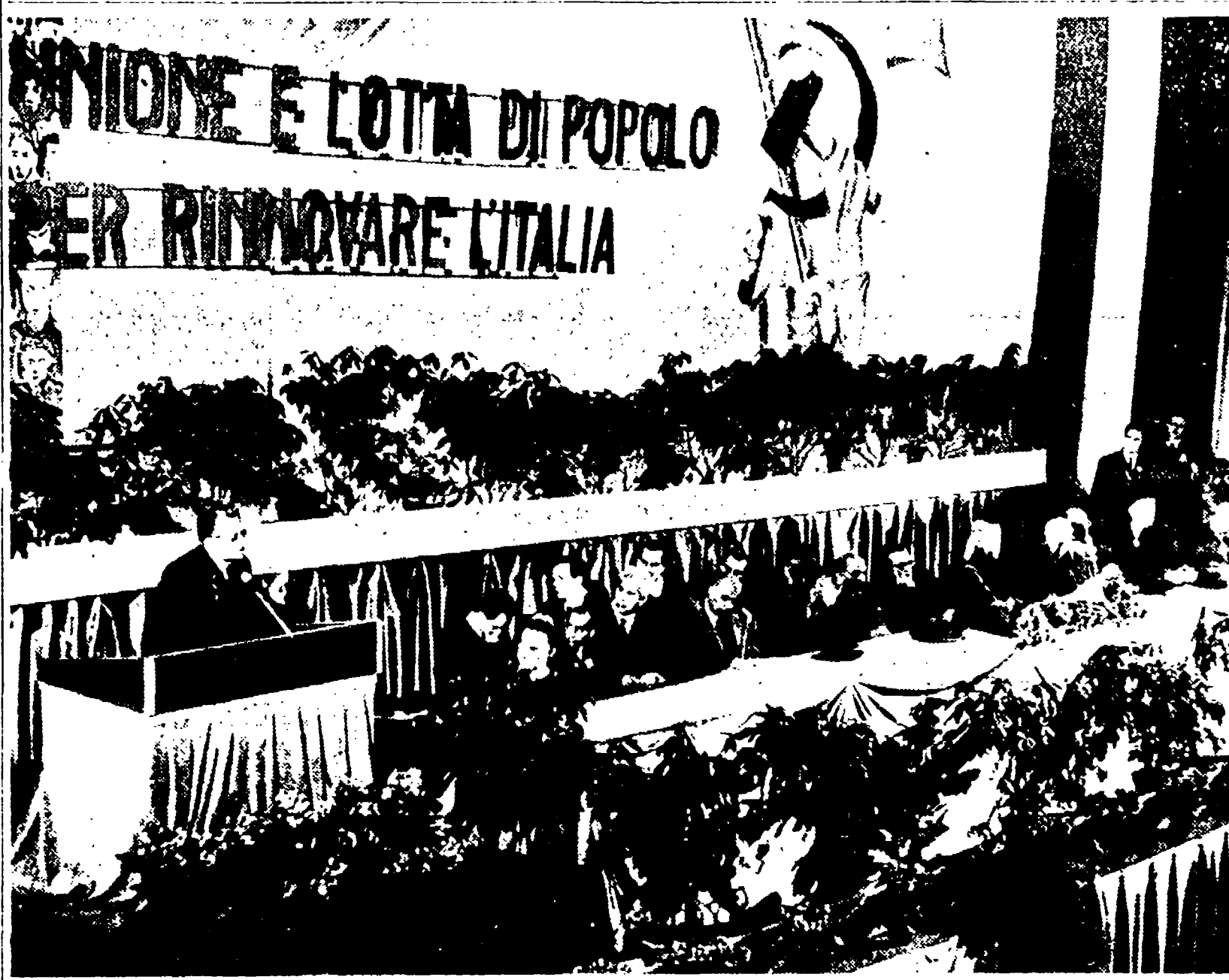
Un aspetto della presidenza durante il discorso del compagno Palmiro Togliatti all'Adriano