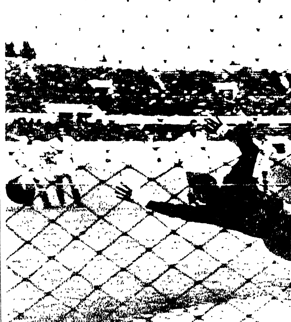
LA DOMENICA SPORTIVA Bologna, Fiorentina e Milan. La Juventus e l'Inter hanno accreditato le difese delle prime scorse...

L'Inter e la Juventus battono il Milan e la Fiorentina