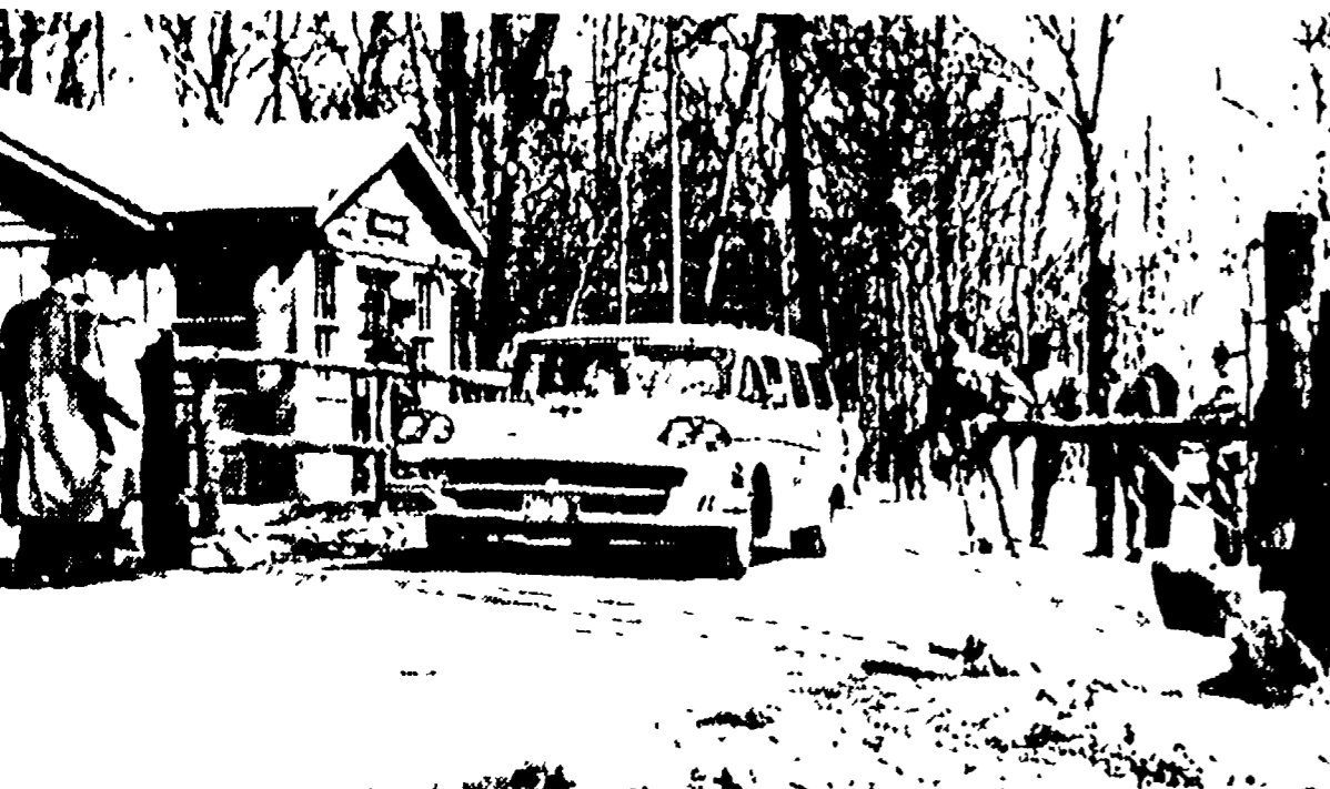
THURMOND (Cavaliere) Soldati del corpo dei marines e poliziotti del servizio segreto controllano accuratamente ogni punto di accesso a Camp David...