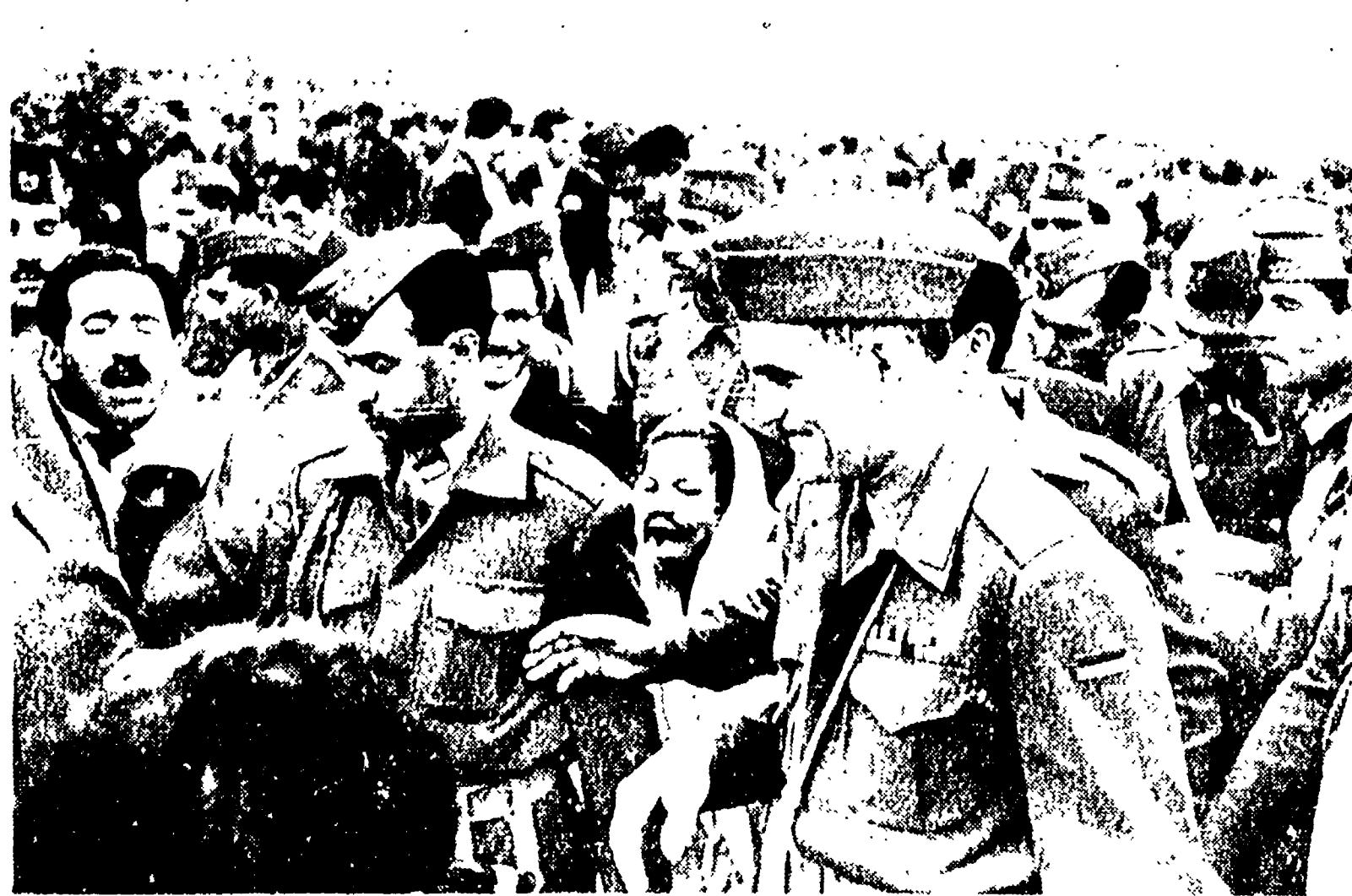
BAGHDAD - Il premier irakeno Kassem affollato da ufficiali e soldati mentre si accinge a fare un discorso nel corso del quale ha respinto le accuse di Nasser.

Nuovo attacco di Nasser a Kassem, ai comunisti e all'URSS - Bandite-sco attacco contro la sede del giornale libanese di sinistra «Al Akhbar»