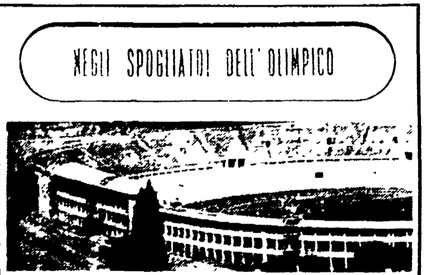
MEGLI SPOGIATORI DELL'OLIMPICO