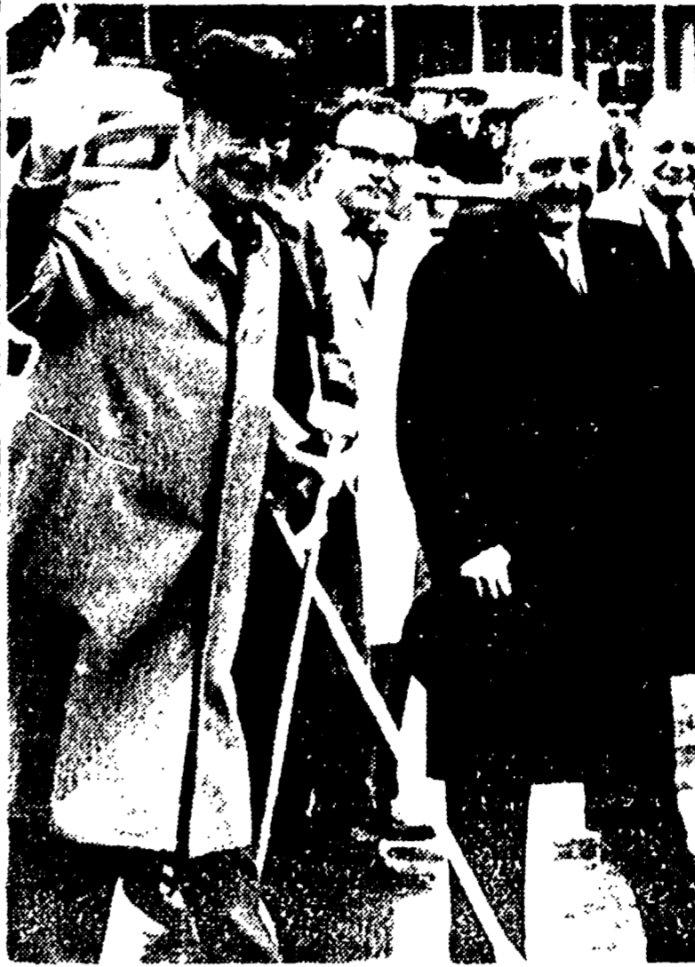
PARIGI - L'arrivo nella capitale francese del segretario di Stato Christian Herter...