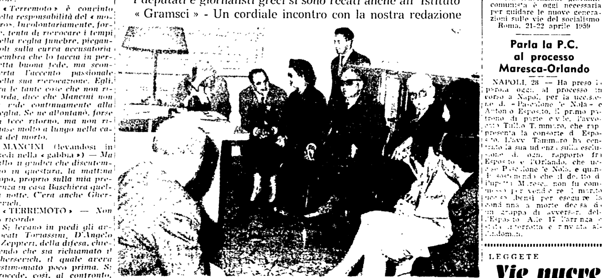
I deputati e giornalisti greci si sono reati anche all'Istituto « Gramsci » - Un cordiale incontro con la nostra redazione

La delegazione di deputati e giornalisti greci giunta a Roma, ha avuto un cordiale incontro con la nostra redazione all'Istituto « Gramsci ».