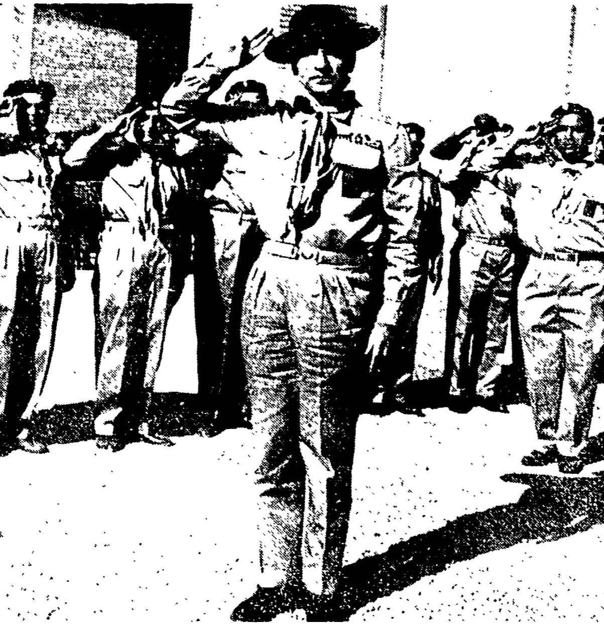
Mentre Soraya continua la sua 'quasi luna di miele'...

I NUOVI PERSONAGGI DELLA NOSTRA VITA QUOTIDIANA