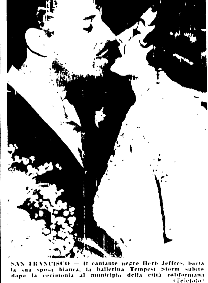
SAN FRANCISCO. - Il cantante negro Herb Jeffries, bacia la sua sposa bianca, la ballerina Tempest Storm subito dopo la cerimonia al municipio della città californiana.

ATENE, 22. - Il giornale governativo Kathimerini è stampato con personale militare - è stato il solo quotidiano ad uscire questa mattina ad Atene, dove è stato proclamato lo sciopero dei tipografi.