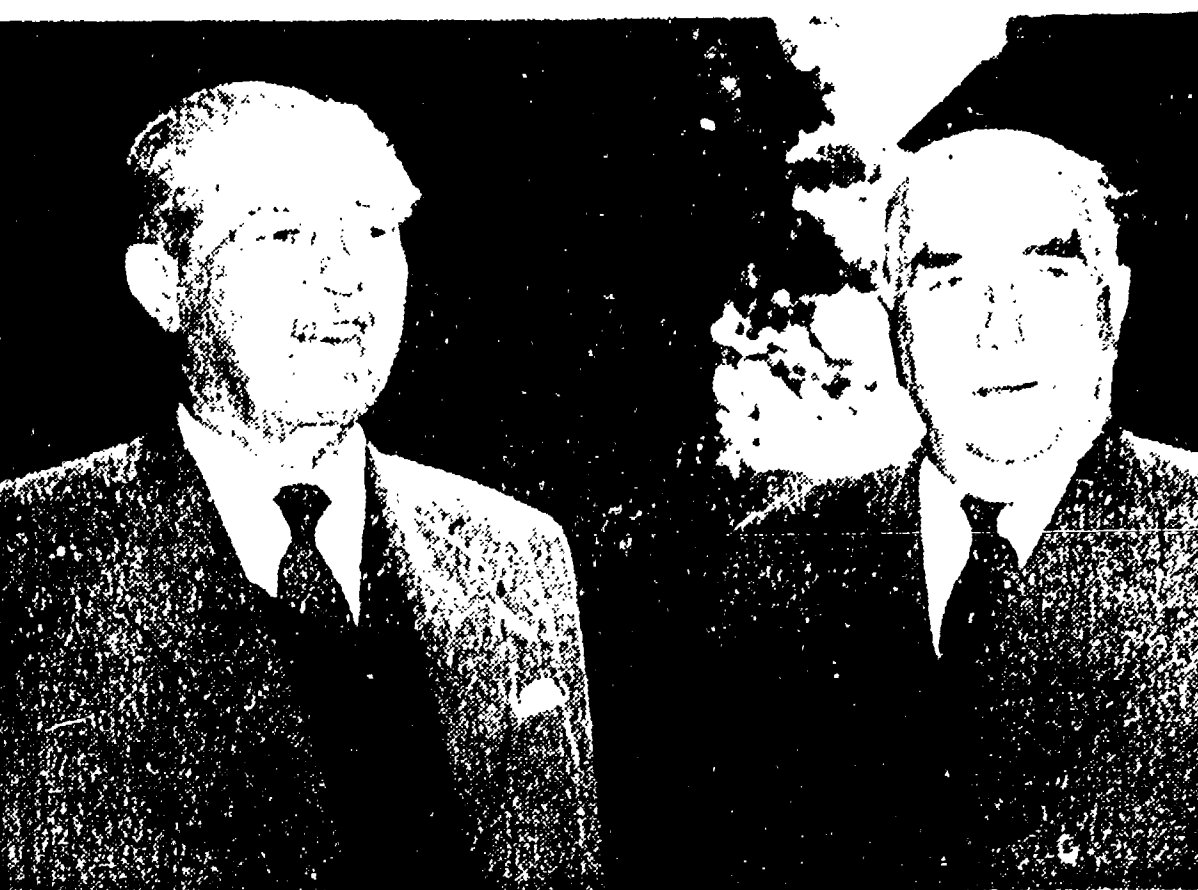
LONDRA. — Il primo ministro australiano Menzies (a destra) si è incontrato ieri con Macmillan. Il sig. Menzies, che sta facendo una crociera politica per discutere i maggiori problemi internazionali, si recerà nei prossimi giorni a Parigi e a Bonn. Egli sarebbe un sostenitore della tesi di Macmillan favorevole all'incontro al vertice a presiedere dei risultati della conferenza in corso a Ginevra.

L'intransigenza di Gromiko? E' falso. In questa conferenza, forse più che in ogni altra, il ministro degli Esteri dell'URSS si è adoperato in tutti i modi, e sino all'ultimo, per facilitare un accordo.