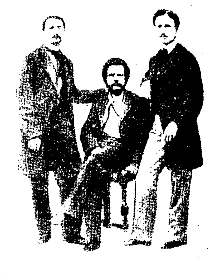
Giuseppe Carducci tra Garibaldi e Chiarini nel 1857