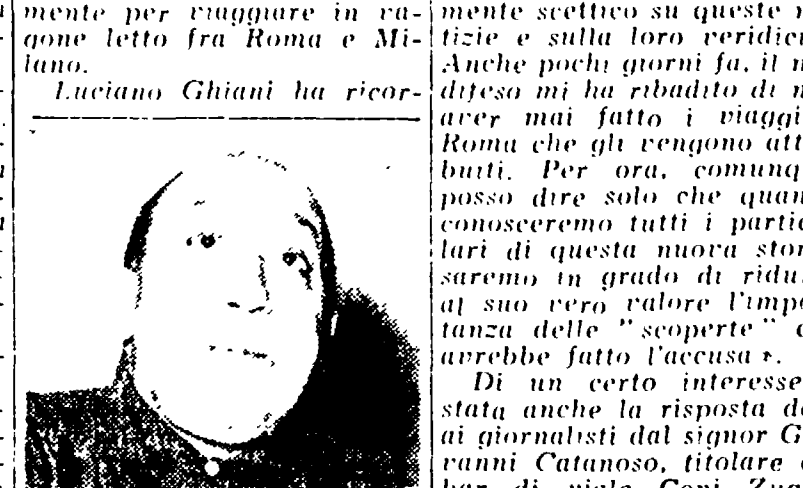
Luciano Ghiani ha ricor-

parlato anche i senatori NENCIONI (msd), SANSONE (psi) che ha svolto una impudica diatribe di critica legislativa, criticando in particolare alcune sentenze della Cassazione ed attaccando una riforma generale. Egli ha annunciato il voto contrario dei socialisti al bilancio, e il sen. AZARA (dc) che ha auspicato un piano generale di coordinamento per l'amministrazione della giustizia. Oggi il Senato continuerà la discussione sul disegno di legge per l'amnistia. Firmato da Gronchi il Codice della strada Il testo unico delle norme concernenti la disciplina della circolazione stradale è stato firmato ieri mattina dal Presidente della Repubblica. Il testo del nuovo codice della strada verrà pubblicato dalla Gazzetta Ufficiale per entrare in vigore, come stabilito, il 1. luglio prossimo.