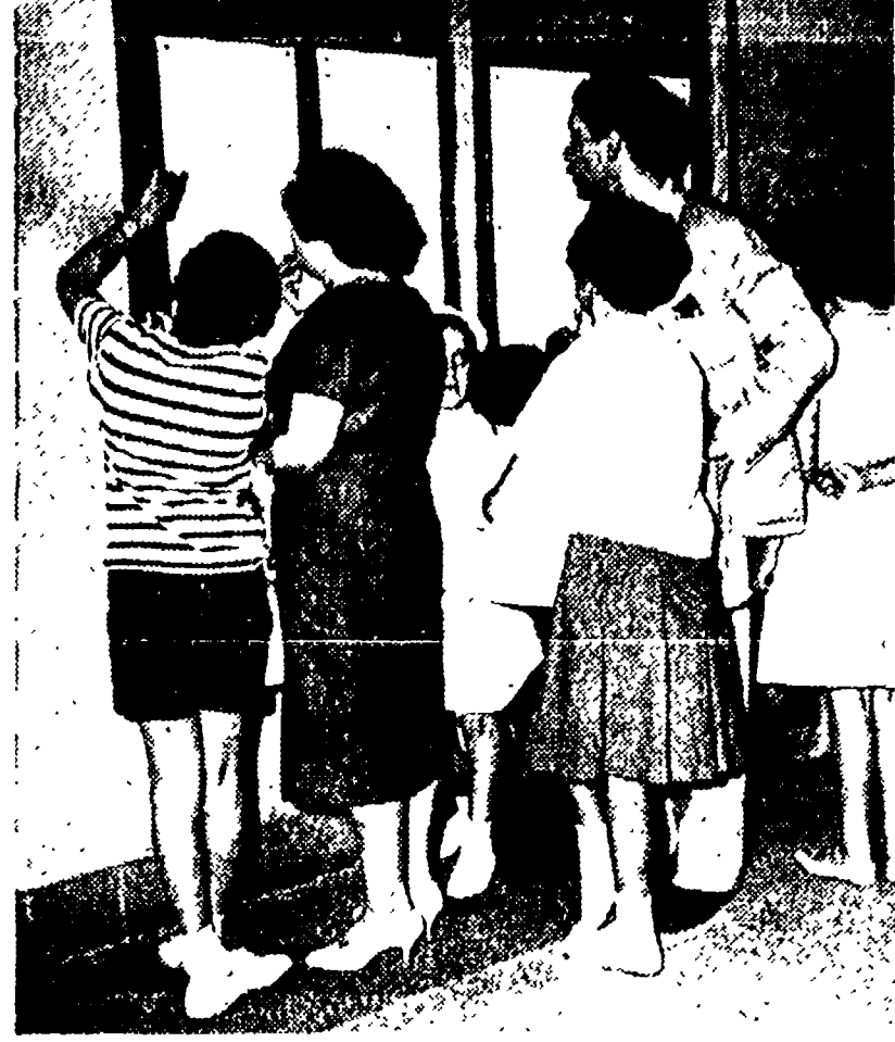
Genitori ed alunni davanti ai quadri di una scuola romana

me motivo di preoccupazione, anzi di allarme. Ogni anno, miliardi e miliardi vengono investiti nella preparazione al lavoro intellettuale o manuale delle giovani generazioni. Sono pochi, non bastano, d'accordo. Ma, intanto, come vengono impiegati? E le ansie, le preoccupazioni, i sacrifici di milioni di famiglie e di questi bistrattatissimi alunni, possono ripagarsi? È possibile che questi in media o più della metà dei bambini e ragazzi italiani sia composta di incapaci, di ritardati, di inadatti allo studio, di cervelli inferiori alla media? O non dobbiamo pensare, piuttosto, che la grande malattia è la scuola, come del resto vanno dicen-