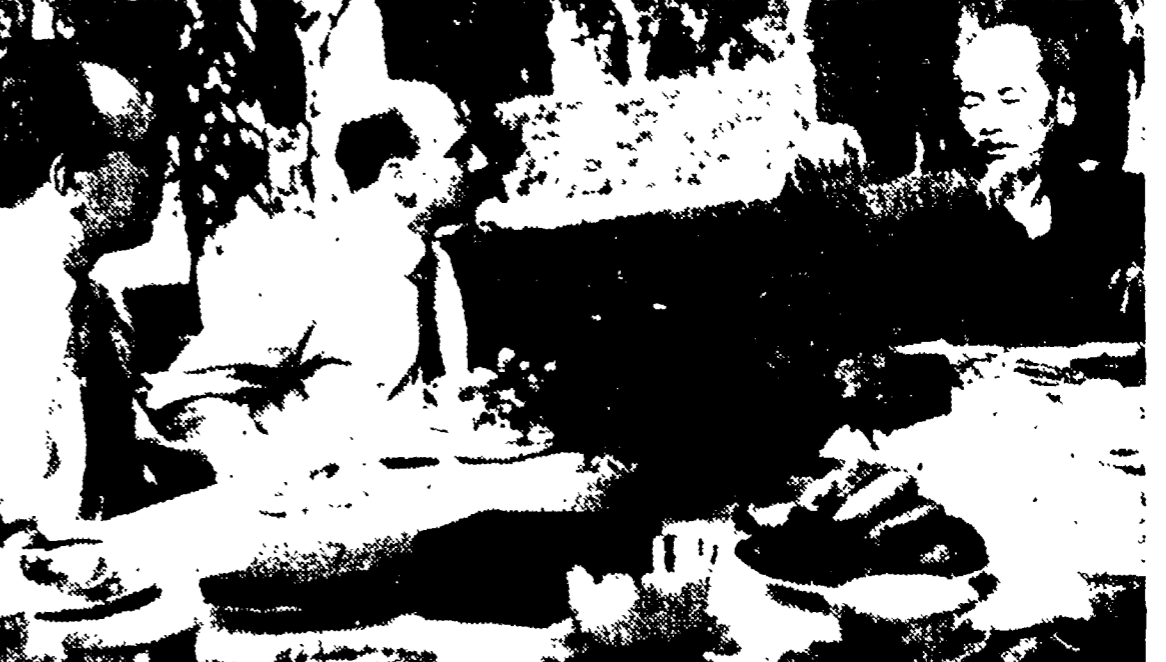
In un'intervista concessa agli inviati de «L'Unità», il presidente della Repubblica democratica del Vietnam, Ho Chi Minh, ha risposto a numerose domande sulla situazione internazionale nell'Asia e sui problemi che si pongono al popolo vietnamita cinque anni dopo il ritorno alla libertà e pubblicata oggi in dodici pagine...