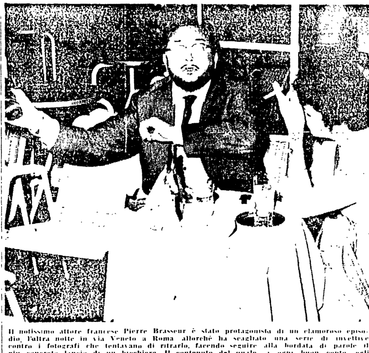
Il notissimo attore francese Pierre Brasseur è stato protagonista di un clamoroso episodio. L'altra notte in via Mendicanti ha scagliato una serie di invettive contro il potere che tentavano di ritardare facendo seguito alla bordata di parole il più concreto lancio di un boicottaggio.

Il notissimo attore francese Pierre Brasseur è stato protagonista di un clamoroso episodio. L'altra notte in via Mendicanti ha scagliato una serie di invettive contro il potere che tentavano di ritardare facendo seguito alla bordata di parole il più concreto lancio di un boicottaggio. Il contenuto del quale, a ogni buon conto, egli si era precedentemente versato sul collo, forse, data la serata calda, a seppia refrigerante.