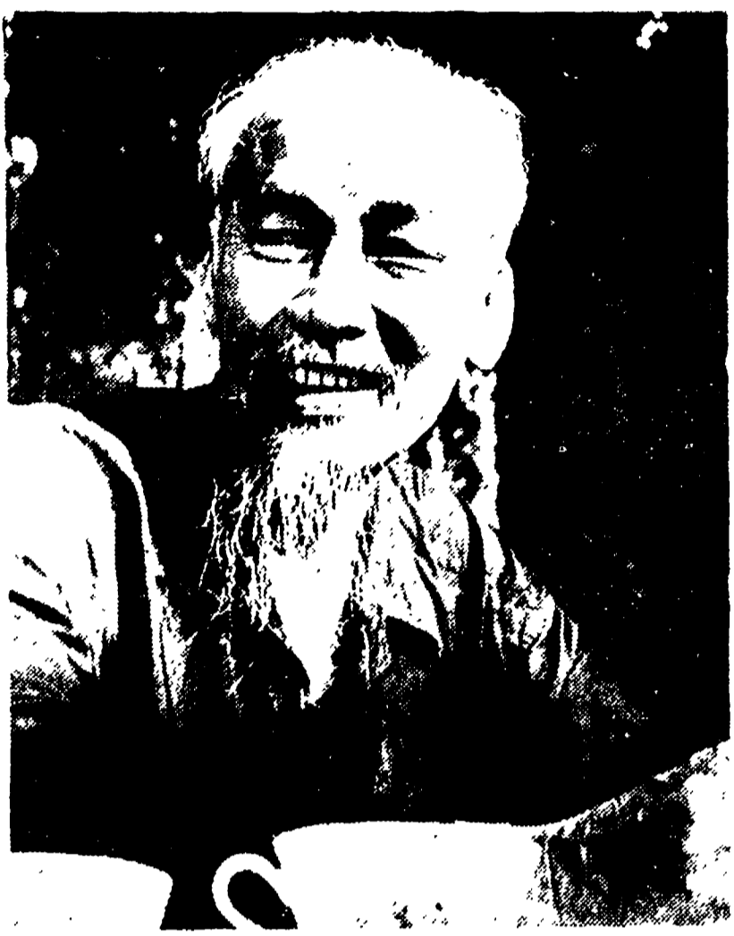
Il presidente del Viet Nam, compagno Ho Ci Min

Buoni i rapporti con i paesi neutralisti dell'Asia - Progressi e difficoltà nella costruzione postbellica - Due rivoluzioni: quella democratica nel Sud e quella socialista nel Nord