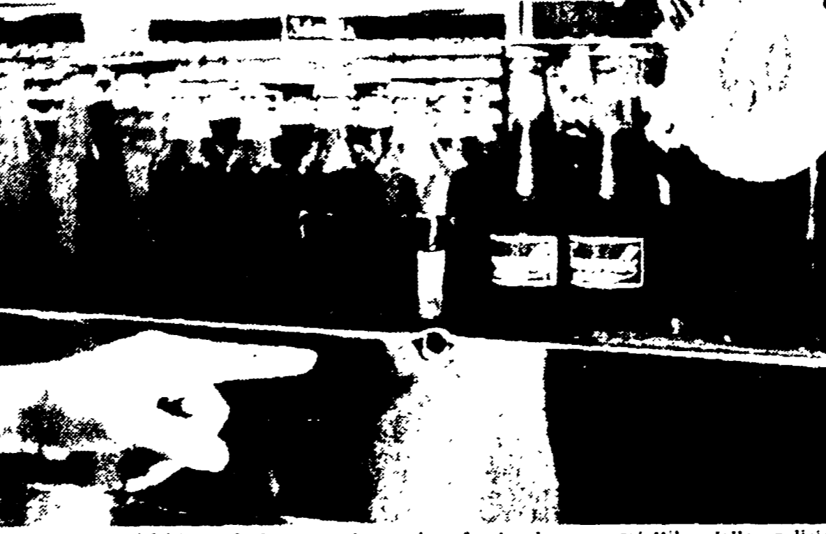
TORRE DEL GRECO - Il barbone di un bar colpito da un proiettile della polizia

Avverte che la minima provocazione basterebbe ad accendere una nuova scintilla. L'affluire continuo dei battaglioni di polizia aggravava il pericolo in una folla che non vuole essere più calpestata ed offesa soltanto perché chiede lavoro e un giusto salario.