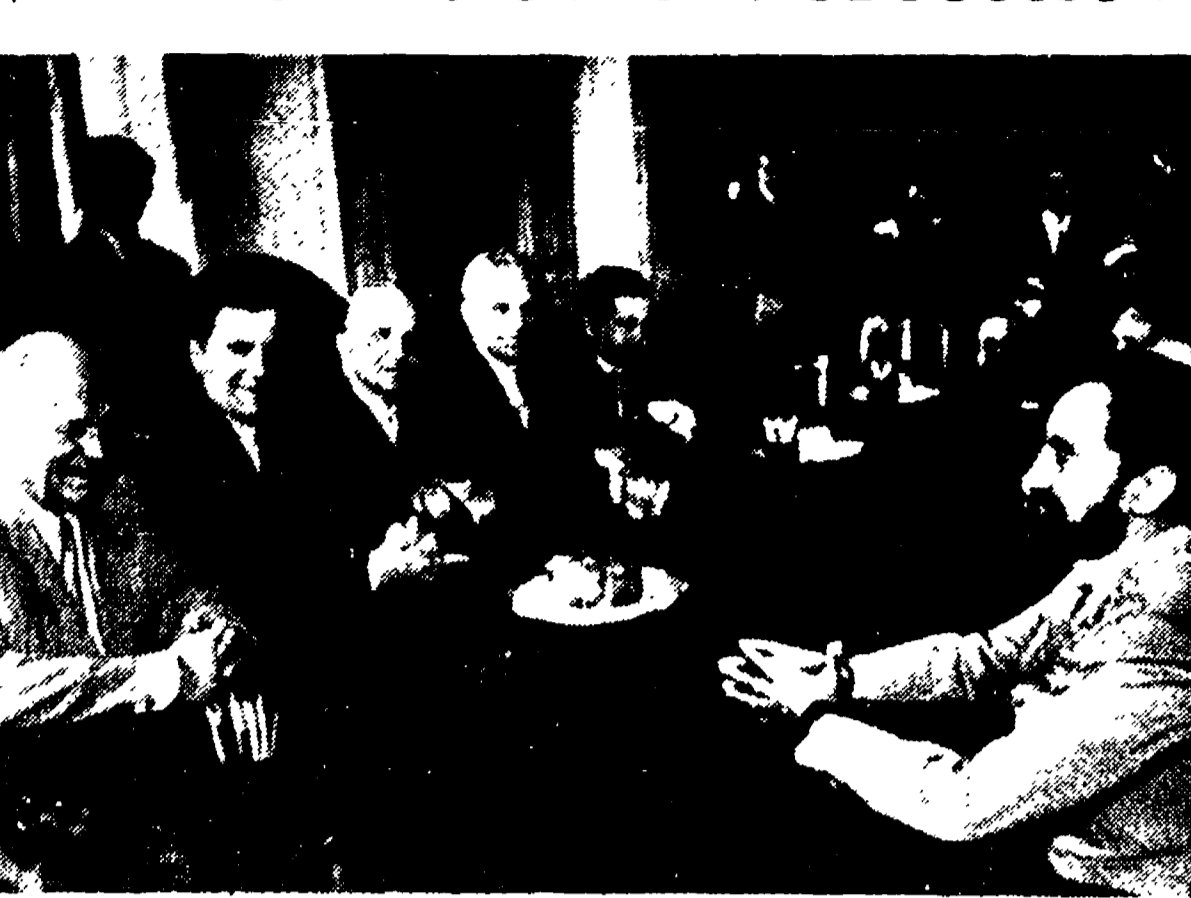
MOSCA - Il premier sovietico Krusciov ha avuto ieri un colloquio al Cremlino con l'imperatore etiopico Hailè Selassie...