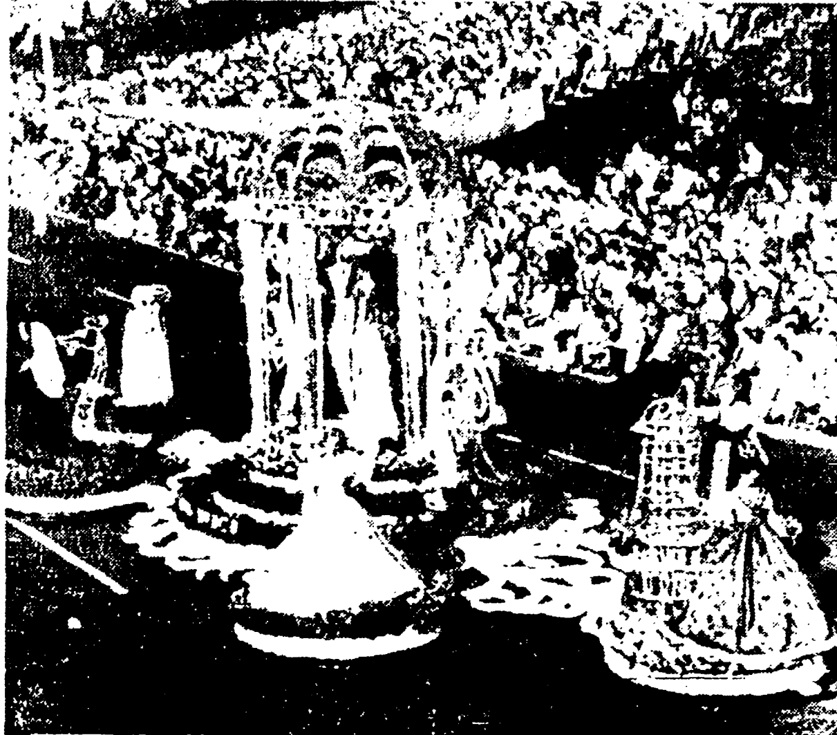
LONG BEACH (California) — Il carro floreale vincitore dell'annuale parata delle rose che si svolge a Capodana per la quale sono state usate 100.000 orchidee e 6.000 rose. Il carro, denominato «Venere di Milo», rappresenta un tempio al centro con intorno sei ragazze di differenti paesi in piedi su piattaforme di fiori.