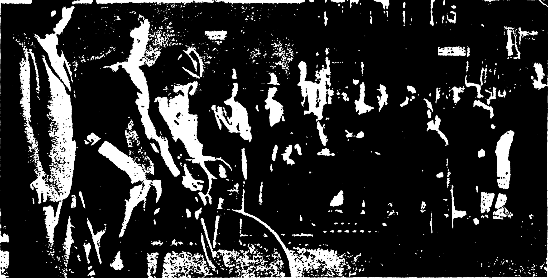
7 NOVEMBRE 1942: FAUSTO STA PER SCATTARE

● Una rara immagine: il campione si appresta a scattare nel risicato tentativo di battere il primato dell'ora. Era il 7 novembre 1932. Poi la tragica pausa della guerra e della prigionia dalla quale sarebbe ritornato per conquistare di nuovo popolarità e vittorie.