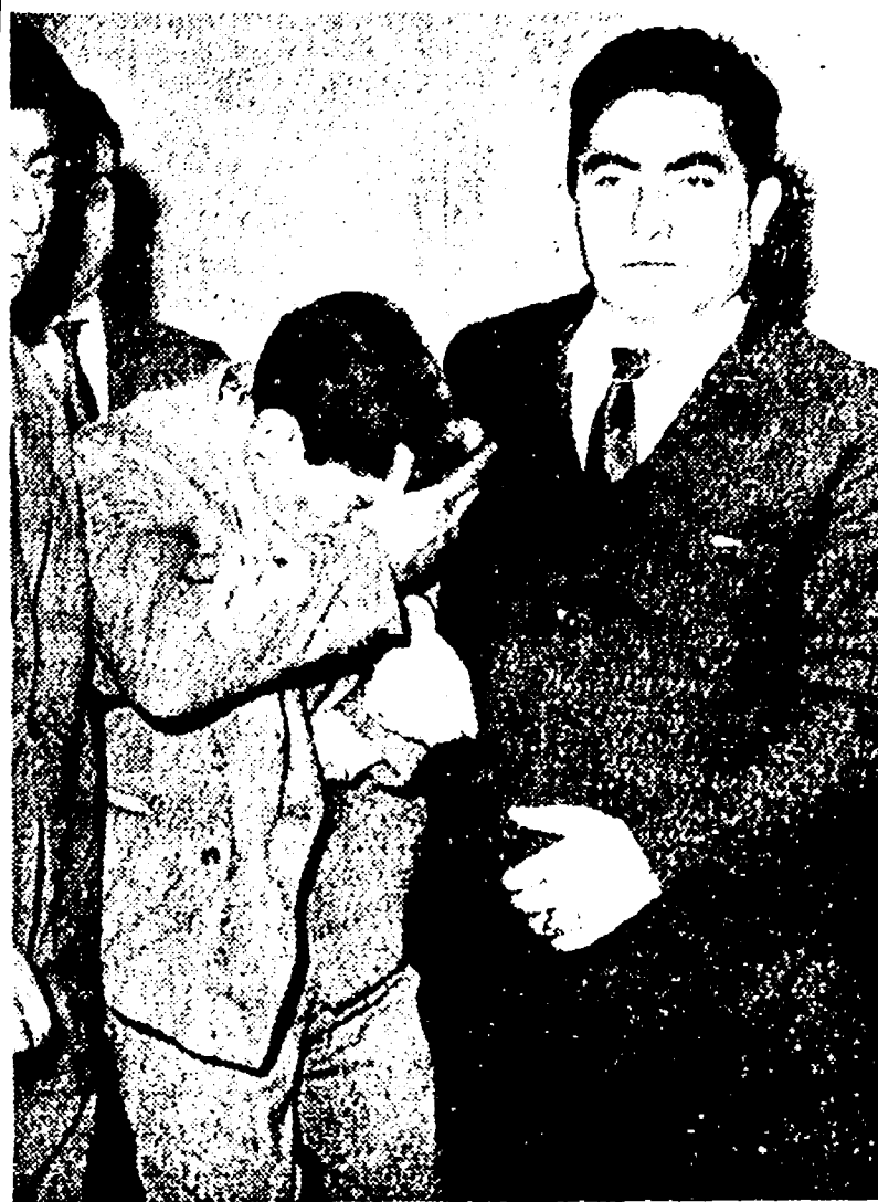
Il Mancini mentre viene condotto alla Mobile

La poveretta ricoverata al S. Giovanni per ferite all'emitorace - L'uomo aveva già tentato di uccidere la donna - Una penosa situazione familiare