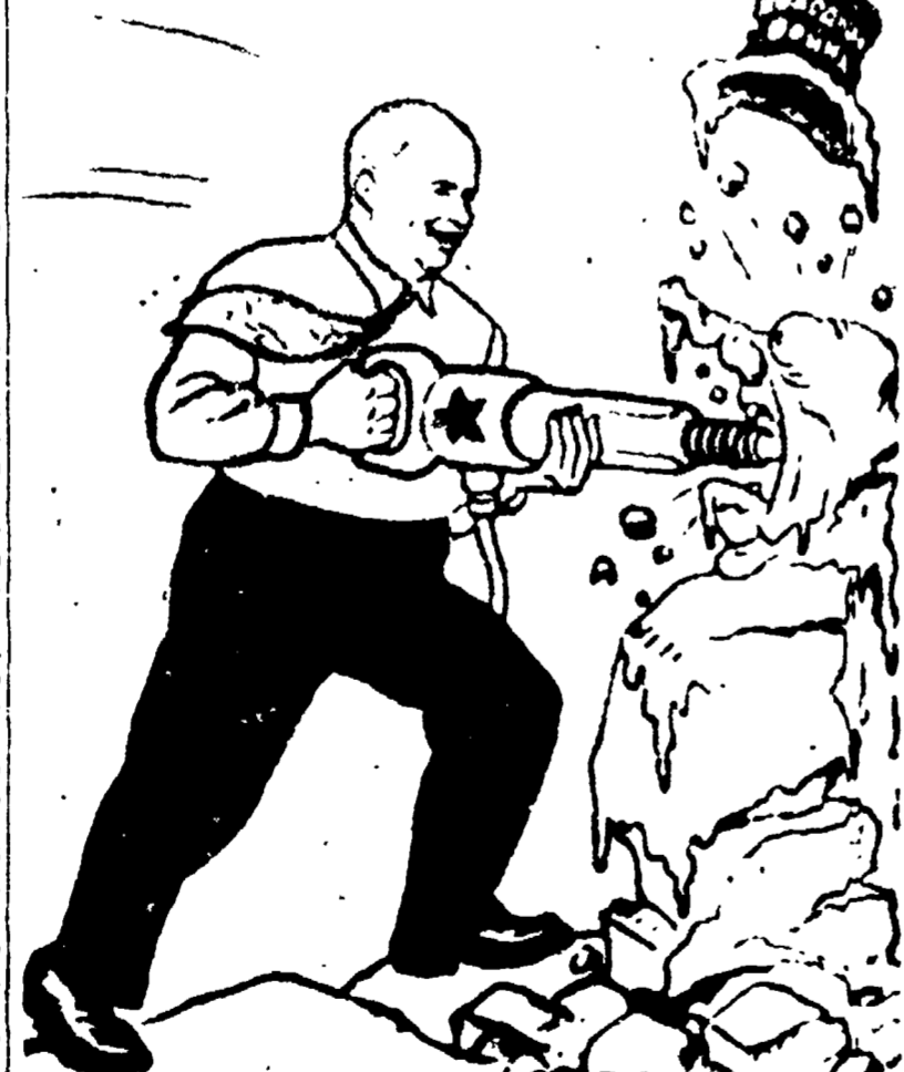
MOSCA - Questa vignetta è apparsa oggi sulla «Pravda» raffigurando un martello pneumatico che distrugge una statua di ghiaccio su cui s'appella a una servita in russo che significa «guerra fredda». La vignetta è di Boris Filmor