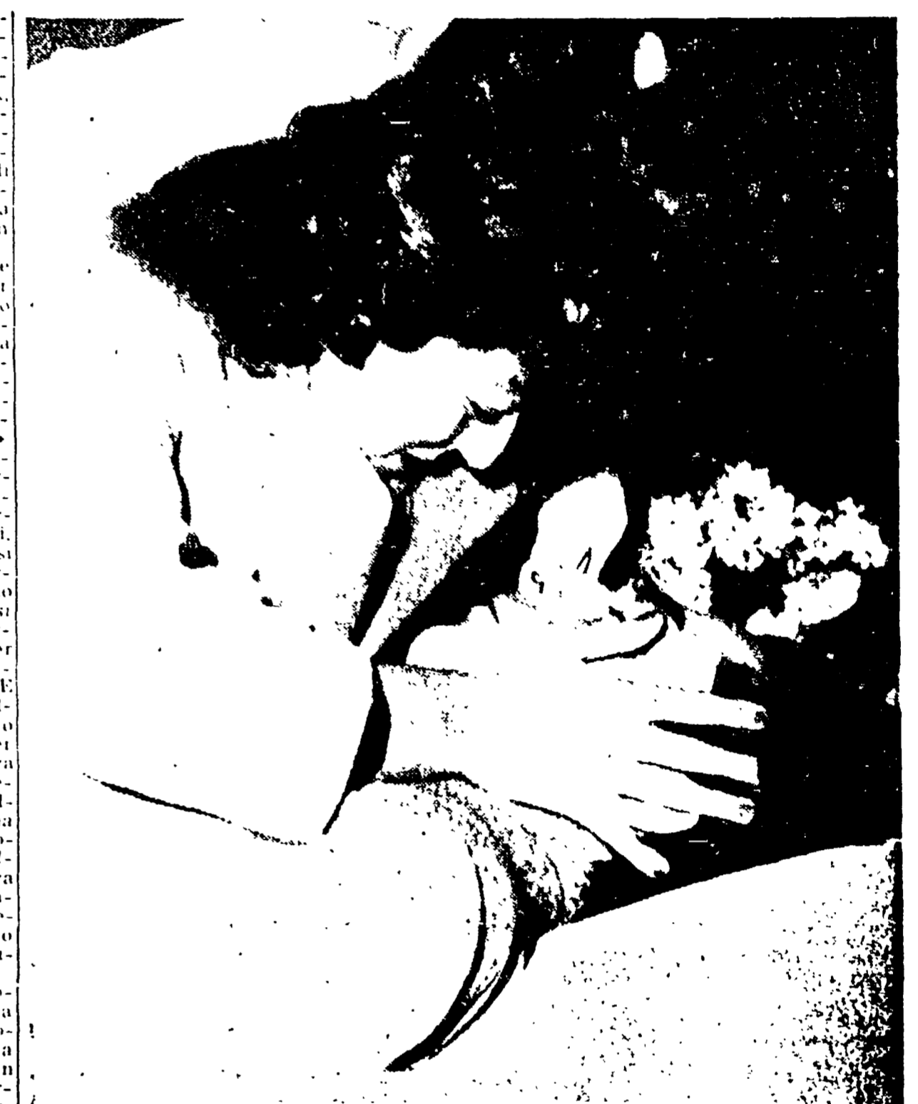
TORTONA - La compagna del campione, Giulia Occhini, abbraccia disperata il volto di Fausto Coppi composto sul letto di morte