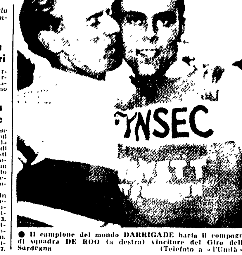
Il campione del mondo DARRIGADE bacia il compagno di squadra DE ROO (a destra) vincitore del Giro della Sardegna.

l'arabba, la corsa si è conclusa in un attimo di grazia e fuga ad un tempo di 25', con un vantaggio di 25', dura fino in vista di Sassari.