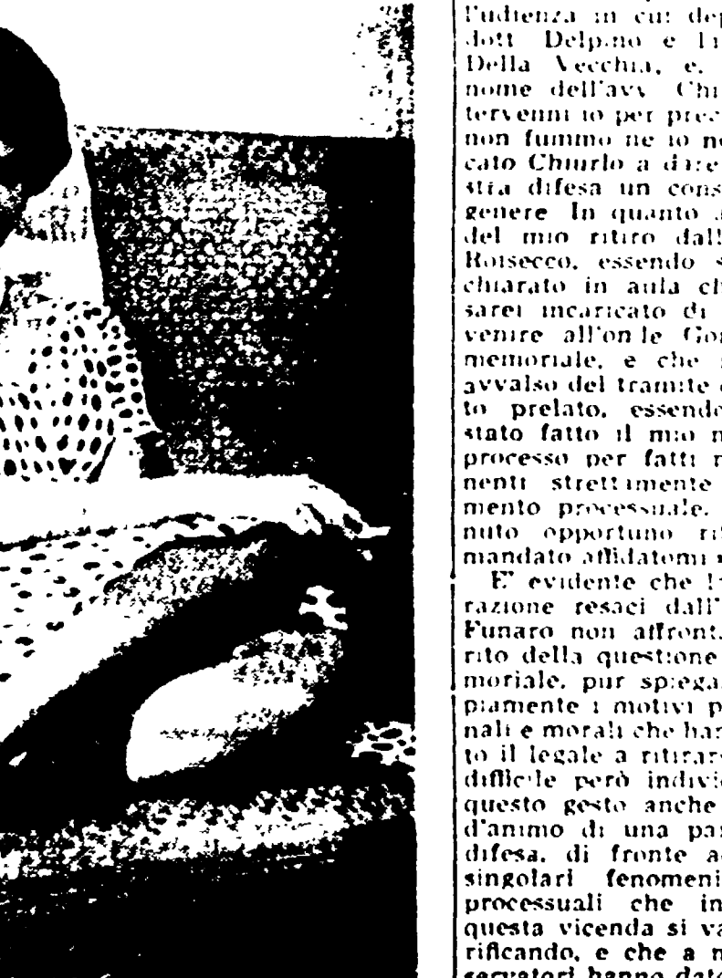
SOPHIA LOREN diviene ogni giorno più bella e più sexy. Ecco come appare in «QUEL TIPO DI DONNA», l'ultima sua magnifica interpretazione in programmazione in questi giorni a Roma. Finalmente tornata ai ruoli che le procurano i primi entusiasmi successi, Sophia ha ritrovato tutta l'ammirazione e l'affetto del pubblico italiano.