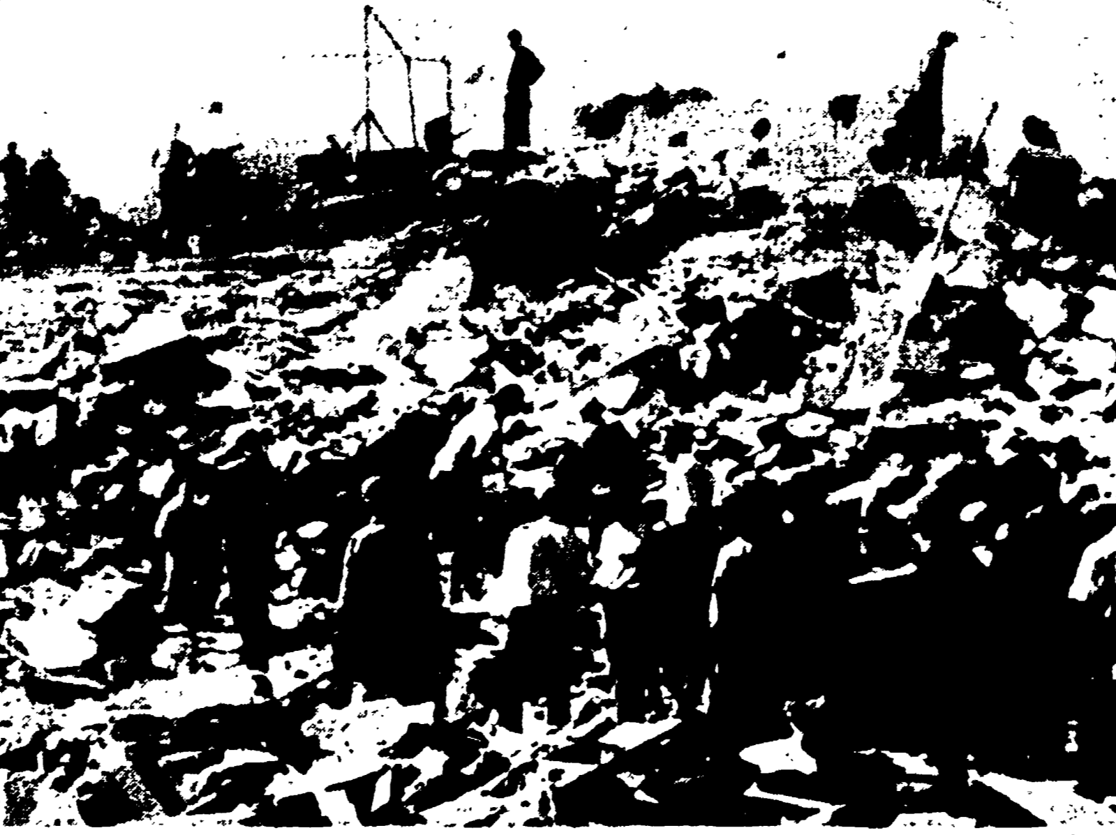
AGADIR - Un gruppo di soccorritori al lavoro per la ricerca di eventuali sopravvissuti

Salvata una donna che ha dato poco dopo alla luce un bimbo - Nuova scossa tellurica avvertita ieri sera