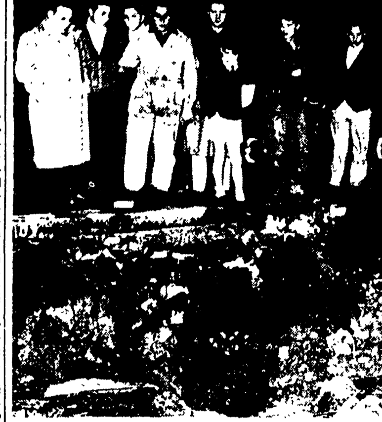
La voragine che si è aperta nell'asfalto

Sono accorsi i Vigili del fuoco e i tecnici dell'ACEA - Scantinati, seminterrati e un cantiere edile allagati