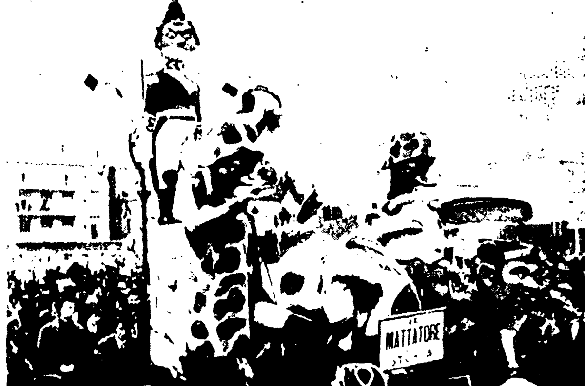
Il complesso « Il mattatore » che ha originato le grottesche proteste dei missini

La turbinosa storia del complesso « Il mattatore » - La gioventù bruciata e i « blue jeans » - La via del petrolio