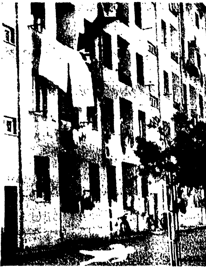
LIVORNO - Un bimbo di 13 mesi, Massimo De Rolle, è precipitato dal terrazzo della sua abitazione, rimanendo illeso. Il piccolo, eluso la sorveglianza della madre si è sprecolato dal muricciolo che si trova al 2° piano compiendo il paravolo volo. Giunto sul viale del bambino si mettevano a strillare, raccolto da alcuni passanti, veniva portato d'urgenza all'ospedale dove i medici lo dimettono quasi subito.