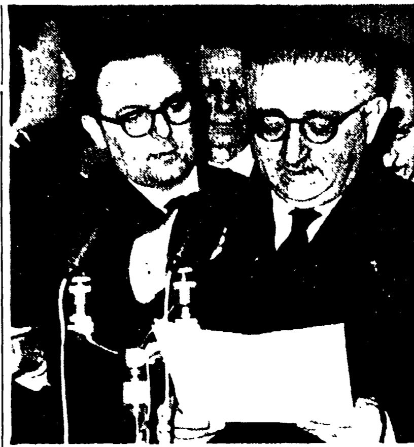
On. Leone fa le sue dichiarazioni alla stampa dopo il colloquio con il capo dello Stato