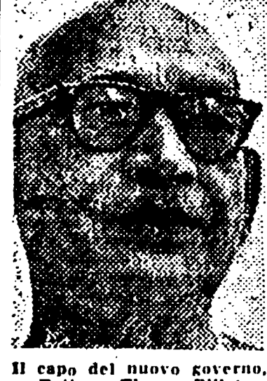
Il capo del nuovo governo, Pattom Thannu Pillai

Il Kerala ha da qualche giorno il suo nuovo governo, espressione della coalizione anticommunistica che, con le elezioni del 1. febbraio, ha preso il potere nello Stato.