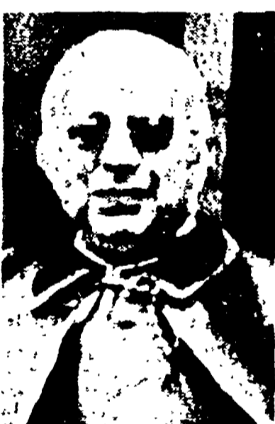
Il cardinale Marella, di cui molti parlano come del possibile successore di Tardini

Un freddo commento dell'« Osservatore » - A chi si rivolgeva il segretario di Stato quando ha parlato di « altri » che dovrebbero seguire il suo esempio?