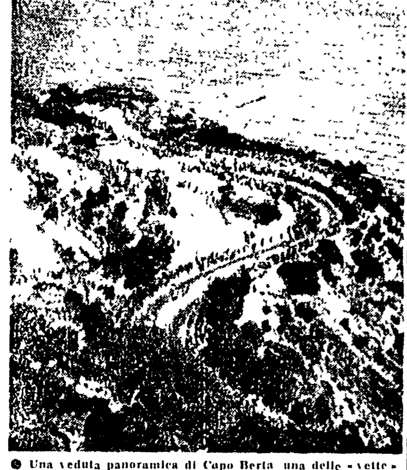
Una veduta panoramica di Capo Berta una delle "vette" della Milano-Sanremo

Basta aver coraggio: l'esempio di Pambianco nella Milano-Torino è vivo e palpitante - Dalla cima del Poggio al traguardo la strada è breve: e sarà difficile acchiappare un eventuale fuggitivo - Il percorso allungato di pochi km.