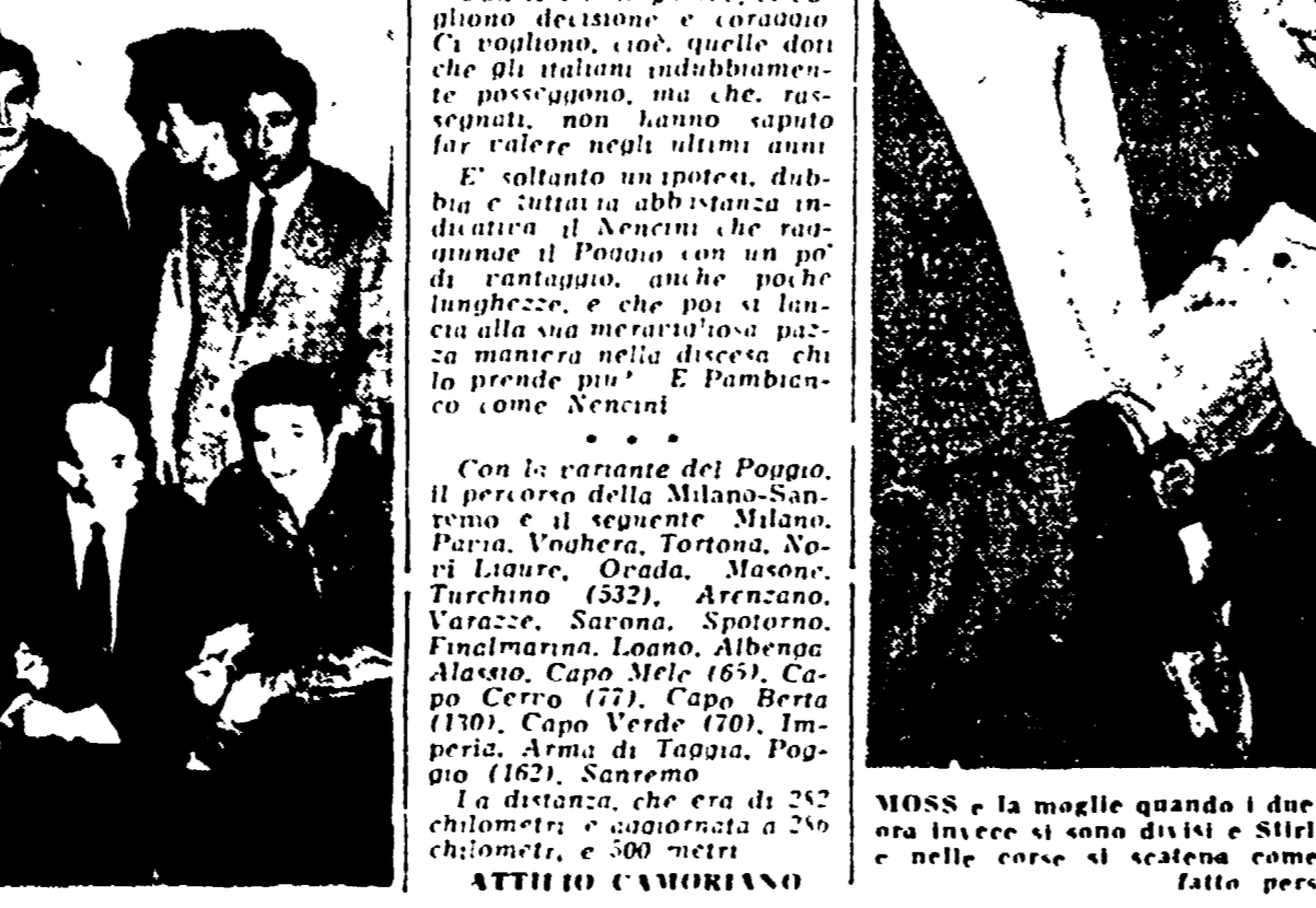
Per l'incontro di domani con la Spagna