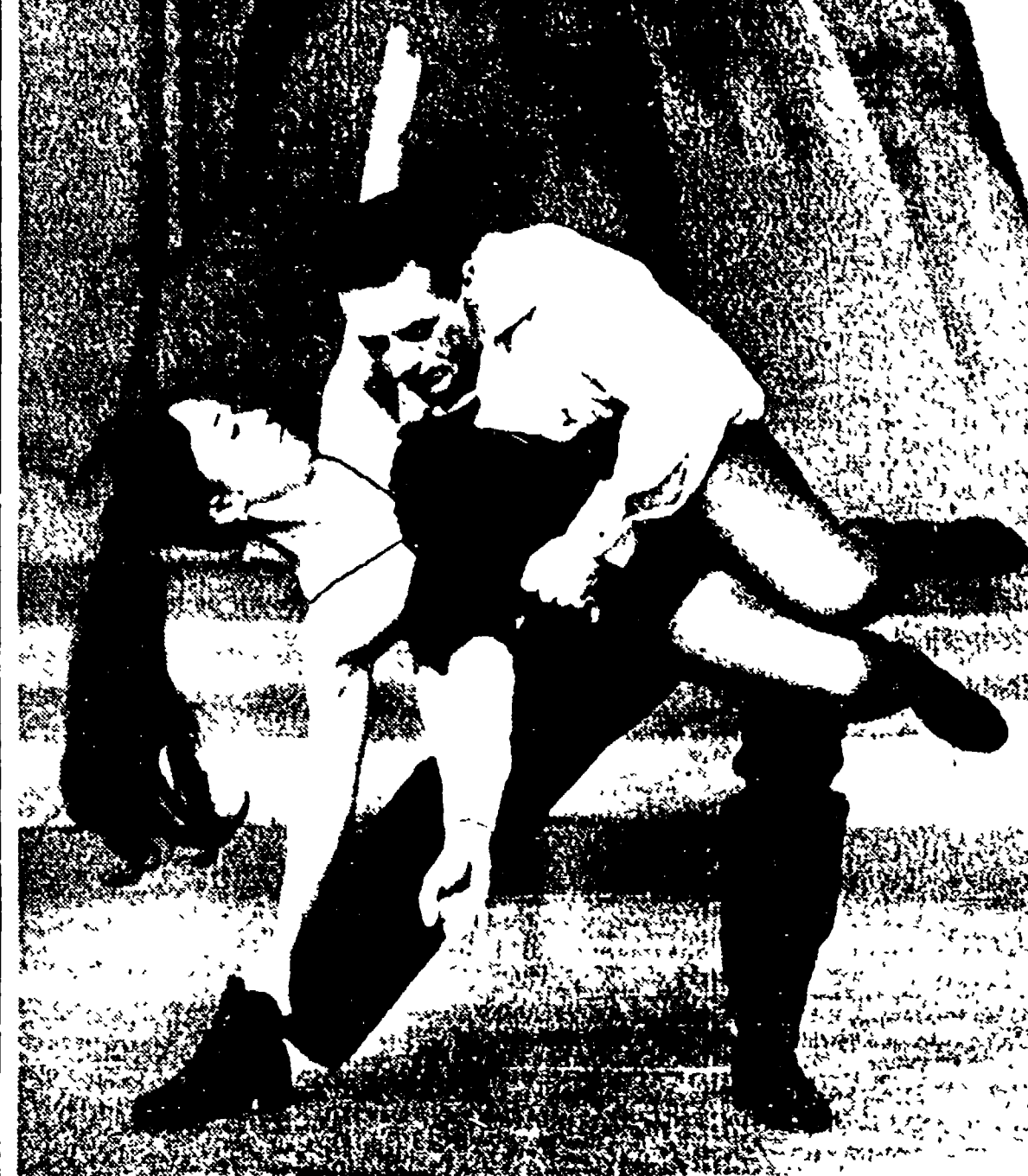
Una nuova commedia musicale andata in scena al Palace Theatre di Londra...