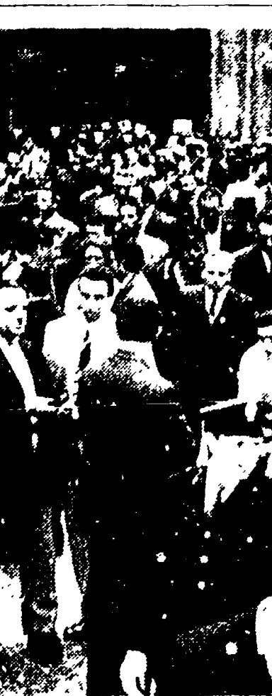
I postelegrafonici romani escono dal cinema Altieri dove ieri mattina si è svolto un affollato comizio nel corso del quale ha parlato il segretario responsabile della FIP, on. Fabbri