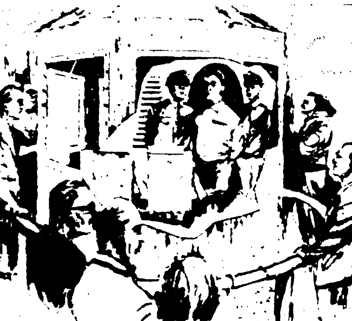
SAN QUENTINO - Così uno dei sessanta testimoni oculari della uccisione di Chessman ha ricostruito la fine del bandito-scrittore, chiusa nella camera a gas mentre i presenti spiano gli ultimi istanti attraverso i grandi vetri.

Il vecchio vulcano sta per risvegliarsi?