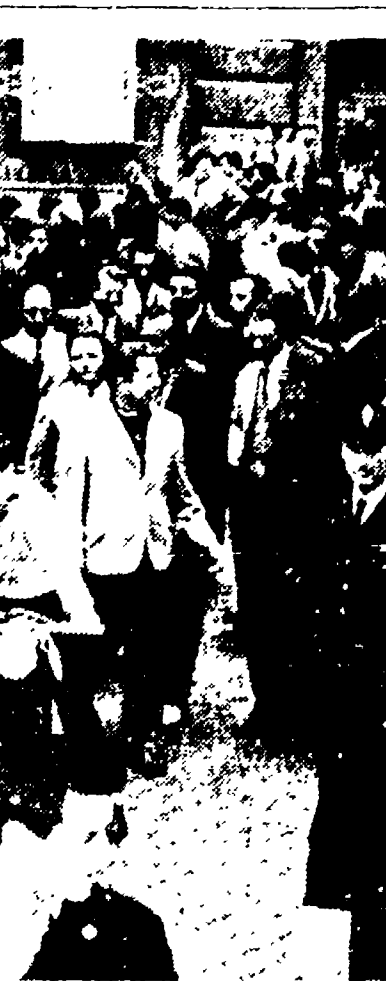
I postelegrafonici romani escono dal cinema Altieri dove ieri mattina si è svolto un affollato comizio nel corso del quale ha parlato il segretario responsabile della FIP, on. Fabbri