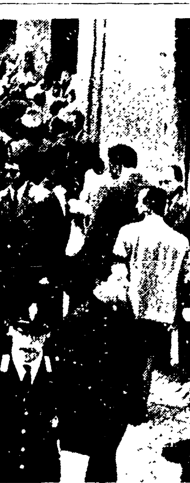
I postelegrafonici romani escono dal cinema Altieri dove ieri mattina si è svolto un affollato comizio nel corso del quale ha parlato il segretario responsabile della FIP, on. Fabbri