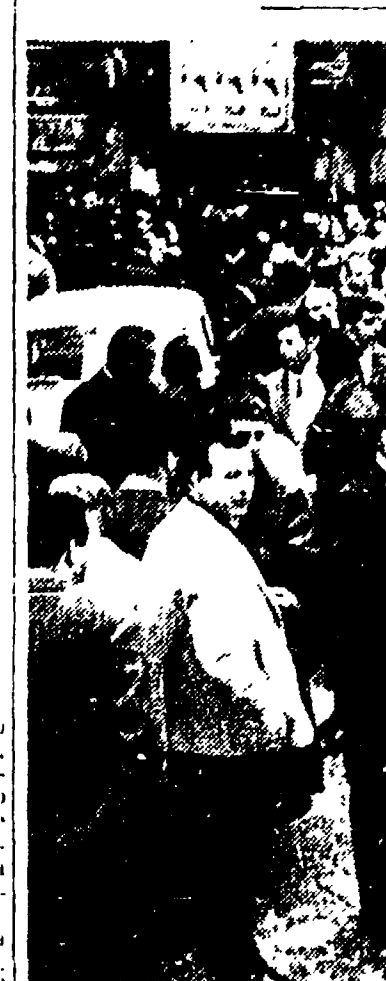
I postelegrafonici romani escono dal cinema Altieri dove ieri mattina si è svolto un affollato comizio nel corso del quale ha parlato il segretario responsabile della FIP, on. Fabbri