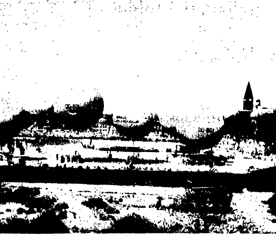
ROTTERDAM — In occasione dei festeggiamenti per il 15. anniversario della Liberazione olandese ha avuto luogo una gara internazionale di aereoplano di precisione per palloni frenati. Obiettivo quello di atterrare in un punto prestabilito con la massima precisione possibile. Su uno dei palloni della squadra americana era salita l'attrice Joan Fontaine

Nella ricorrenza della storica data del 9 maggio