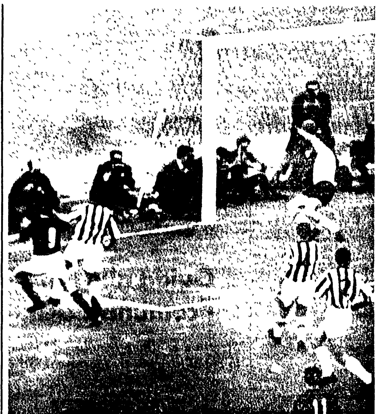
LA DOMENICA SPORTIVA Battendo la Spal la Fiorentina ha rovesciato un punto alla Juve fermata a Roma...