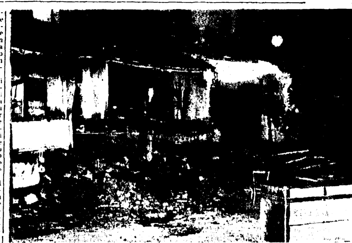
Una delle baracche distrutte dal crollo del muraglione

Investita dai calcinacci, una madre che stava allattando il suo bambino è riuscita a dare l'allarme - La pioggia e i lavori di sterro hanno provocato la frana