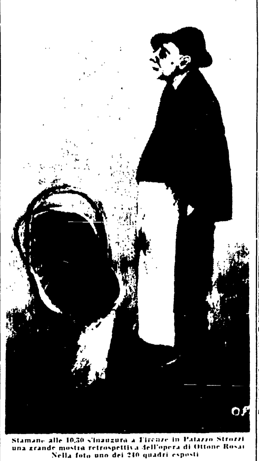
Stamane alle 10,30 s'inaugura a Firenze in Palazzo Strozzi una grande mostra retrospettiva dell'opera di Ottone Rosai...