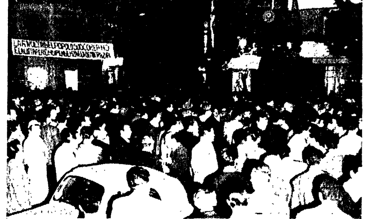
Migliaia di cittadini hanno partecipato in piazza della Marranella al comizio indetto dai circoli della Federazione comunista di Terracini e Marcellinara e dall'Alleanza giovanile romana con gli eroi del popolo della Corea del sud e della Turchia insorti per la libertà dei loro paesi. Correli di giovani con bandiere e cartelli inneggiavano alla pace e all'indipendenza dei popoli oppressi dall'imperialismo.

La stampa si è sempre molto occupata dei problemi della Centrale del latte. In questi ultimi tempi la lotta dei lavoratori ha riportato nuovamente in primo piano i problemi della costruzione della nuova Centrale e quelli dell'assorbimento dei servizi di raccolta e distribuzione del latte ancora affidati al Consorzio e alla COTAL, vorremmo sapere da lei, quali sono, i motivi specifici che rendono necessario, che il settore del latte alimentare sia gestito da una azienda municipalizzata, anziché essere in parte affidato all'iniziativa privata.