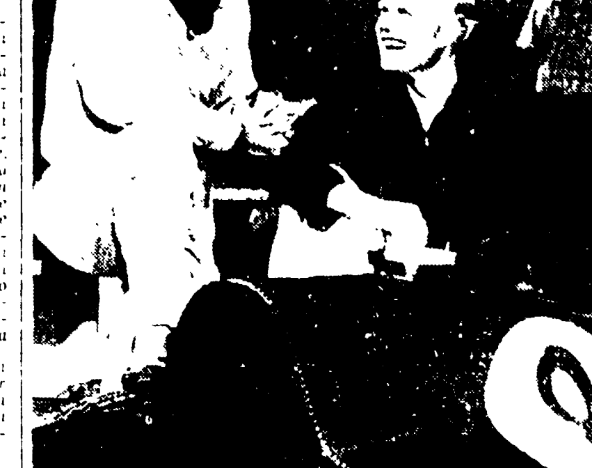
Il presidente della Juventus, Gianni Agnelli, con i dirigenti della squadra...