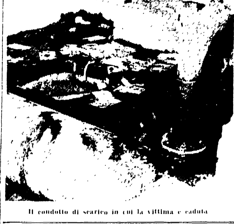
Il condotto di scarico in cui la vittima è caduta