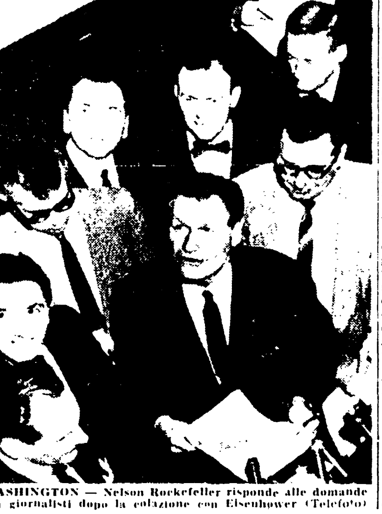
WASHINGTON. 9. — Nelson Rockefeller risponde alle domande dei giornalisti dopo la colazione con Eisenhower (Telefoto).

Washington. 9. — Nelson Rockefeller risponde alle domande dei giornalisti dopo la colazione con Eisenhower (Telefoto).