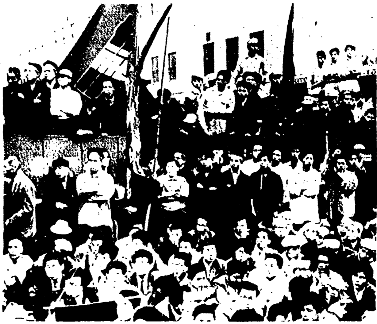
TOKIO — Di fronte al rifiuto di Kishi di dimettersi e di abrogare il patto di guerra nippo-americano e quella di Eisenhower di rinviare la sua visita, la centrale sindacale Solbio ha deciso di proclamare per il 15 giugno un nuovo sciopero generale. Nella foto in alto, i ferrovieri festeggiano la grandiosa riuscita dello sciopero del 4 giugno; in basso i lavoratori delle poste centrali della capitale, decidono di aderire allo sciopero