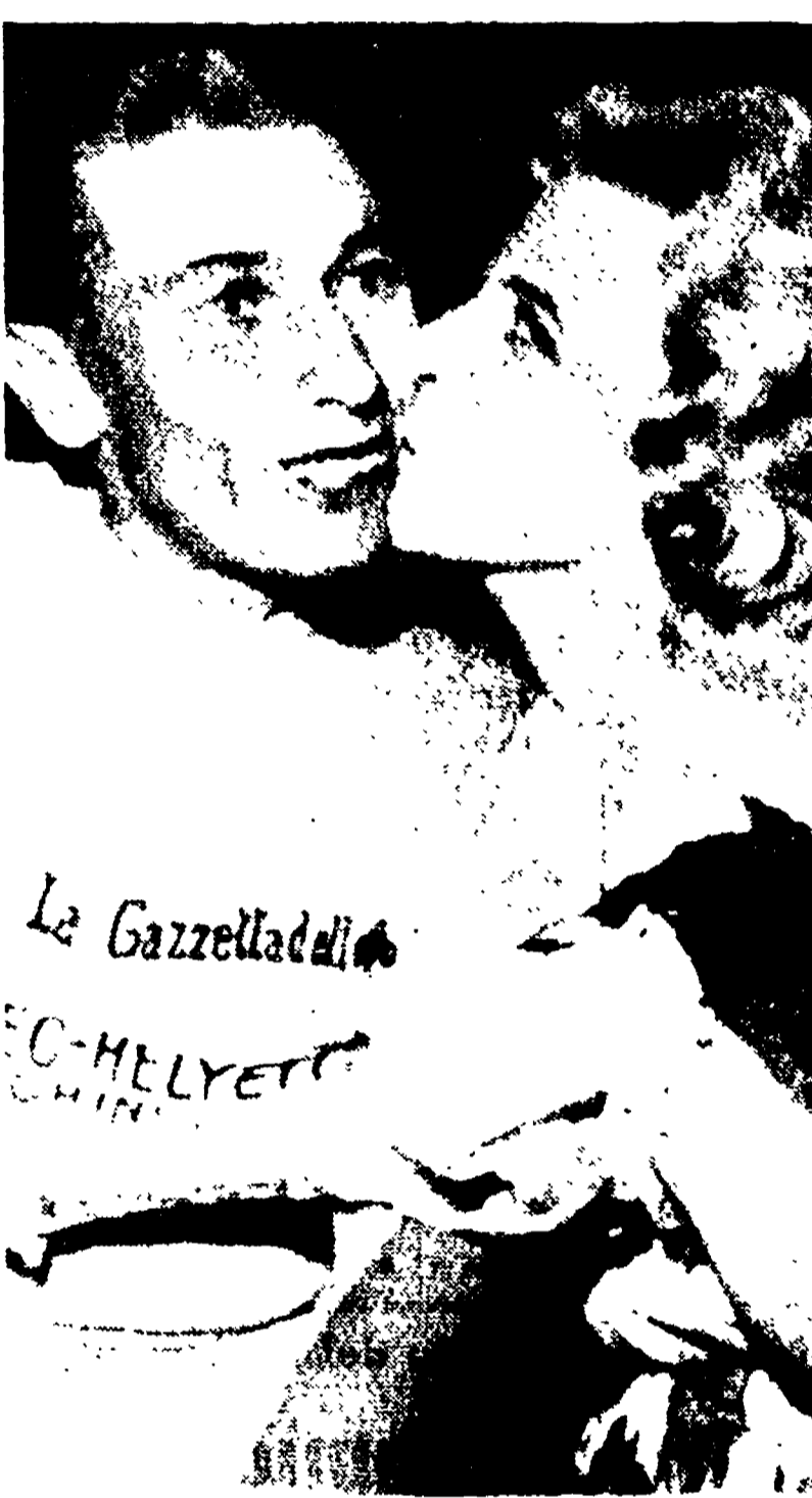
Le Gazzelladi di Anquetil. In alto: il campione francese. Sotto: il suo rivale Nencini.

MILANO. - E così è accaduto per la prima volta nella storia della gara che un atleta di razza ha firmato il libro d'oro del Giro. Jacques Anquetil, l'abbiamo detto, è un ripetuto e quasi insuperabile. E' un campione che non sorprende mai. Conferma il nostro pronostico della vittoria di Jacques Anquetil o Gaul.