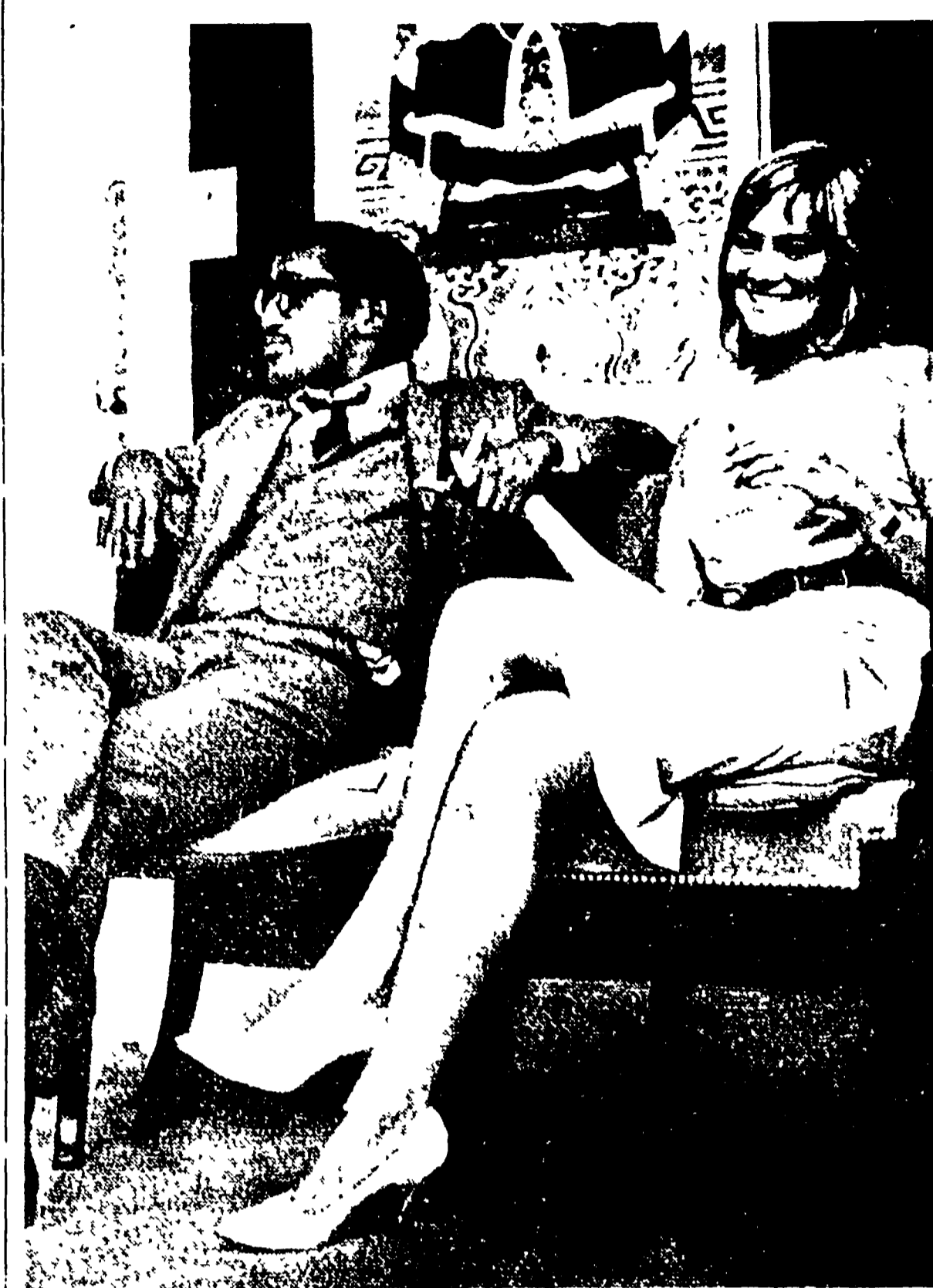
HOLLYWOOD - Un funzionario della 20th Century Fox ha annunciato che il contratto con l'attrice svedese Greta Garbo non verrà rinnovato alla scadenza prevista...