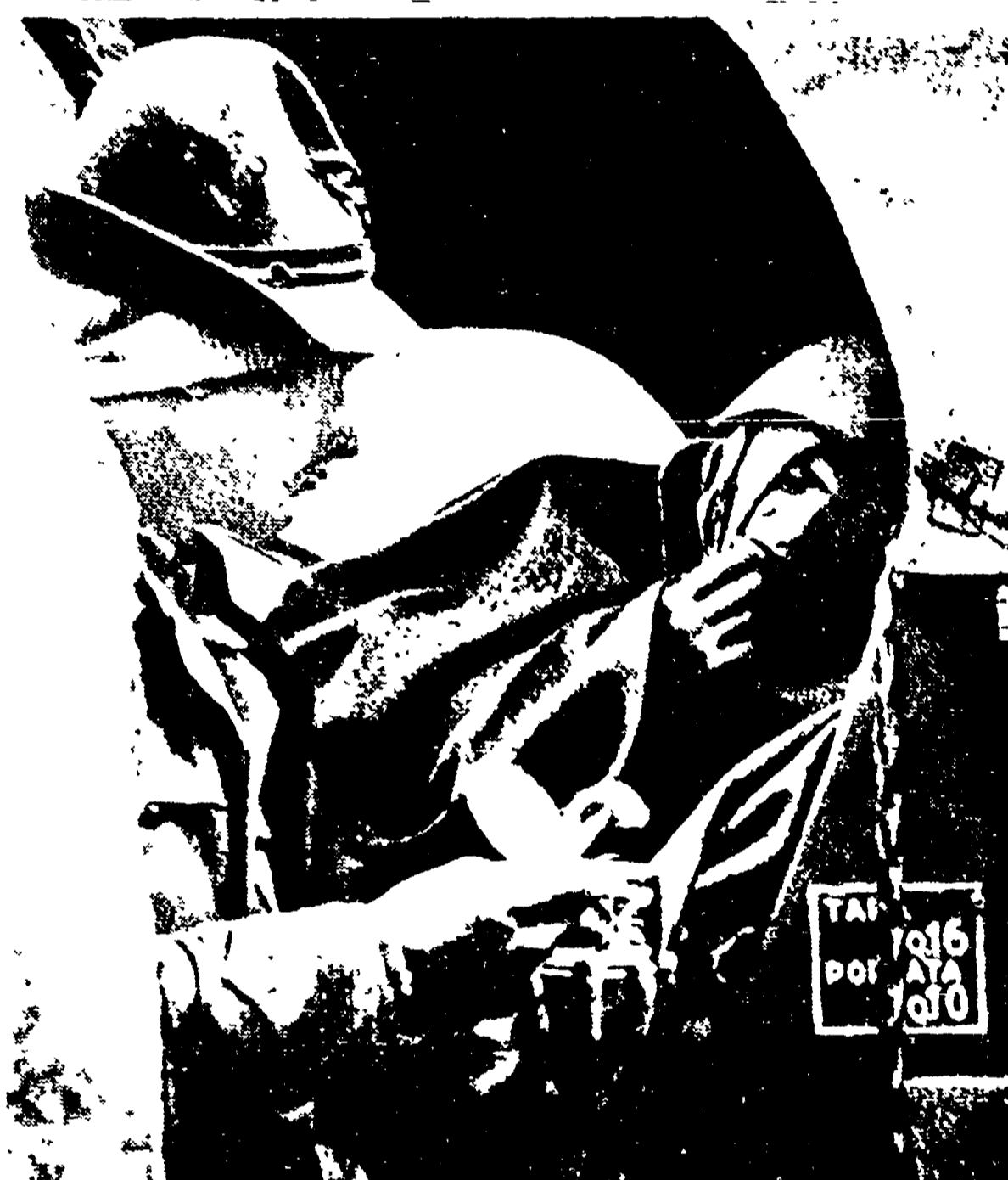
1940 su una tradotta al fronte occidentale

Il "comando supremo" di Mussolini, a quel punto, ha detto: "Sì, ma con un patto".