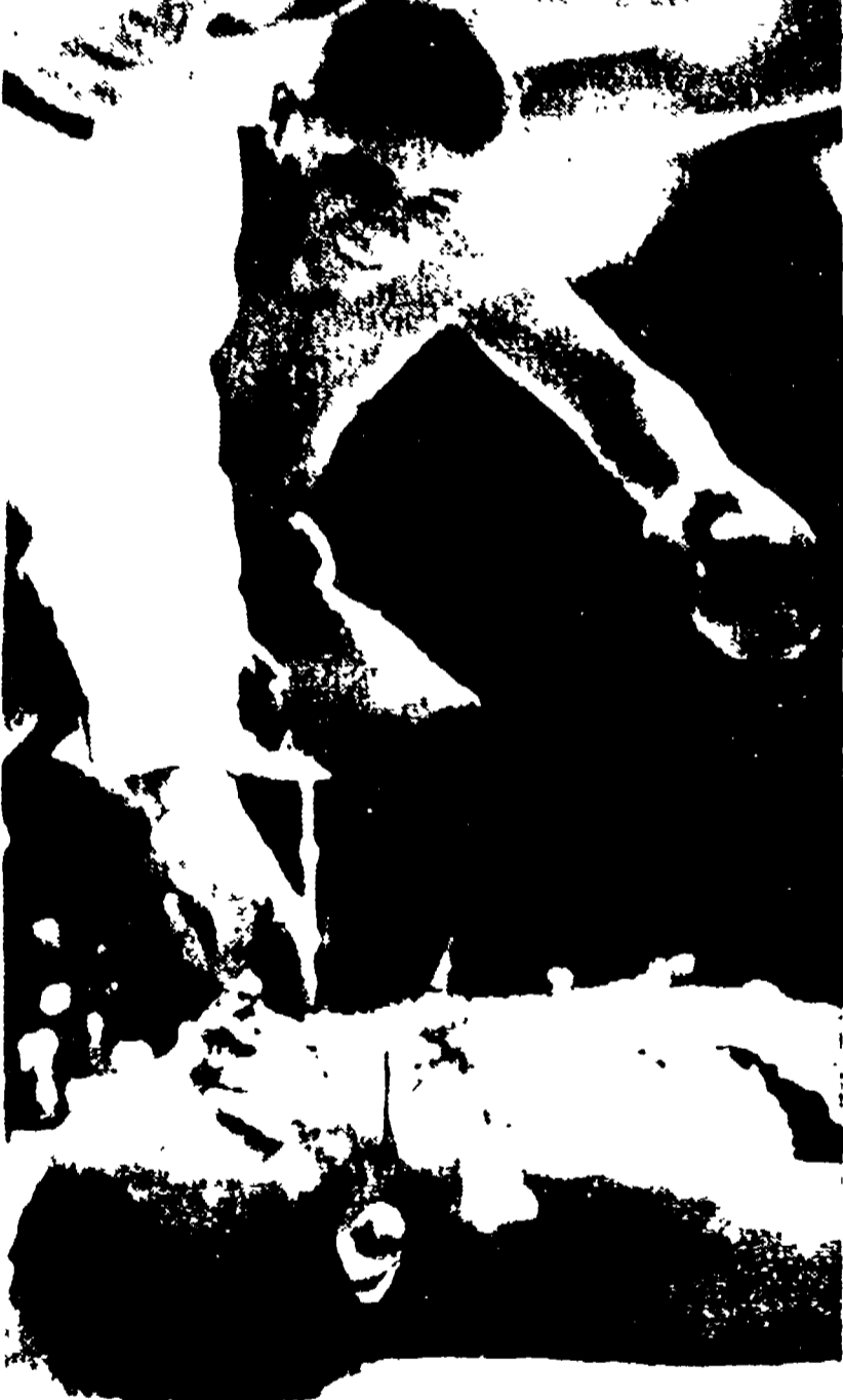
PATTERSON assalta JOHANSSON stesso al tappeto. Sul volto del «reuccio» di Alifan si legge la gioia per la vittoria conquistata.

NEW YORK, 21. - Nella rivincita al Polo Ground, Emersi ha sconfitto Patterson in un combattimento che ha mostrato i grandi limiti di «Ingo» Patterson. Emersi ha vinto per KO al primo round.