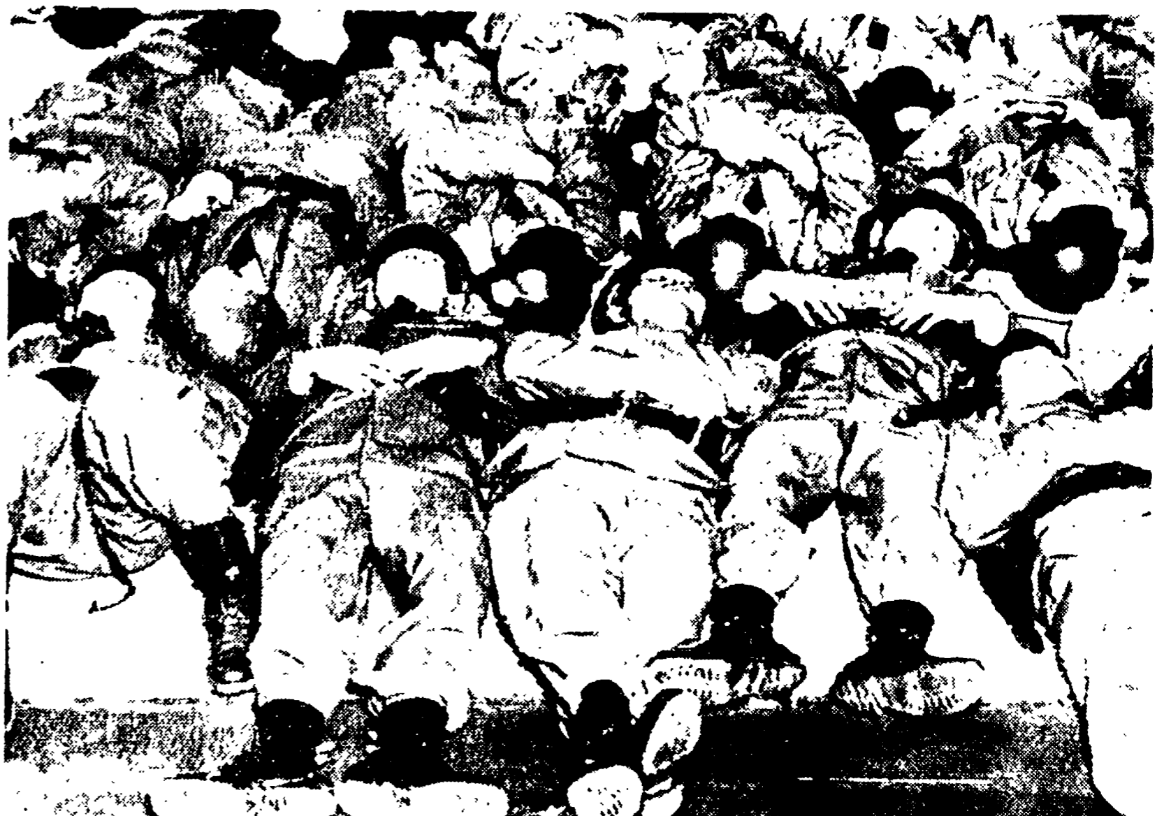
TOKIO — Un plotone di poliziotti giapponesi sdraiati in terra, all'interno della residenza del premier Kishi, mentre dormono, esausti dopo le battaglie dei giorni scorsi. I poliziotti sono in pieno assetto di guerra, con elmetti in testa e pistole alla mano.