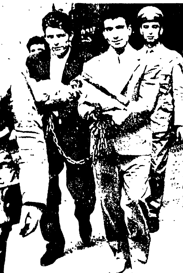
NAPOLI - Due dei marittimi imputati nei fatti di Torre del Greco vengono condotti in carcere nell'aula del tribunale