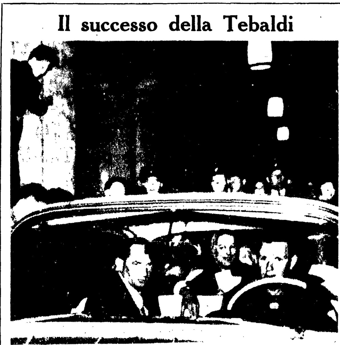
VIENNA - Renata Tebaldi ha riportato l'altra sera un successo trionfale interpretando la «Tosca» di Giacomo Puccini al Teatro dell'Opera di Stato della capitale austriaca.