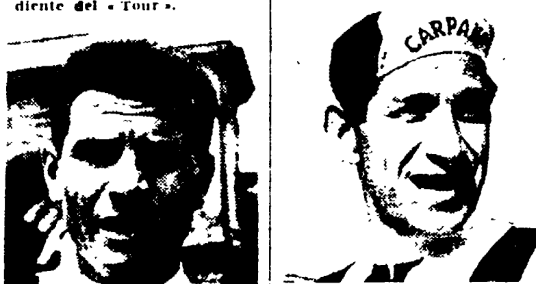
GRAZIANO BATTISTINI è nato il 12 maggio 1936. Passista e scalatore. Esordiente del Tour.