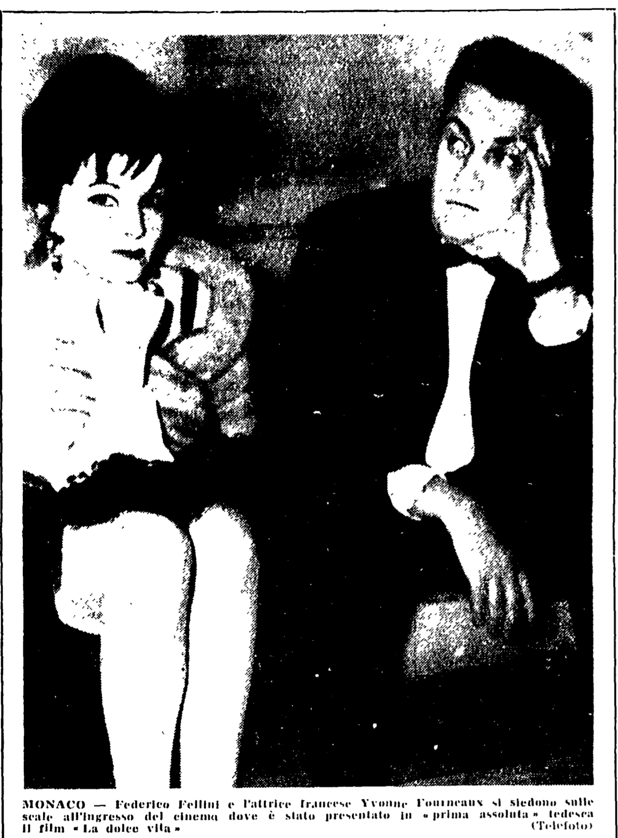
MONACO - Federico Fellini e l'attrice francese Yvonne Fontanaux si siedono sulle scalate all'ingresso del cinema dove è stato presentato in "prima assoluta" televisiva il film "La dolce vita".