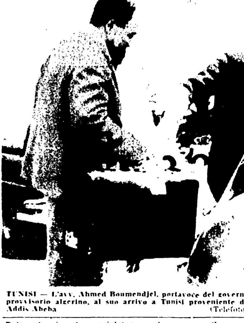
TENISI - L'avi. Ahmed Boumendjel, portavoce del governo provvisorio algerino, al suo arrivo a Tunisi proveniente da Addis Abeba