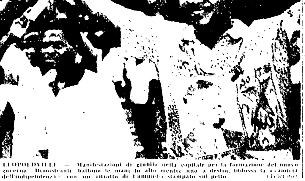
L'OPOLDIVILLE, 23. — Manifestazioni di giubilo nella capitale per la formazione del nuovo governo. In alto: Lumumba con il presidente. In basso: un ritratto di Lumumba stampato sul petto.

Anche il partito Abako di Kasavubu ha garantito il suo appoggio