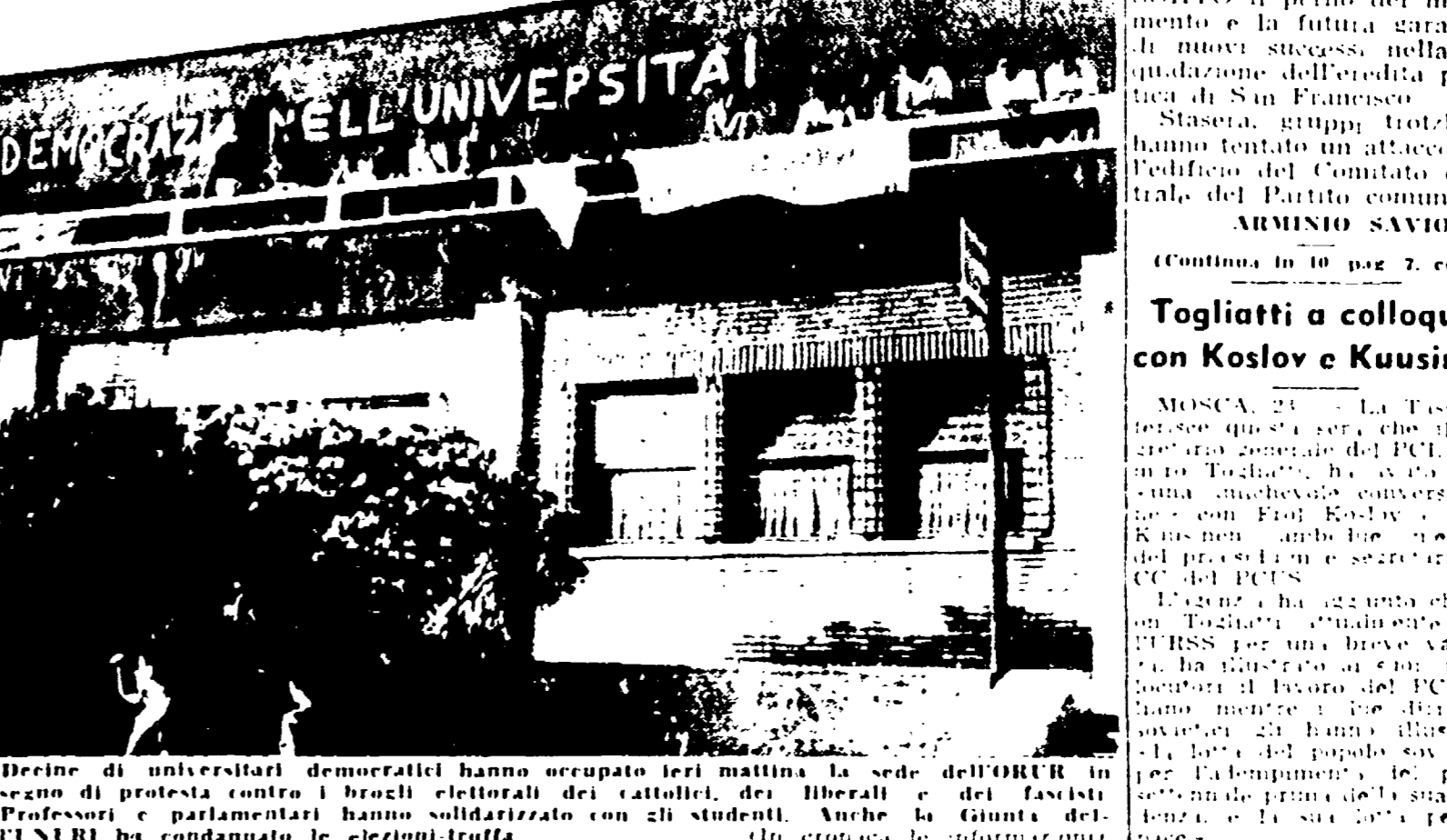
Deine di universitari democratici hanno occupato ieri mattina la sede dell'ORUR in segno di protesta contro i brogli elettorali dei cattolici, dei liberali e dei fascisti. Professori e parlamentari hanno solidarizzato con gli studenti. Anche la Giunta dell'ANPI ha condannato le elezioni-truffa.