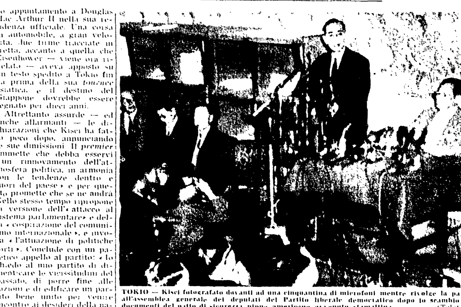
TOKIO - Kishi fotografato davanti ad una cinquantina di microfoni mentre rivolge la parola all'assemblea generale dei deputati del Partito liberato democratico dopo lo scambio dei documenti del patto di sicurezza nippono-americano stipulato.

TOKIO, 23. - Fattivamente, con una procedura che non ha precedenti nella storia della diplomazia, il ministro degli esteri Fugiyama e l'ambasciatore americano si sono scambiati stamane gli strumenti di ratifica del «patto di sicurezza». L'intera cerimonia — firmata, scambiata di dichiarazioni, un ritmo che si è fatto farsesco, la cortea fumogena di false indicazioni fornite alla stampa e al pubblico; Fugiyama ha evitato il suo ministero, bloccato in quello stesso istante da decine di migliaia di dimostranti, dan-