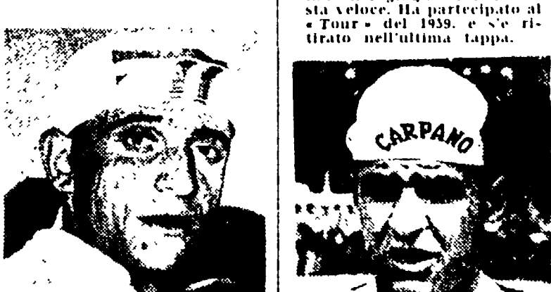
ERCOLE BALDINI è nato il 26 gennaio 1932. Passista veloce e fondista. Ha partecipato al Tour del 1957 e del 1958. Vittima di una caduta a Ronchi, tre anni fa è stato costretto ad abbandonare.