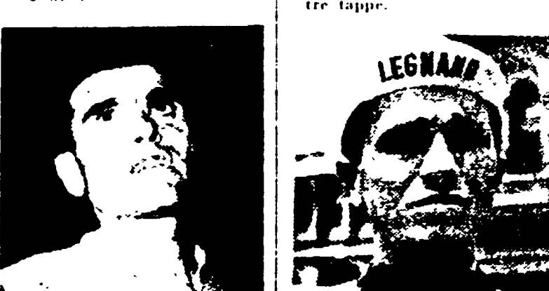
GASTONE NENCINI è nato il 1 marzo 1931. Fondista completo. Ha partecipato al Tour del 1956, del 1957 e del 1958 dove si è classificato al quinto posto nel complesso. Ha vinto tre tappe.