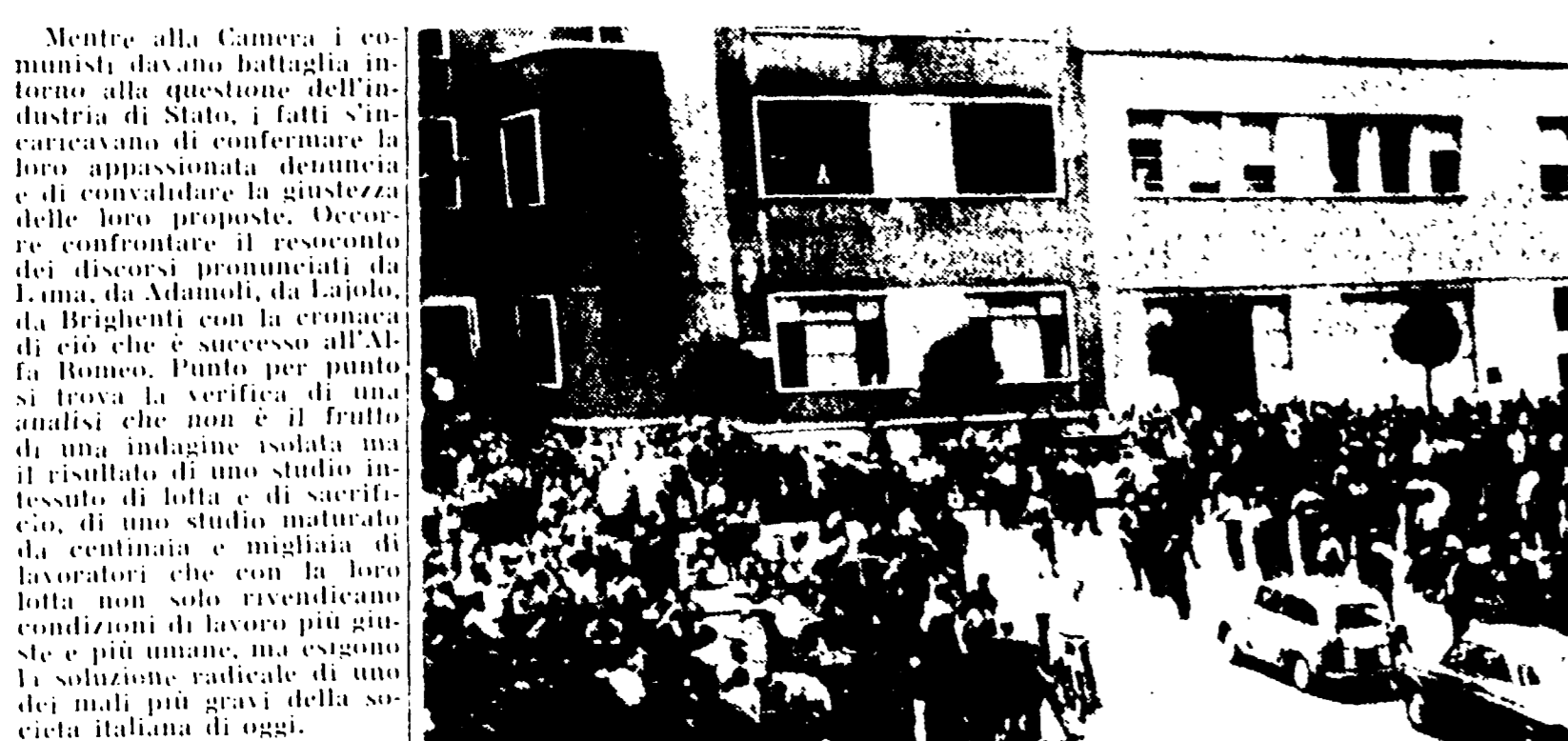
MILANO - A mezzogiorno di ieri gli 8.000 operai dell'Alfa Romeo hanno abbandonato il lavoro dando vita ad un possente sciopero contro il patto separato firmato dalla CISL e dalla UIL. Nella foto: il corteo dello stabilimento mentre gli operai escono dai reparti