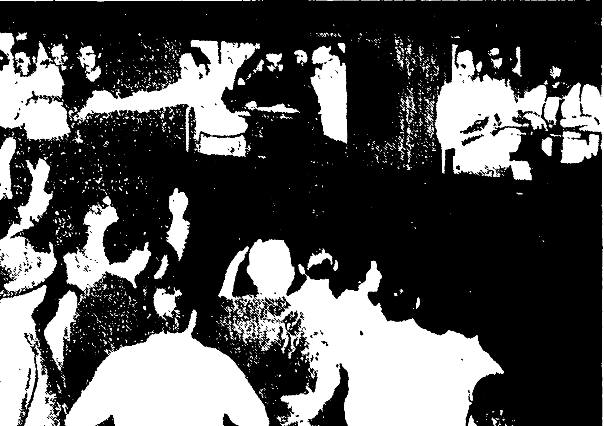
Partendo dalla stazione di Milano i ciclisti azzurri rispondono al saluto della folla (dettaglio di sinistra)

PARIGI, 23. - Il Tour è cominciato con una formula che, a lungo del tempo, ha escluso ogni tipo di trattative botteghe. Si tratta della formula per cui, da oggi, i corridori sono considerati come atleti, e non come mercanti. Questa formula, che è stata imposta dal dottor Dumas, è stata accolta con entusiasmo dai corridori, ma non dai patron delle ditte extra.