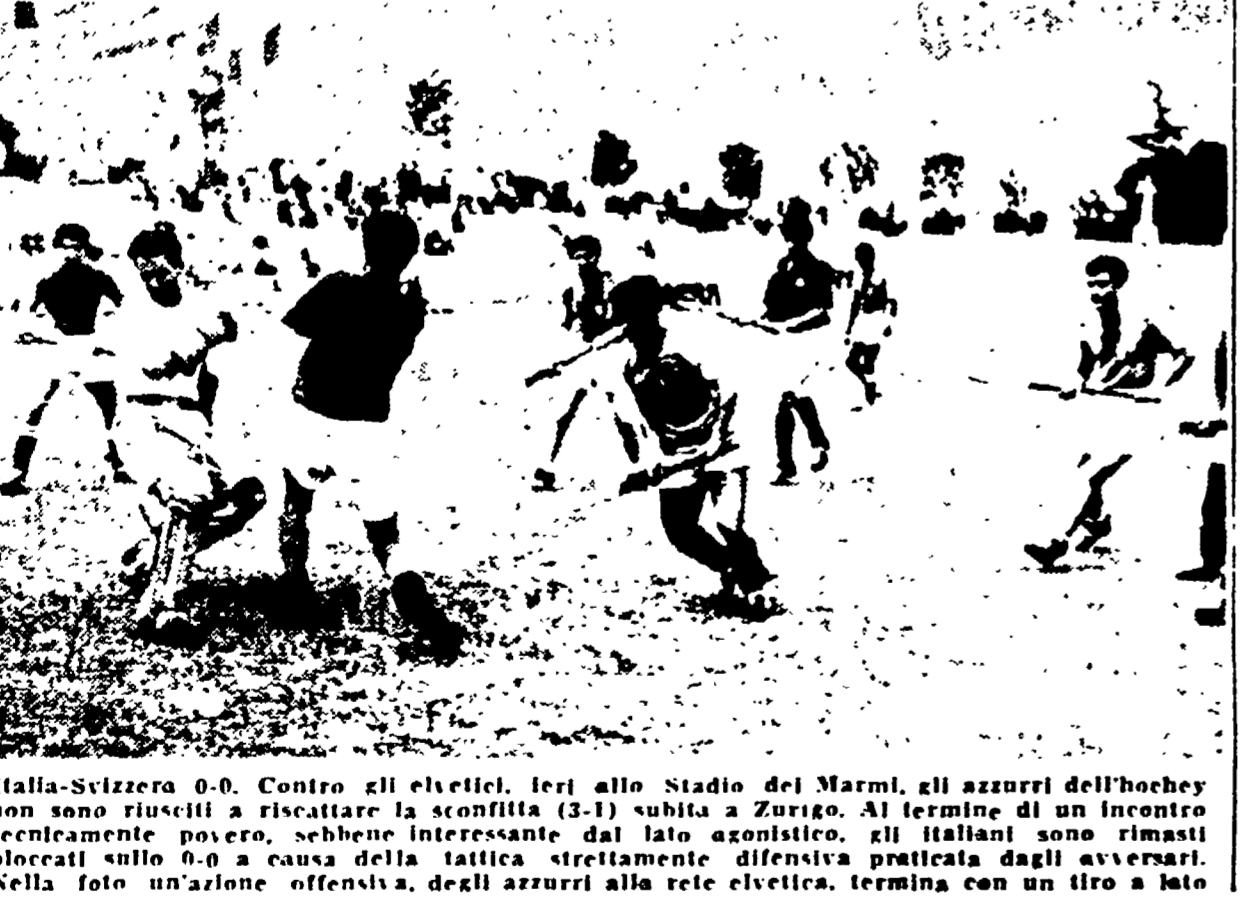
Italia-Svizzera 0-0. Contro gli elvetici, ieri allo stadio del Marmi, gli azzurri dell'hockey non sono riusciti a riscattare la sconfitta (3-1) subita a Zurigo...