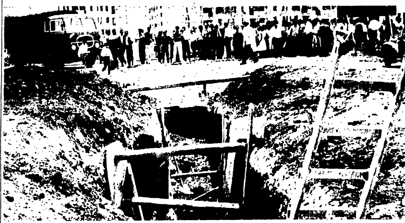
Il teatro della impressionante selagura sul lavoro a S. Basilio

Uno è morto prima di raggiungere l'ospedale, l'altro è stato salvato dai vigili del fuoco — Le pareti dello scavo, profondo tre metri, non erano state completamente armate dalla impresa appaltatrice — Un'inchiesta aperta dall'Autorità giudiziaria