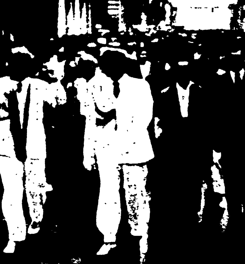
GENOVA — Un aspetto del corteo antifascista per la via della città (Telefoto)

presenta un fatto saliente, onde portare avanti, nel nome del sacrificio dei caduti per la libertà, la bandiera dell'antifascismo e della democrazia ». Successivamente, terminati i lavori, i presenti, preceduti dal gonfalone decorato di medaglia d'oro del Comitato di Parma, hanno for-