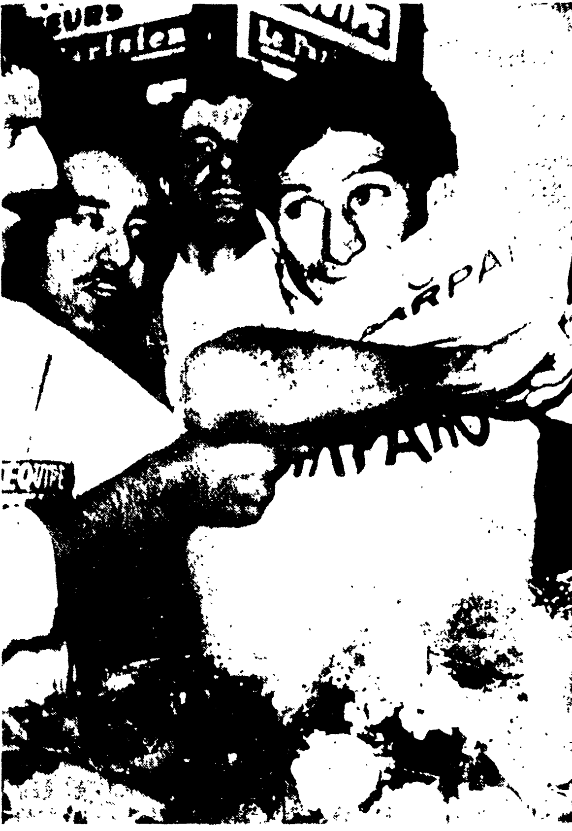
Al Tour - Gastone Nencini ha conquistato la maglia gialla dopo la corsa in linea da Lille a Bruxelles (vinta da Schepens) e la cronotappa intorno a Bruxelles (vinta da Riviere). Nella gara in linea Gastone è giunto con la pattuglia dei primi classificandosi terzo ed ha guadagnato 219" a Riviere e con 20" su Baldini e 21" su Massignan. Nella telefoto Gastone mentre indossa la maglia gialla.