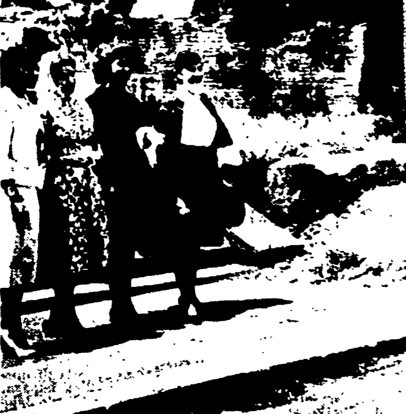
In attesa di prendere parte al ballo del «Grand Hotel», che il primo luglio segnerà la data del loro «ingresso in società», cinquanta diciottenni, ampie appartenenti alle migliori famiglie USA, passeggiano per Roma come «semplici turiste». Nella foto: figlie di miliardari in posa davanti al Colosseo