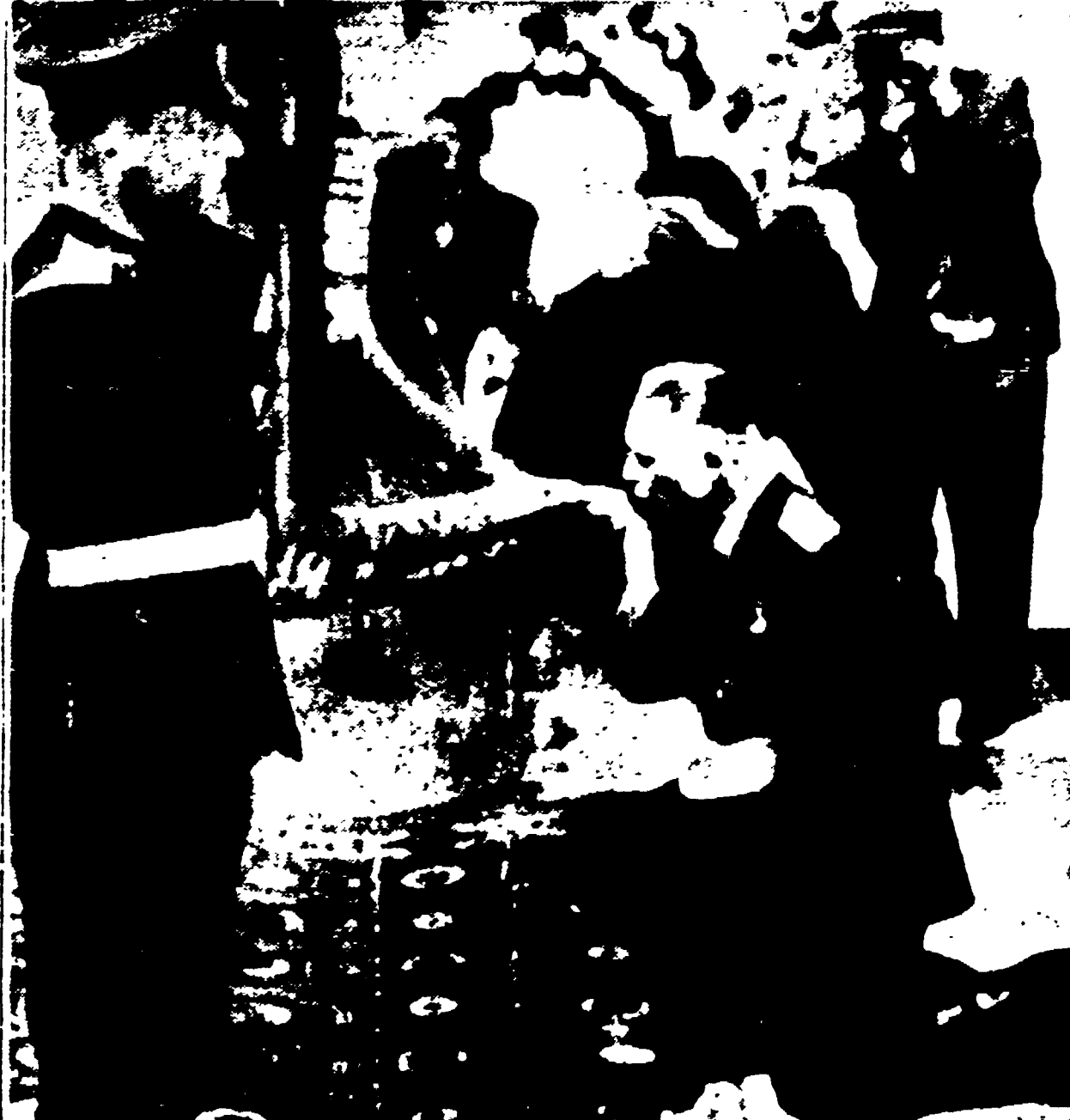
OSIPOVICI — Un aspetto della manifestazione svolta a Osipovici, nei pressi di Minsk, per lo scioglimento della V Divisione corazzata pesante. Un ufficiale, inginocchiato, bacia la bandiera che sarà consegnata al Museo dell'Esercito a Mosca

La cerimonia dello scioglimento della divisione che liberò Budapest seguita da cento giornalisti stranieri