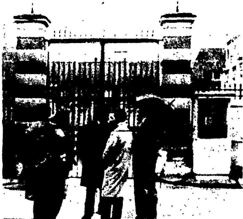
MELUN - I giornalisti all'esterno della prefettura, dove si svolgono i primi colloqui franco-algerini (Telefoto)

I muri della capitale ricoperti di scritte per la pace in Algeria - Proteste per il divieto delle manifestazioni - Alleg trasferito alla "Santé" - Segni di soddisfazione negli ambienti algerini per l'andamento delle trattative