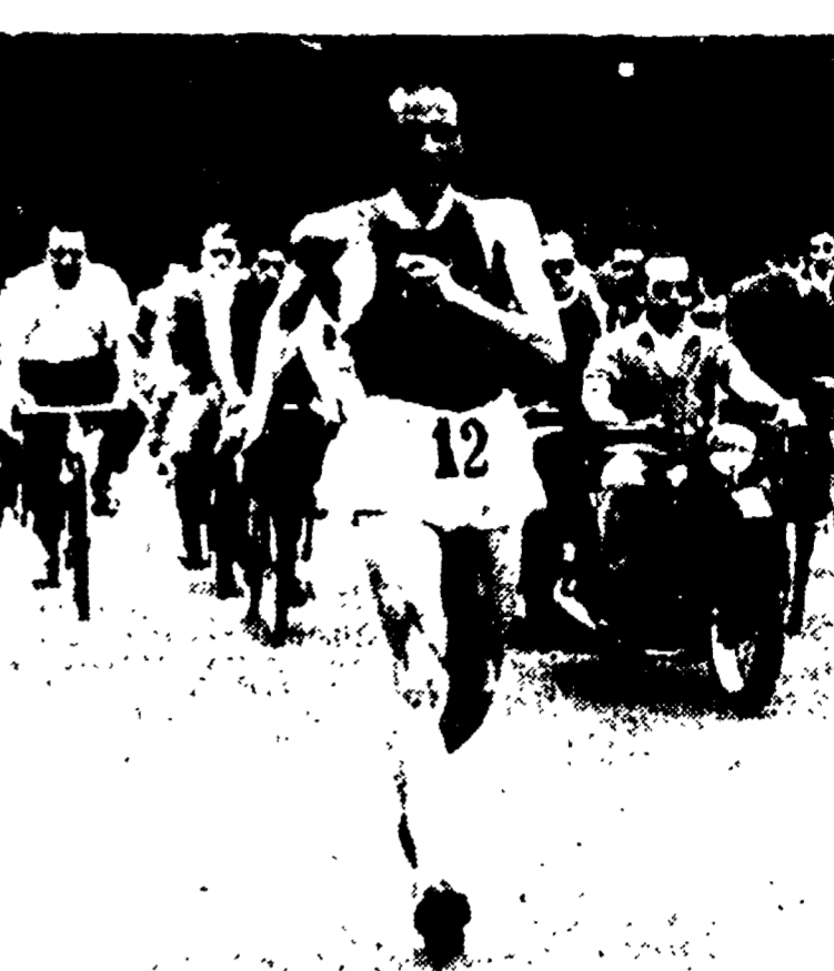
(Dal nostro corrispondente) BUSTO ARSIZIO, 26. - Con un superbo quanto perentorio «sprin» finale, l'olimpionico Pino Dordoni ha battuto il suo avversario, il rumeno Pamich...