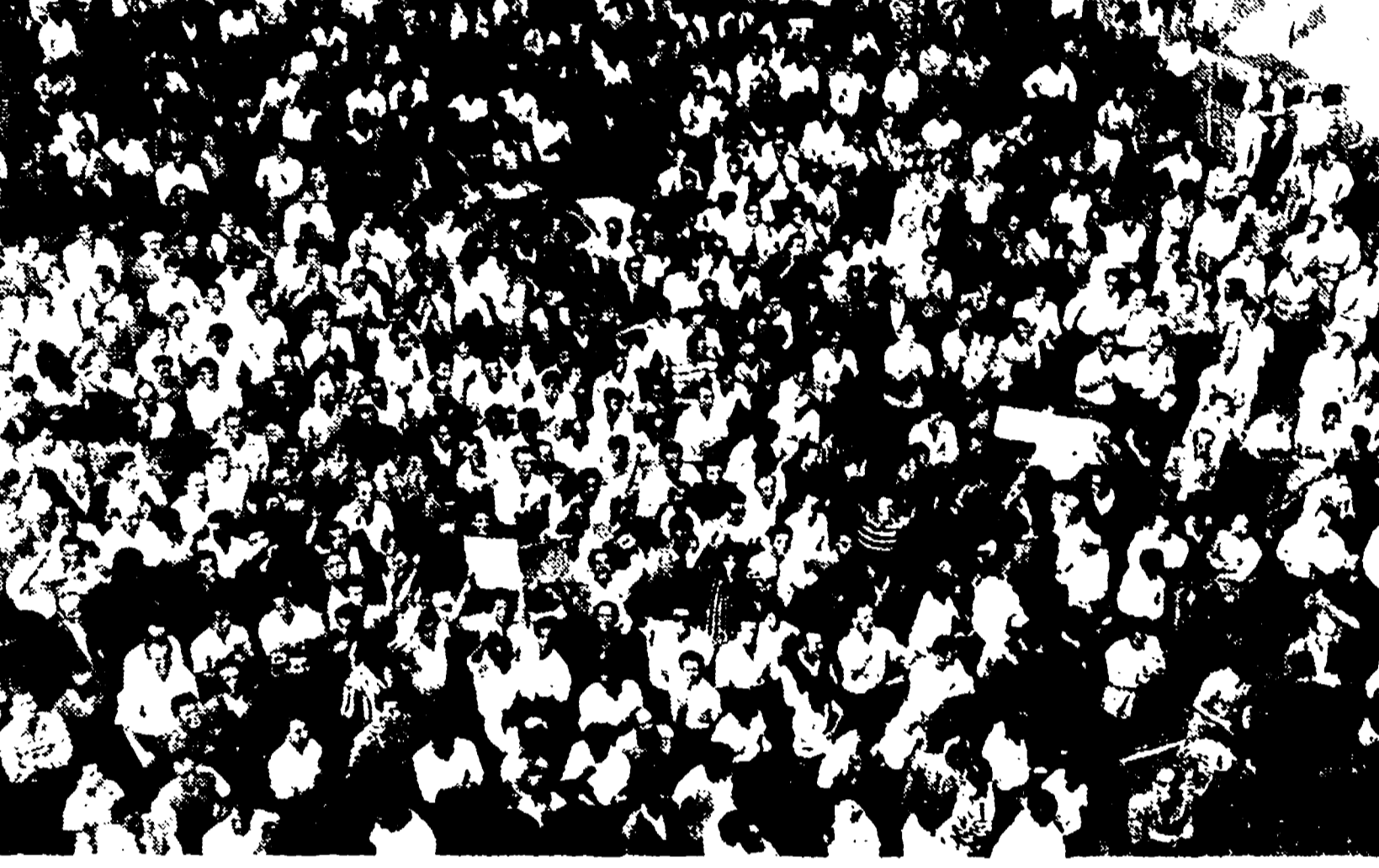
Migliaia di lavoratori romani sono scesi ieri in sciopero contro la provocazione del governo DC-MSI...