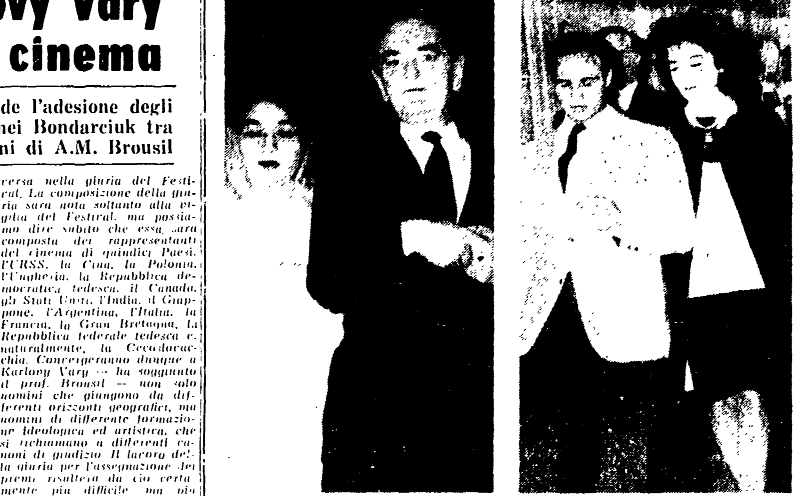
PARIGI - Il regista inglese David Lean ha sposato con rito civile una giovane indiana...