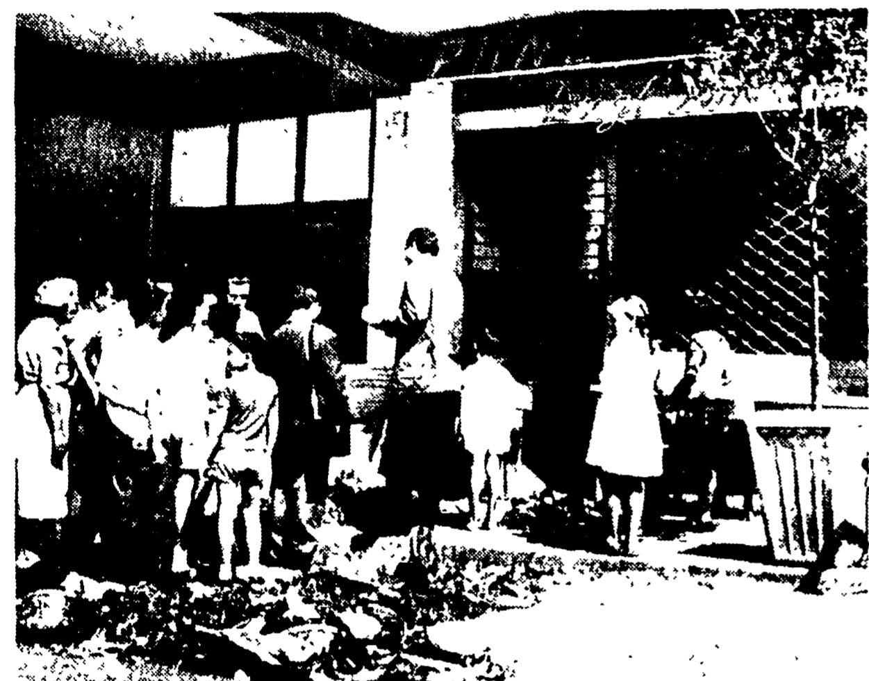
Il negozio fatto saltare in aria nel quartiere Montesecco di Roma

Il proprietario della drogheria, che si trovava in via Appia Antica 52, ha raccontato che ha sentito un rumore di esplosione e ha visto una luce bianca. Il rumore è stato sentito anche da chi si trovava in via Appia Antica 52, ma lì non c'era nessuno.