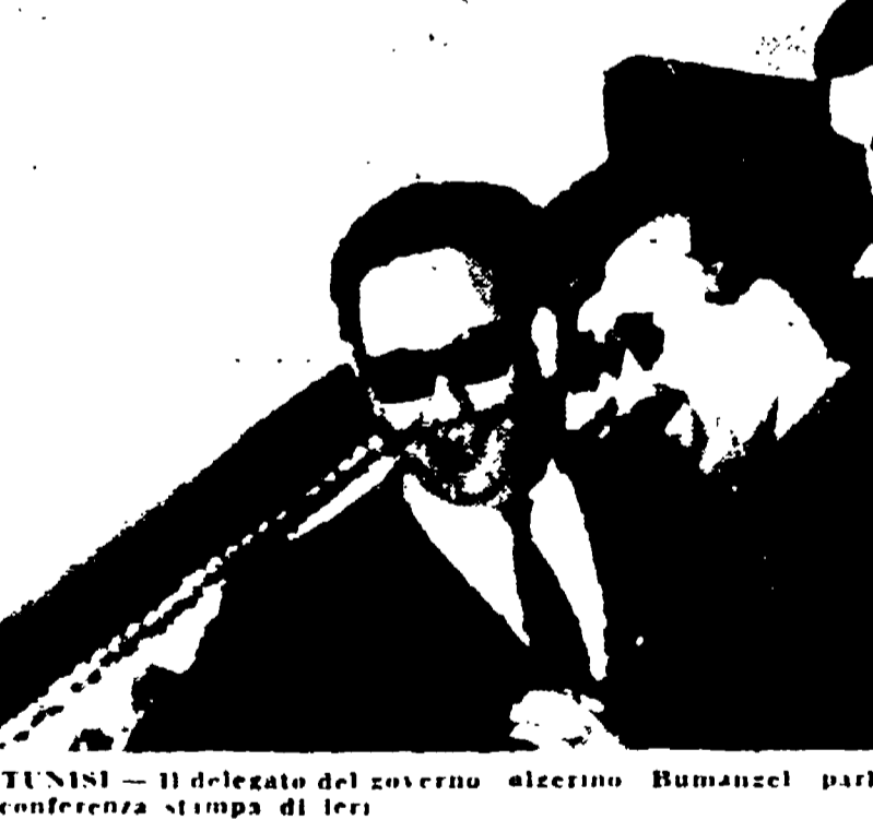
TUNISI - Il delegato del governo algerino Bumanzel parla con i giornalisti durante la conferenza stampa di ieri