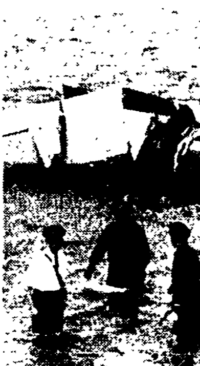
COPENAGHEN — Otto calatori della Nazionale danese sono morti in una scaramanzia aerea nel pressi dell'aeroporto di Copenaghen. L'aereo è precipitato in mare appena lasciato la pista. La foto mostra i resti dell'aereo mentre sono in corso le operazioni di recupero.

Arrivando all'aeroporto di Copenaghen Otto «nazionali» danesi muoiono su un aereo che cade in mare