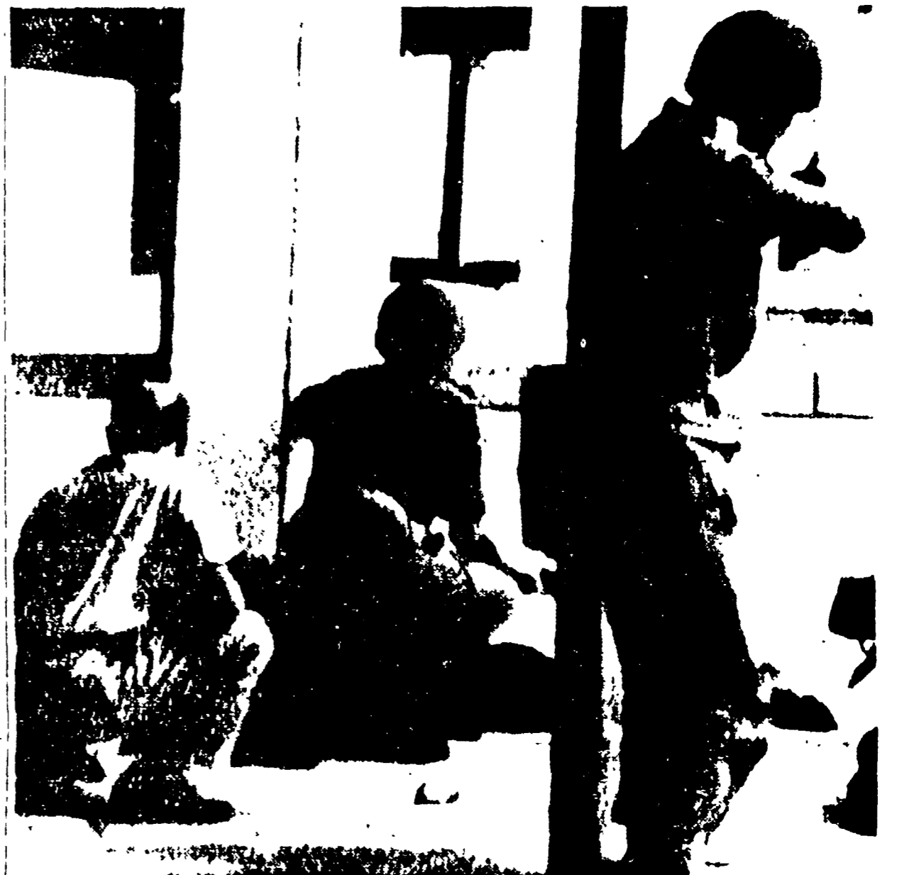
LEOPOLDVILLE — Paracadutisti belgi del corpo di aggressione in azione contro forze congolese. In loro anche un civile

Manovre per provocare la secessione anche del Kivu e del Kasai - La Libia vieta ai belgi il sorvolo del suo spazio aereo