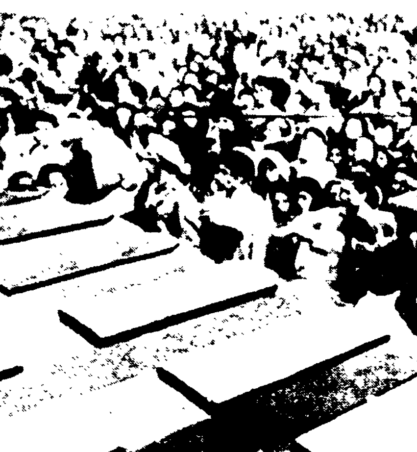
CITTA' DEL GUATEMALA — Una enorme folla di parenti e amici delle 200 vittime dello incendio del manicomio davanti alle bare allineate: in 51 bare sono stati racchiusi i resti di 151 persone. L'incendio del manicomio che ospitava 1100 persone sembra dovuto ad un corto circuito.