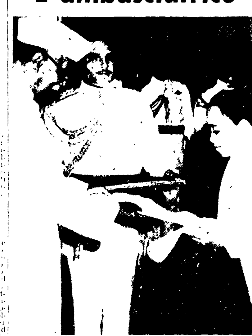
NUOVA DELHI — La signora Anur San, la prima donna ambasciatrice della Birmania, presenta le credenziali al presidente indiano Prasad. La signora Anur San è la vedova del defunto premier birmano Anur San. (Telefoto)

La lotta contumace dei mezzadri a questa rivendicazione si è unita l'altra dei mezzadri con il pagamento dei contributi unificati a favore degli industriali. Non si ha una loro contadina. Un primo servizio di fatto emerge e di grande importanza: la lotta dei mezzadri ha consentito non solo la categoria ma anche varie forze politiche che la necessità di arrivare rapidamente alla riforma della mezzadria. L'unità della PCI che ha presentato in Parlamento una legge per dare la terra ai mezzadri, si impegna come una misura indispensabile per lo sviluppo economico e sociale dell'agricoltura. I sindacati e continuano a chiedere l'attuazione per risolvere il problema sul piano dell'azione sindacale, annunciando varie iniziative sul terreno parlamentare e per quanto riguarda la riforma dei patti agrari, sia per una riforma strutturale nelle zone a mezzadria, sia per una riforma attuata sospensiva dal lavoro