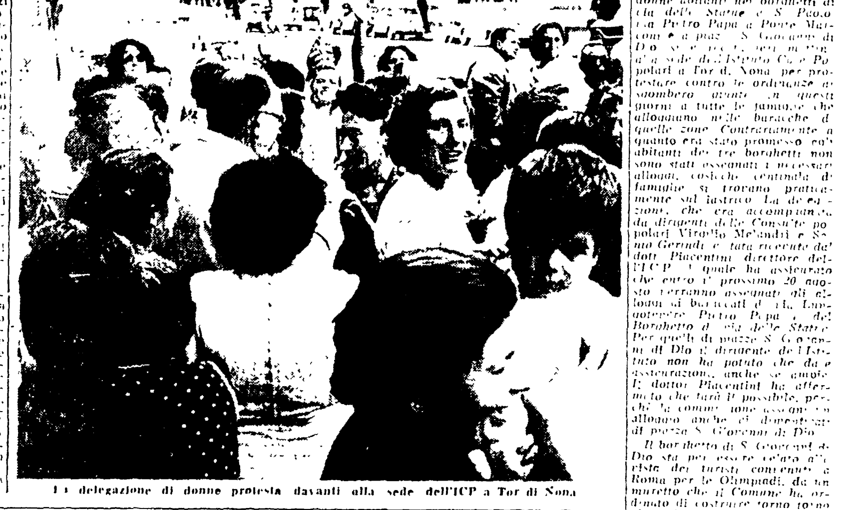
La delegazione di donne protesta davanti alla sede dell'ICP a Tor di Sona