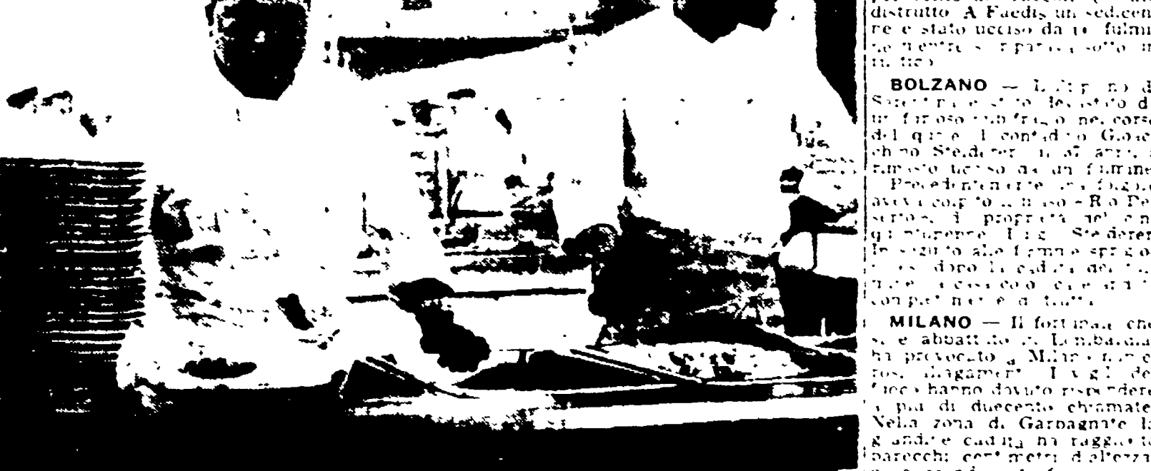
Il cuoco coreano Murakami fotografato nella cucina del Villaggio Olimpico mentre prepara i pasti per gli atleti del suo Paese

Due cavautori muoiono a Massa in un tunnel inondato - Due persone uccise dai fulmini