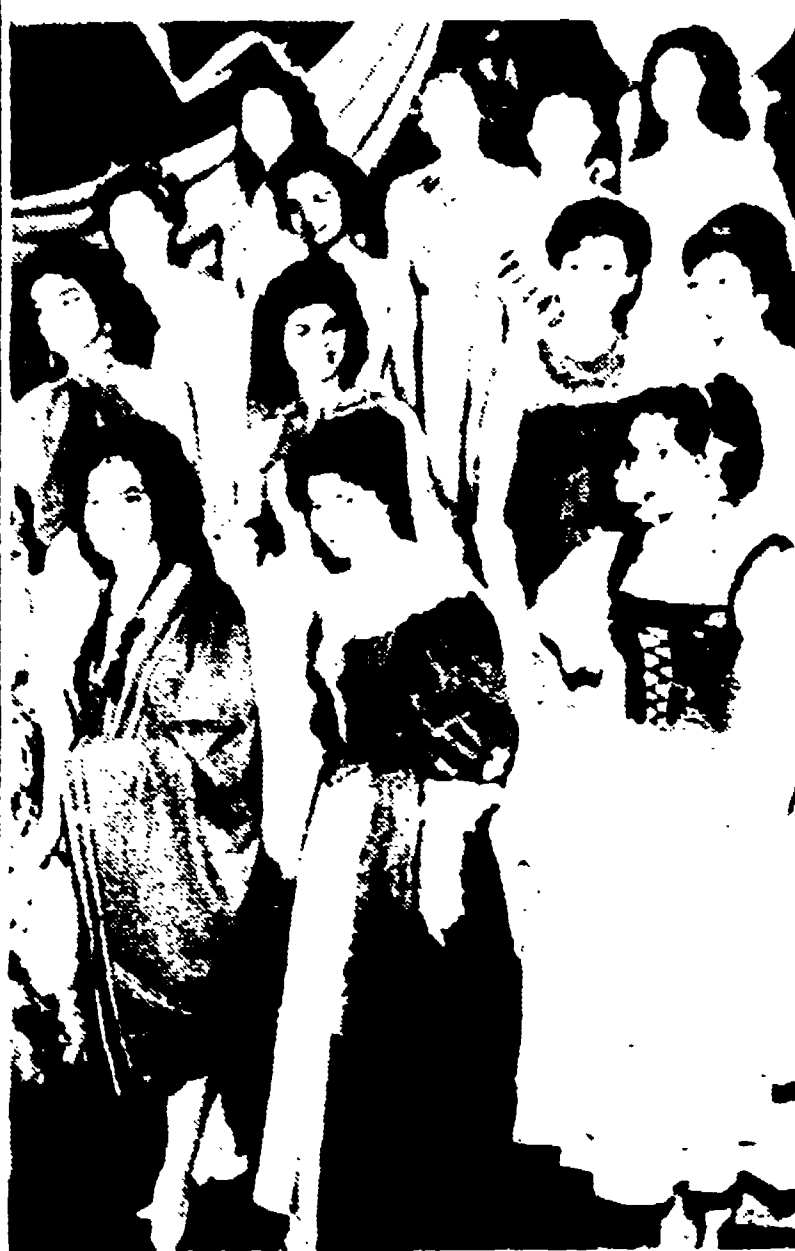
LONG BEACH. — Alcune fra le 15 finaliste del concorso internazionale di bellezza