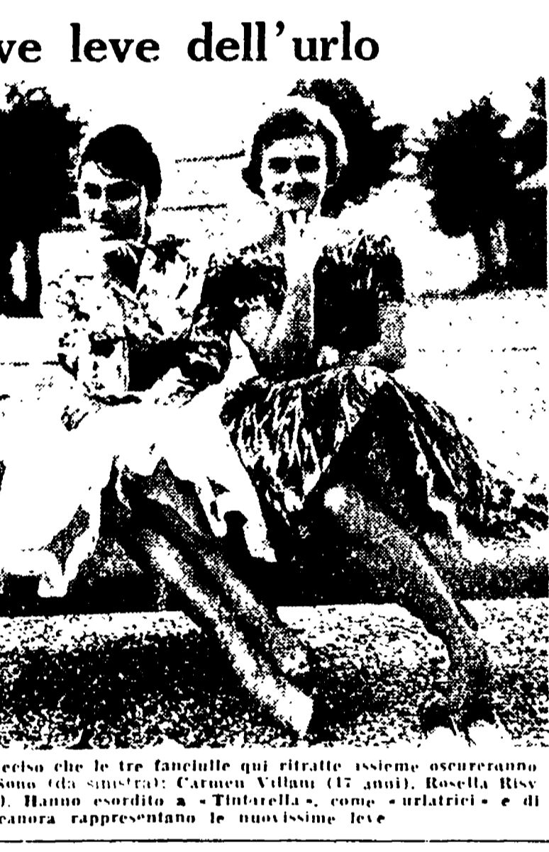
Un industriale del disco ha deciso che le tre fanciulle qui ritratte insieme ossereranno un giorno la fama di Mina... (The image shows three young women, likely related to the article about the music industry.)