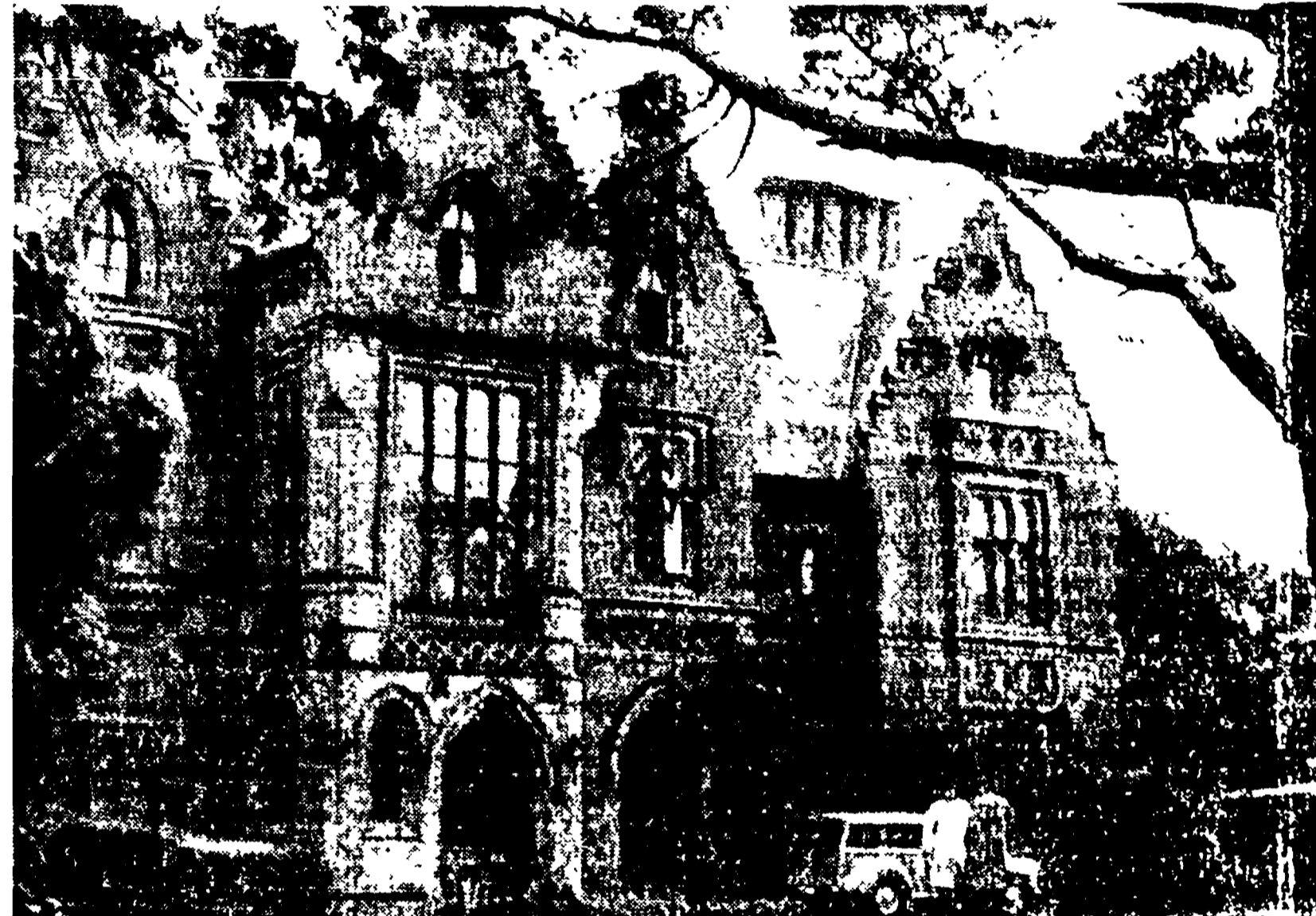
COBHAM (Surrey - Inghilterra) — Una veduta del sontuoso castello «Lewer Park» che l'attrice Elizabeth Taylor ed il marito, il cantante Eddie Fisher, hanno affittato per sei mesi per 100.000 lire settimanali. La fastosa dimora è composta di quindici camere da letto, cinque salotti, sei stanze da bagno e una piscina.