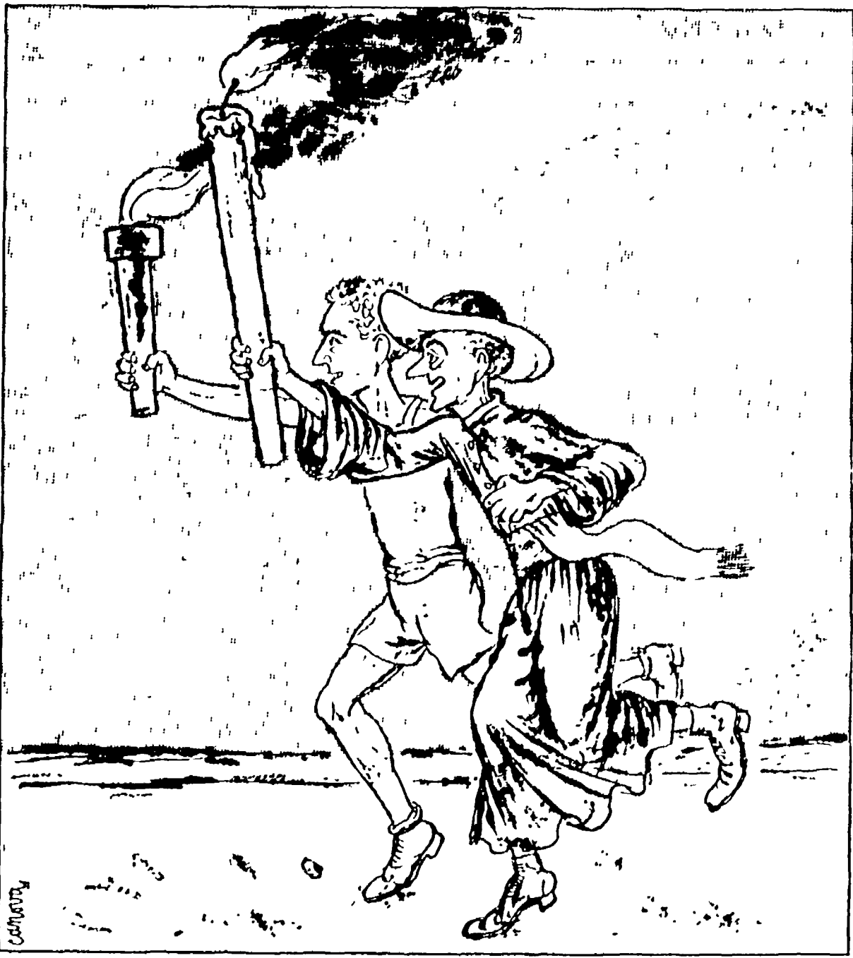
La fiaccola e il cero