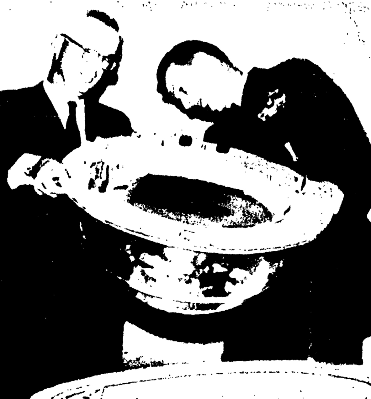
WASHINGTON - Il tenente generale Bernard Schriever, comandante dell'ufficio sviluppo e sviluppo, e il tenente colonnello E. A. Miller, direttore del progetto Discoverer, mentre sollevano insieme il computer degli strumenti di misurazione contenuti in una capsula semicircolare duplicata di quella che è stata recuperata nel Pacifico da una unità della marina americana.

Un pallone satellite messo in orbita da una base americana trasmette un messaggio del presidente Eisenhower. Il satellite « Discoverer 13 » ha inviato un messaggio del presidente Eisenhower.