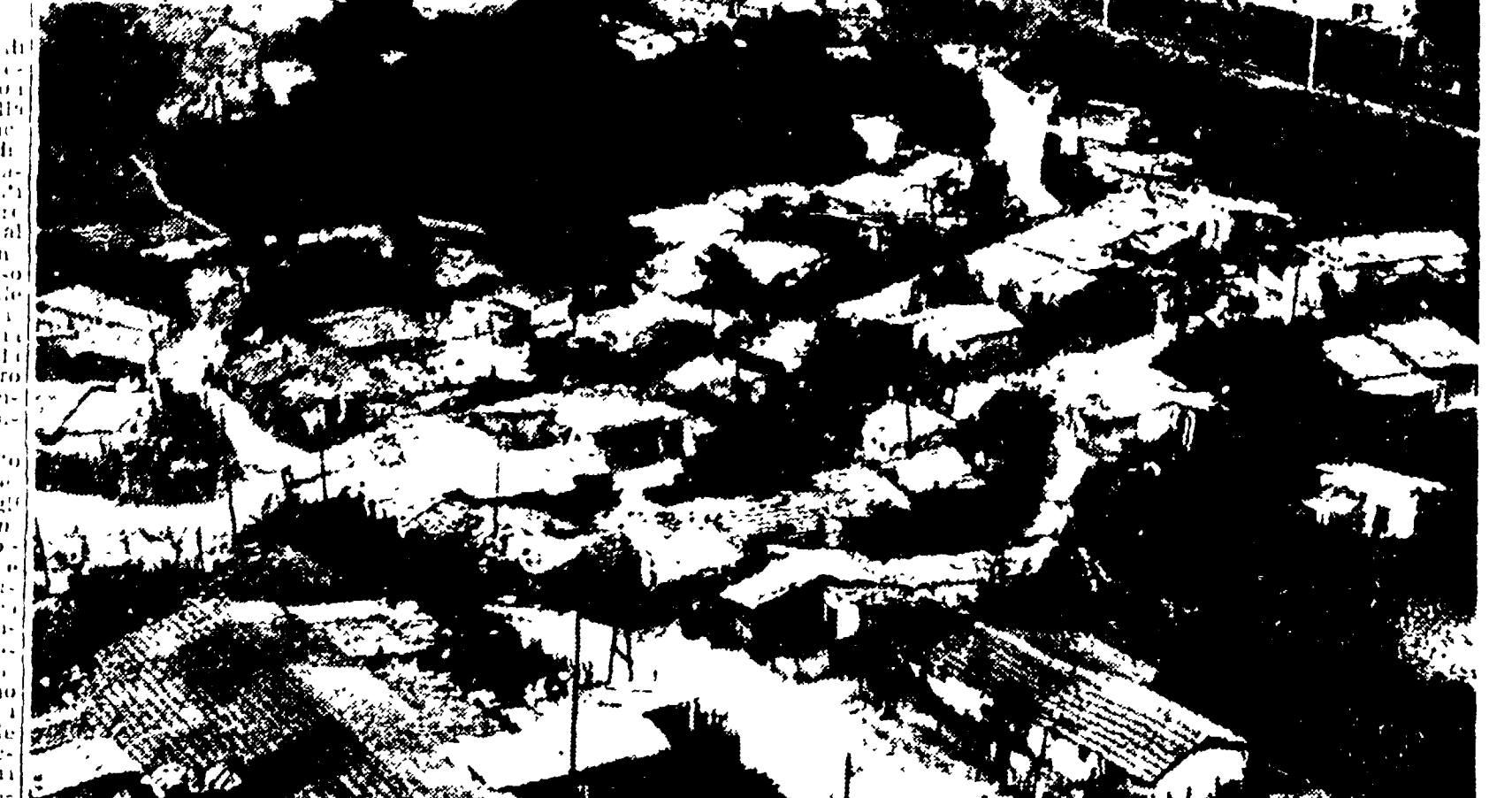
Borghetto delle Statue a S. Paolo: una squallida distesa di tuguri

Una delegazione di donne dei borghetti di via delle Statue, via Pietro Papa e piazza S. Giovanni di Dio ha protestato presso l'ICP - Precise assicurazioni del direttore dell'Istituto