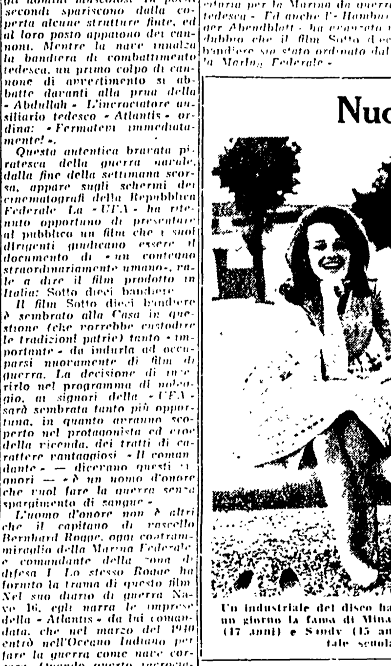
Un industriale del disco ha deciso che le tre fanciulle qui ritratte insieme ossereranno un giorno la fama di Mina... (The image shows three young women, likely related to the article about the music industry.)

PROGRAMMA NAZIONALE - 6.30: Bollettino del tempo sui mari italiani... (The text lists various radio and television programs for the day.)