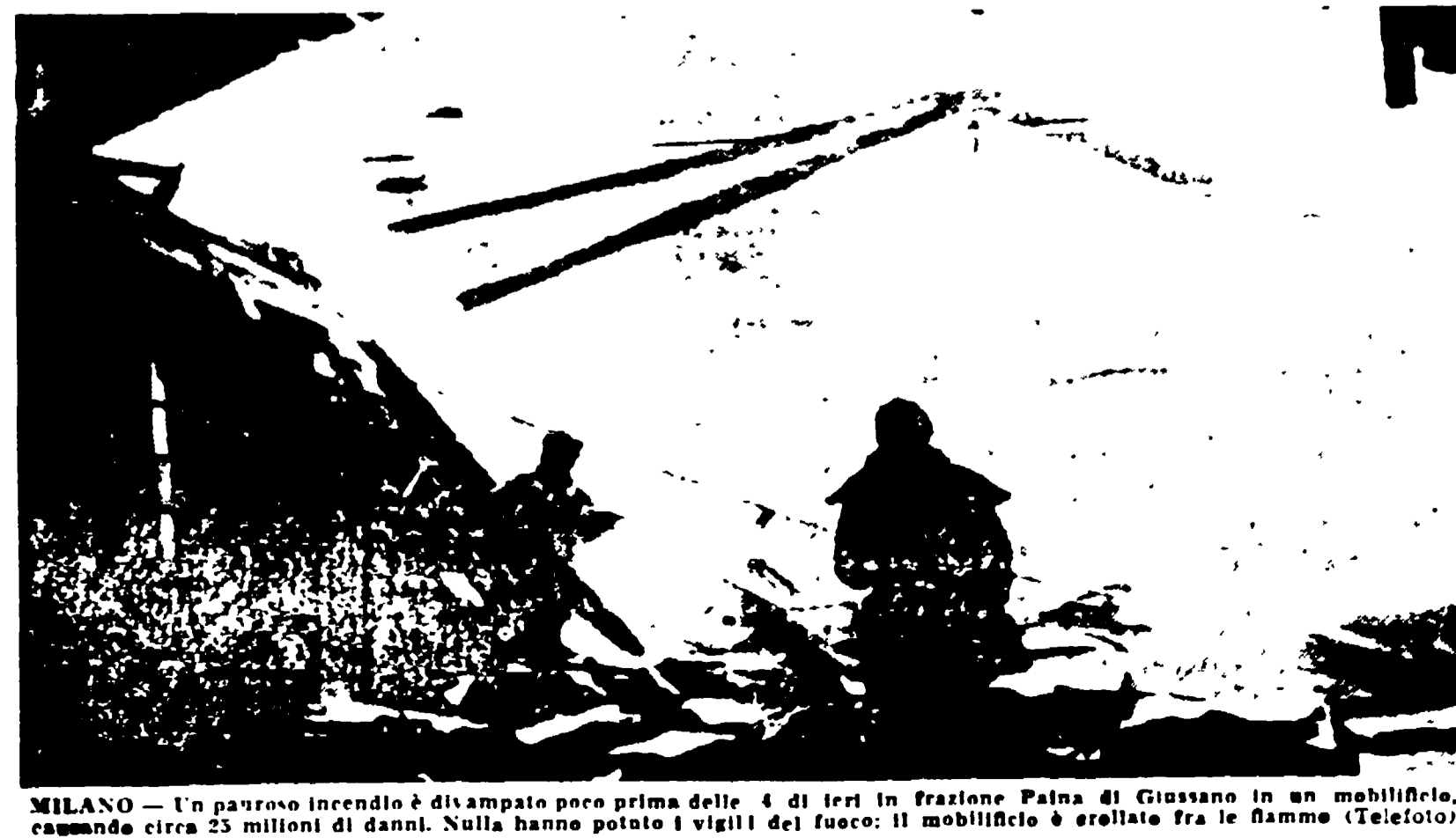
MILANO — Un pauroso incendio è divampato poco prima delle 4 di ieri in frazione Palma di Cissano in un mobilificio, causando circa 25 milioni di danni. Nulla hanno potuto i vigili del fuoco: il mobilificio è crollato fra le fiamme.