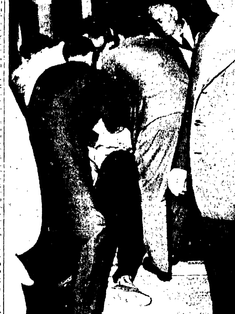
Un cameriere della pensione viene alla vista del cadavere

Il giovane è spirato poco dopo - Doveva interpretare due film a Cinecittà - Cercava un amico, quando il contrappeso della cabina lo ha quasi decapitato - Inchiesta in corso