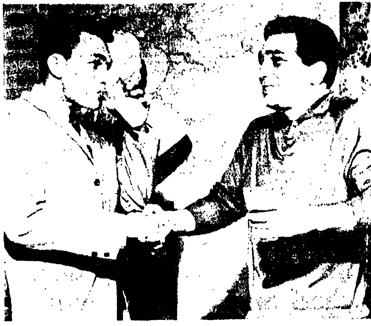
L'ultimo brindisi fra ORTIZ (a sinistra) e LOI prima dell'incontro

MILANO. 1. - Compiuta l'ultima libbra... questa libbra di peso Carlos Ortiz e Datto Loi si batteranno domani sera nel ring di San Siro per il titolo mondiale dei welter junior.