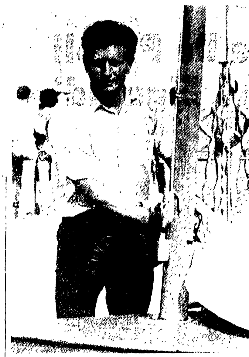
Il velista sovietico Chuchelov è l'unico a mantenere viva l'interesse nelle gare della categoria dei «finn» dove lo svedese Elvestrom sta imponendo la sua superiorità

bahamense Knowles tena ancora vivo l'interesse per questa categoria che è in fondo la più affascinante di tutte.