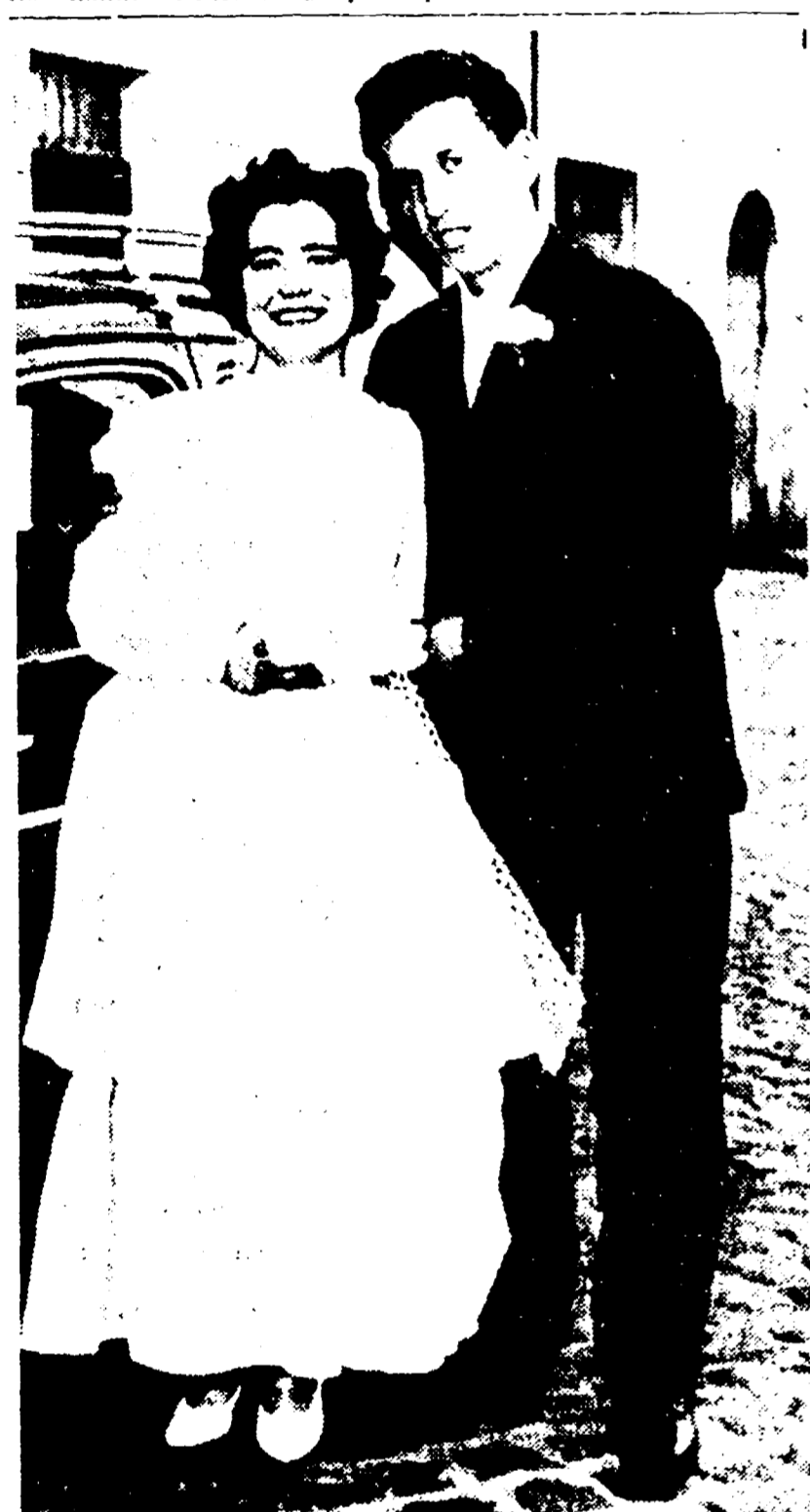
La vittima e l'assordito in una foto scattata il giorno delle nozze

Acceso dalla gelosia, un giovane guardiano ha ucciso la moglie diciannovenne squarciandola la gola con un coltello. La tragedia, per molti versi oscura, è avvenuta nelle prime ore di ieri a Montecompatri, nella casa dei genitori della vittima. Ad essa ha assistito senza capire l'unico figlio, un bimbo che ha quindici mesi.