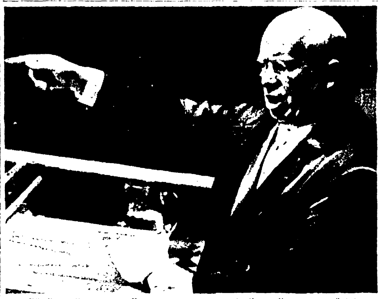
NEW YORK. - Il compagno Krusciov mentre pronuncia il suo discorso