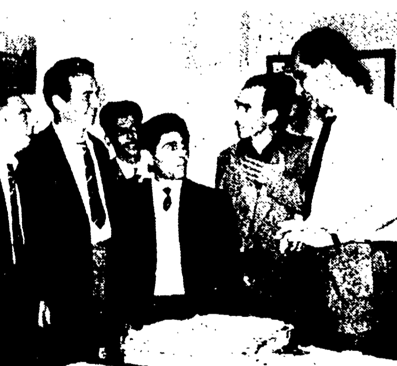
La delegazione dei minatori della Pertusola a colloquio con il nostro direttore (a destra) durante la visita all'Unità.