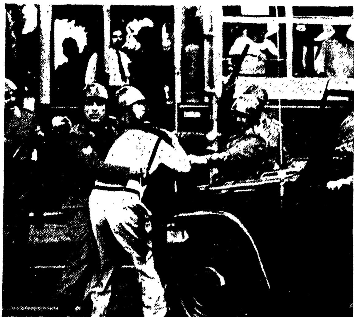
PORTA S. PAOLO, 6 LUGLIO. La furla dei poliziotti scatenati da Marzano