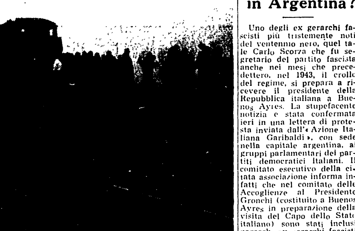
BORGO SAN LORENZO — Operai, esserenti, studenti, impiegati — stanchi di 13 anni di promesse del governo, che ancora non ha provveduto a ricostruire la ferrovia «Faentina», costringono le popolazioni del Mugello a viaggi molto più lunghi del necessario — ieri mattina hanno costato in massa in mezzo ai binari, provocando la partenza del primo «diretto» per Firenze con circa due ore di ritardo. Una delegazione si è poi recata in corteo, in Prefettura. Un ex consigliere in seguito alla scandalosa questione della «Faentina», ha rifiutato di ripresentarsi candidato. Nella foto: i viaggiatori, fermi sul binario, impediscono la partenza del treno