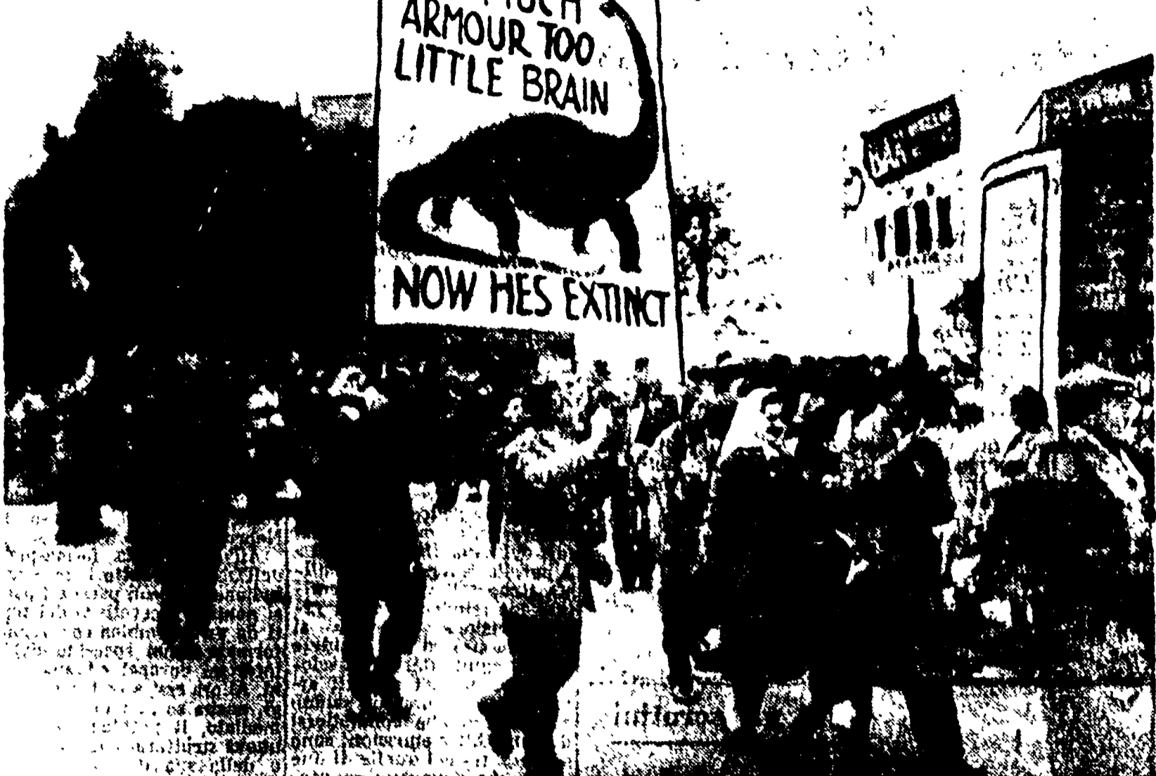
SCARBOROUGH - Una grande manifestazione ha avuto luogo nella città inglese contro lo sviluppo delle armi nucleari. La manifestazione ha culmine con l'incenerimento del cruscotto del partito ad accettare la mozione della sinistra che chiede il disarmo unilaterale atomico della Gran Bretagna. Sul cruscotto era rappresentata un dinosauro estinto. Molti armatori, poco cervelloni ora è estinto.