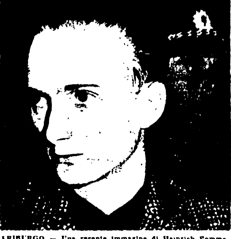
FRIBURGO - Una recente immagine di Heinrich Pommerenke

FRIBURGO, 3. - Si è cominciato ieri il processo di scarico di un delinquente che è stato accusato di aver ucciso quattro donne e di aver tentato di assassinare altre tre. Il pubblico ministero ha fatto un'inchiesta su un delinquente che ha ucciso quattro donne e di aver tentato di assassinare altre tre.