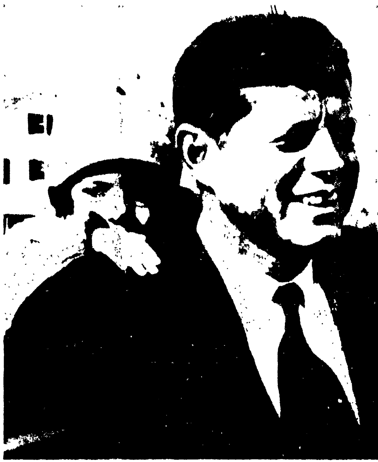
BYANSISPORT (Massachusetts) - Kennedy con sulle spalle la figlia Caroline di tre anni sorride soddisfatto dopo aver appreso i risultati delle elezioni

Richiesto di un giudizio sul successo di Kennedy il compagno Togliatti ha dichiarato all'agenzia ANSA: «Non conosco abbastanza la situazione interna degli Stati Uniti per poter esprimere un giudizio completo sul significato della vittoria di Kennedy. Mi sembra, però, che questa vittoria abbia una certa analogia con la prima vittoria riportata dal Presidente Roosevelt, molti anni or sono. La campagna elettorale di Roosevelt aveva messo in luce, allora, la grave crisi che stavano attraversando le strutture economiche degli Stati Uniti. Nella attuale lotta elettorale mi sembra che il meglio del signor Kennedy stia nel fatto che egli ha messo in luce, con la sua campagna, la grave crisi che oggi colpisce le strutture internazionali e le posizioni internazionali dell'imperialismo americano. Roosevelt, quando si presentò ad affrontare i problemi posti da questa crisi nel modo che noi consideriamo giusto, cioè facendo una politica di distensione internazionale, di disarmo generale e, quindi, di sicurezza e di pace per tutti i popoli? E' ciò che noi si auguriamo per il nostro paese che è per noi molto difficile una previsione precisa».