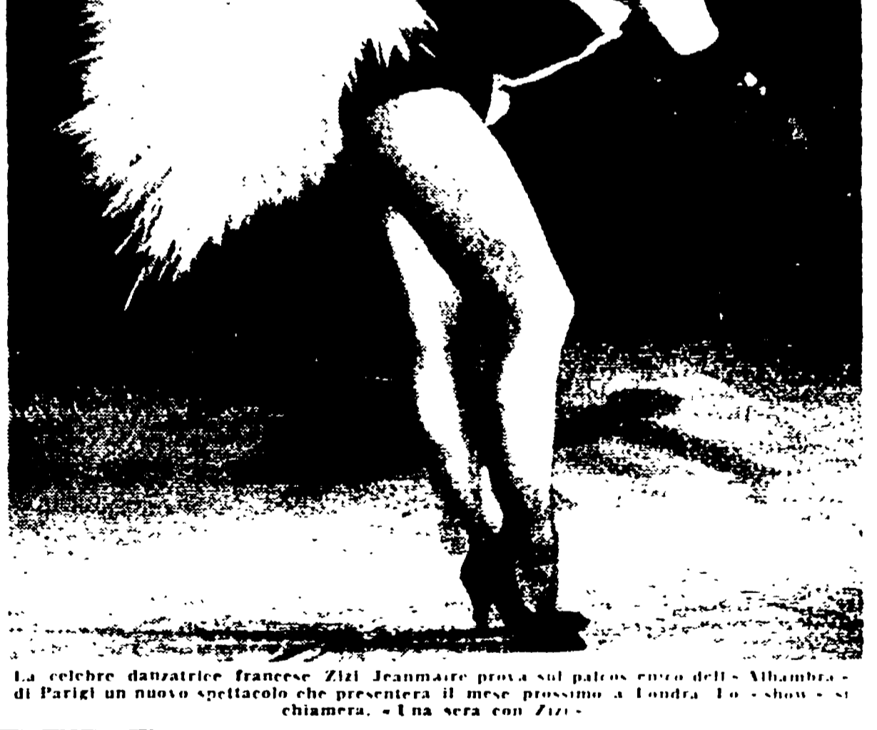
La celebre danzatrice francese Zizi Jeanmaire...