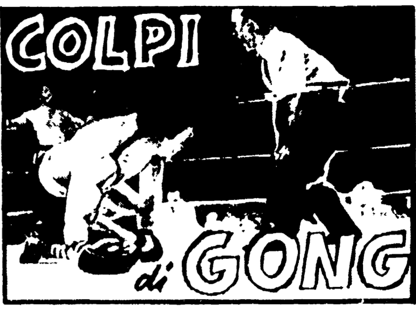
COLPI di GONG