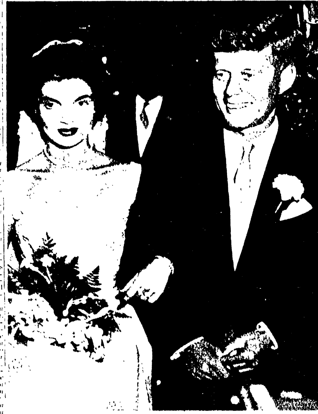
Una foto dall'album della famiglia Kennedy...