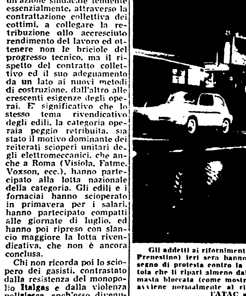
Gli addetti ai rifornimenti dell'ATAC (deposito di piazzale Prentestino) ieri sera hanno scioperato per qualche ora...