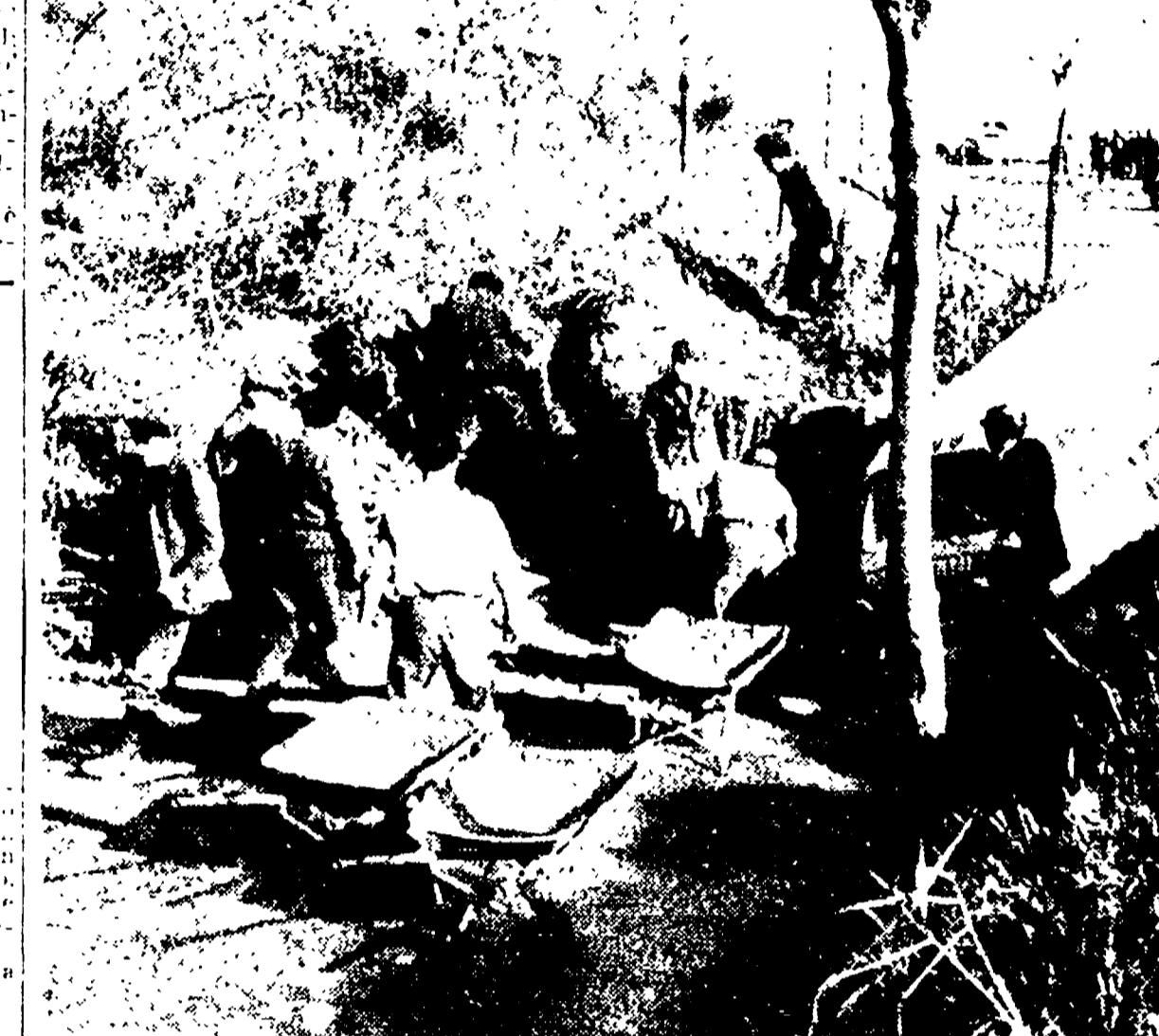
Anche nei altri metri cubi di terriccio e di fango sono precipitati sulla Trionfale, nello stesso punto in cui domenica una frana (nella foto) aveva sepolto due giovani

stione — che il Comune spende per la bellezza di, quasi cinque miliardi all'anno per i lavori di manutenzione ordinaria delle strade. Come un simile somma, si deve pensare, qualcosa di più se si tiene conto del fatto che, per opera in tutta fretta per la bellezza della città, si sono dovuti mettere in piedi per ben due volte per tentare di riempire le buche con il maltempo. E' evidente che qui c'è qualcosa di ben più grave della pioggia persistente. Dopo queste amare es-