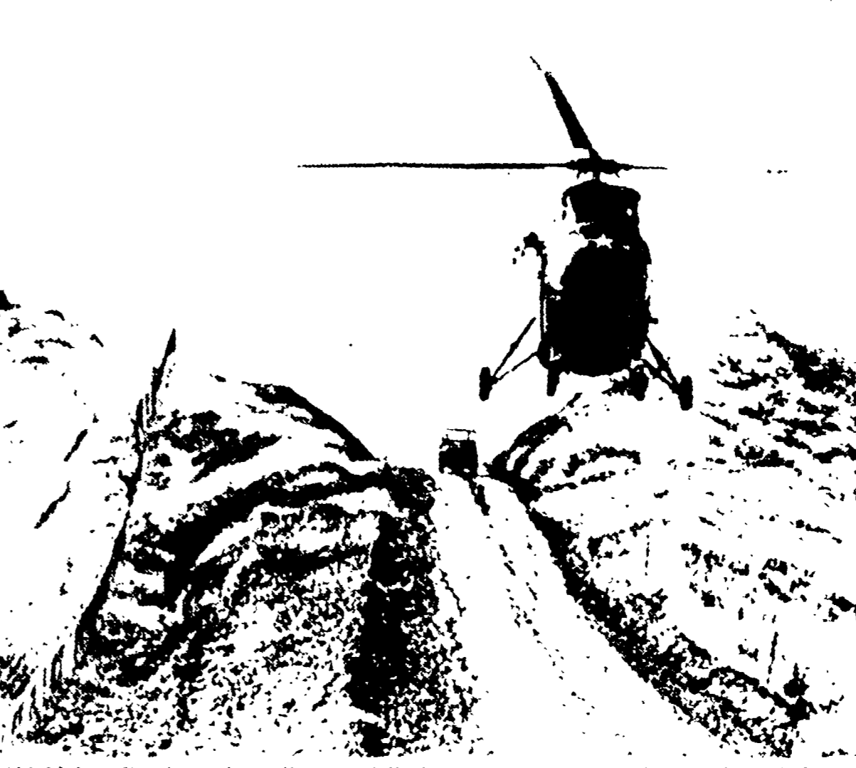
L'AVANA — Una jeep ed un elicottero delle forze armate americane fanno la linea di demarcazione fra la base americana di Guantanamo e il resto del territorio cubano

Ne fanno parte due portaerei, incrociatori armati di missili, sommergibili atomici e mille fucilieri di marina - Guantanamo inclusa nelle «manovre»