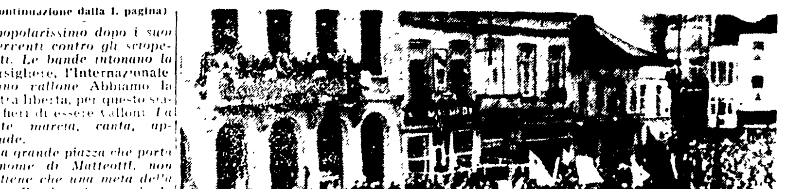
LOUVREMI. — Migliaia di lavoratori mentre ascoltano il comizio del leader socialista Andre Renard