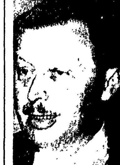
Il dittatore Stroessner