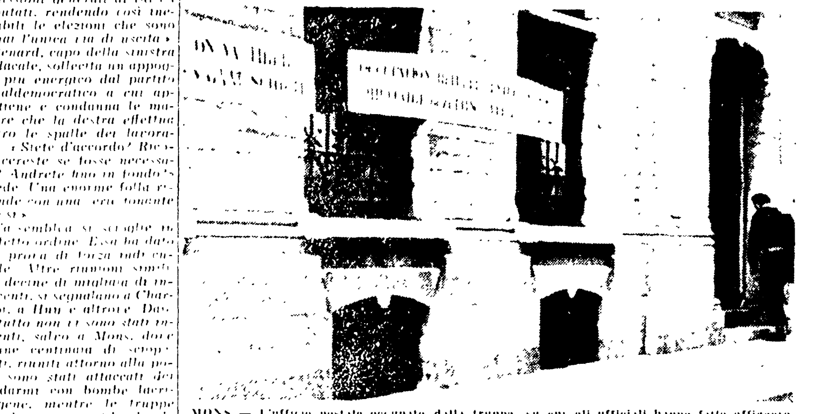
MOSS. — L'ufficio postale occupato dalla truppa, su cui gli ufficiali hanno fatto affiggere cartelli che dicono in francese e in fiammingo « Spareremo » e « Occupazione militare »