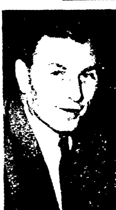
BRUXELLES — Andre Renard dirige la sciopero nella Vallonia

Imponenti manifestazioni a Mons, Charleroi, La Louvière e Huy - Il sindacalista Renard chiede al Partito socialdemocratico di aprire un "secondo fronte" di lotta