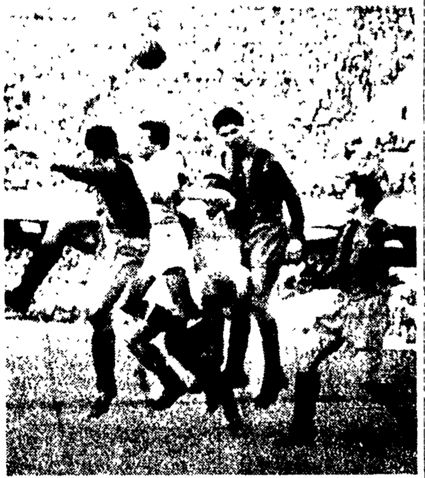
● Prima di due uomini di Catania si è stretto nella sua area a difendere la vittoria. Nella foto: due attaccanti partenopei stretti nella morsa - degli etnei.