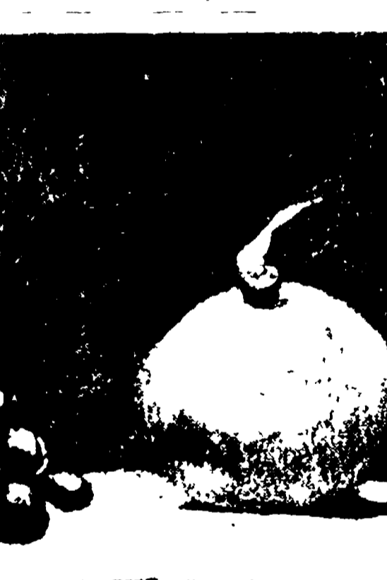
BERTOLDO ZAVATTINI - «Natura morta» (1940). Uno dei quadri «minimi» di Zavattini.

Il Bertoldo di Zancanaro è un libro di illustrazioni di Giulio Cesare Croce. Le bellissime illustrazioni del pittore al libro di Giulio Cesare Croce nella bella edizione Canesi.