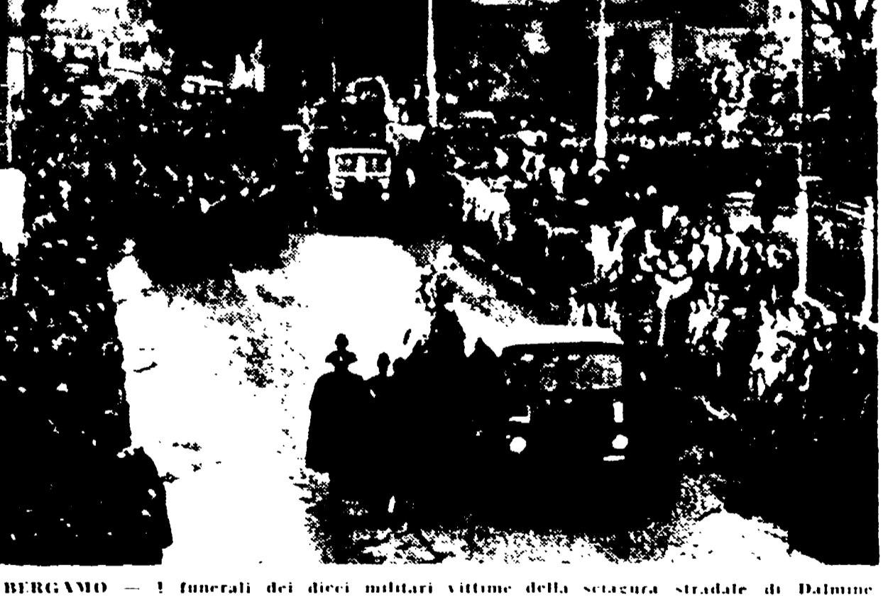
BERGAMO - I funerali dei dieci militari vittime della sciagura stradale di Dalmine si sono svolti ieri pomeriggio. Una folla imponente ha fatto ala al passaggio delle bare lungo le vie della città. Alla cerimonia hanno partecipato, oltre al battaglione di cui facevano parte gli ucraini, reparti in armi del presidio di Bergamo e rappresentanti del III Corpo d'Armata di Milano. Il corteo funebre ha raggiunto il cimitero dove le bare sono state alligate nella camera mortuaria in attesa di essere trasportate nei paesi natiali.