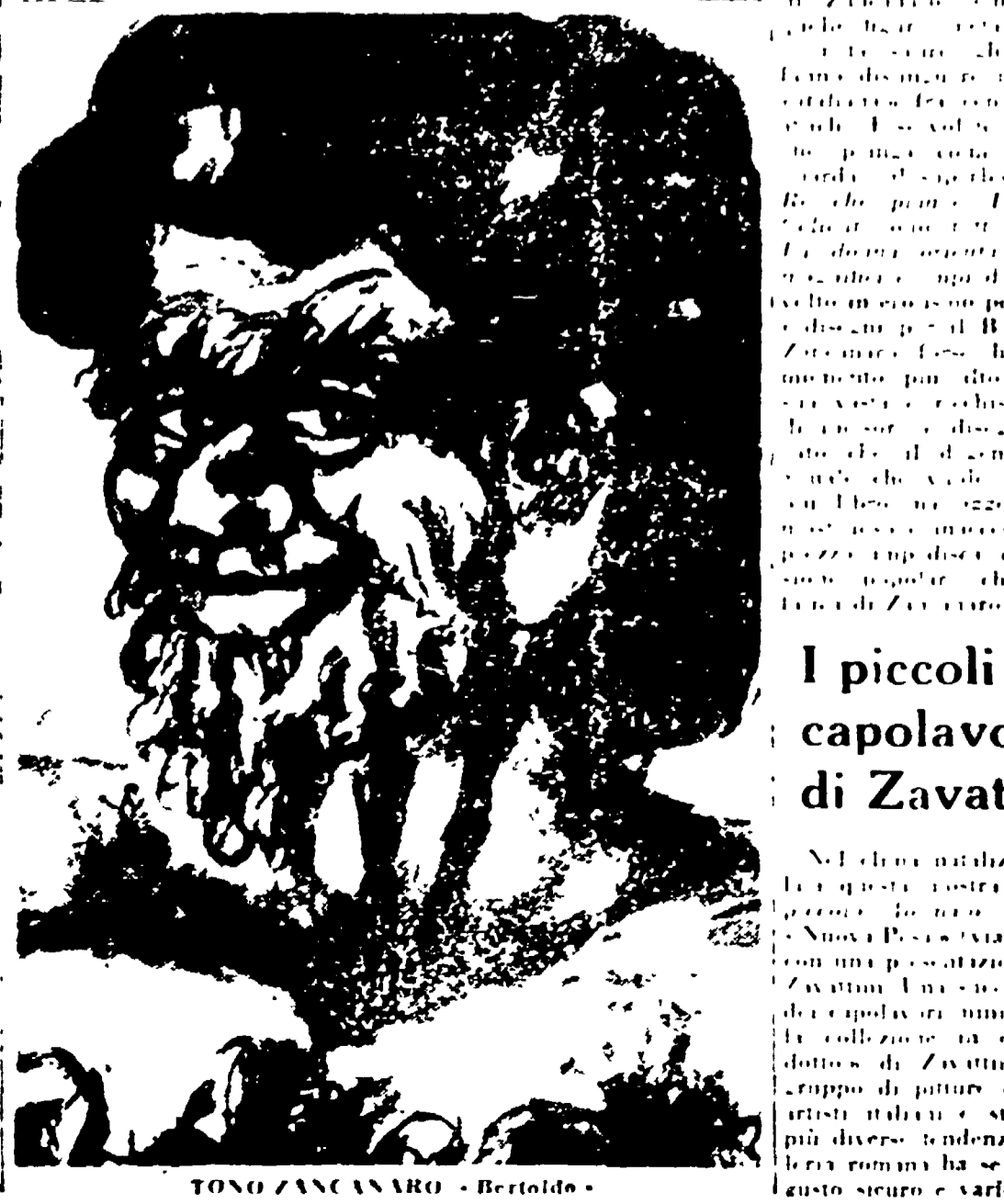
TONO ZANCANARO - Bertoldo.

Il Bertoldo di Zancanaro è un libro di illustrazioni di Giulio Cesare Croce. Le bellissime illustrazioni del pittore al libro di Giulio Cesare Croce nella bella edizione Canesi.