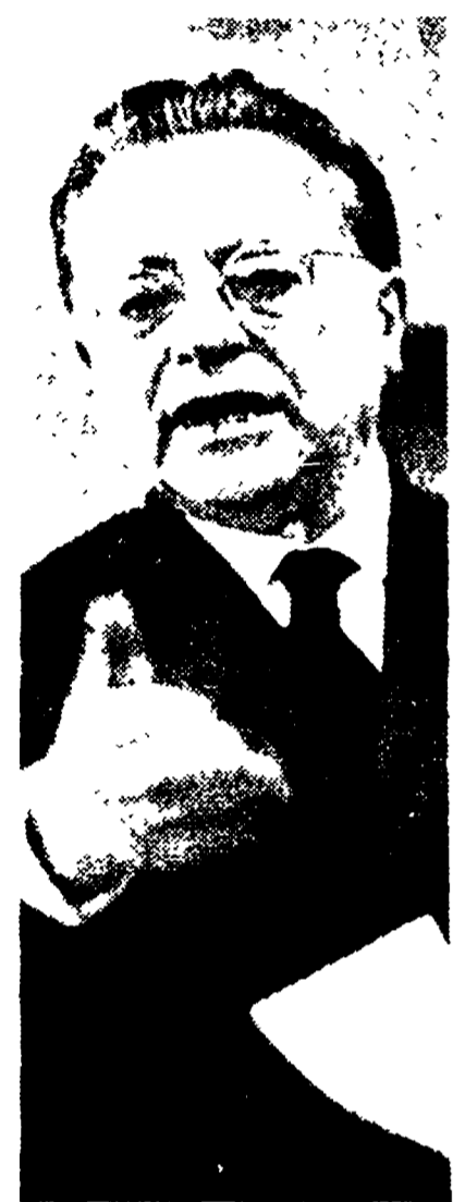
(Dal nostro inviato speciale)

Il problema della terra costituisce oggi uno dei nodi decisivi della lotta per lo sviluppo democratico della società italiana - Migliaia di cittadini alla manifestazione per il 40. del P.C.I.