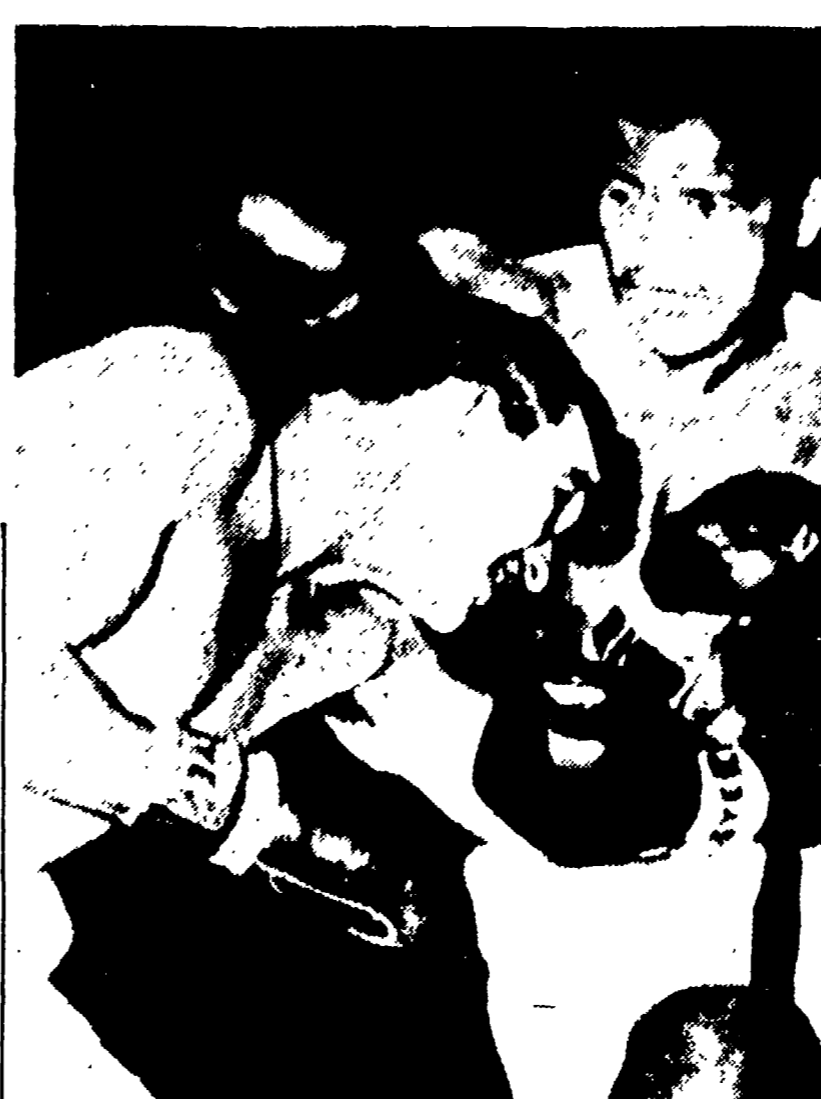
Una fase campionata del mondo del med tra Fullmer (a sinistra) e Robinson (a destra)