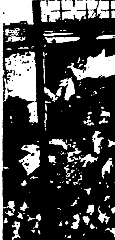
MEVA — Quattro persone hanno perso la vita e 15 sono rimaste ferite nel deragliamento di un treno della Ferrovia Nord, sulla linea Meva-Milano. Nella foto: le persone accorse dal vicino campo sportivo, guardano all'interno del tunnel la massa contorta del locomotore deragliato.

me d'azione coi cattolici, per fissare assieme la strada delle trasformazioni sociali del nostro paese, nel senso dello sviluppo della democrazia economica e politica. Così si gettarono le fondamenta costituzionali di un ordinamento nuovo. Per questo — ha aggiunto Togliatti — noi affermiamo che il processo storico del P.C.I. è un processo nazionale, una parte decisiva della realtà e della storia del nostro popolo in questo quarantesimo. Noi costituivamo una realtà italiana, incarnata, in-