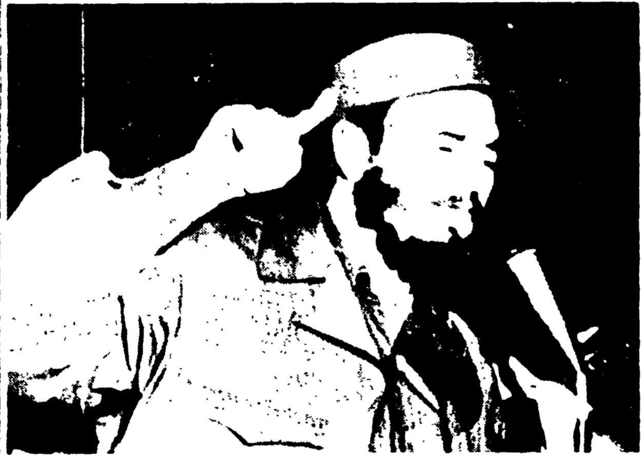
L'AVANA, 5. — Il premier cubano Fidel Castro durante un comizio.

Fidel Castro denuncia l'attività sovversiva degli Stati Uniti - Il giornale americano «Baltimore-Sun» rivela i piani per l'attacco a Cuba