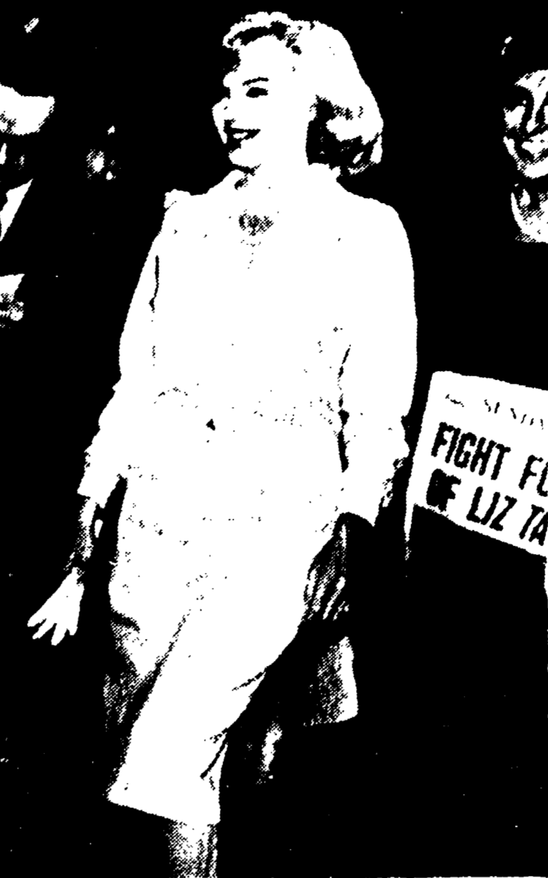
NEW YORK — Marilyn Monroe è uscita dalla clinica dove era ricoverata da due settimane. Ha dichiarato di sentirsi «meravigliosamente» nella telefonata. La diva americana dai giorni scorsi è a destra, una donna che informa sulla lotta per la vita di Elizabeth Taylor.