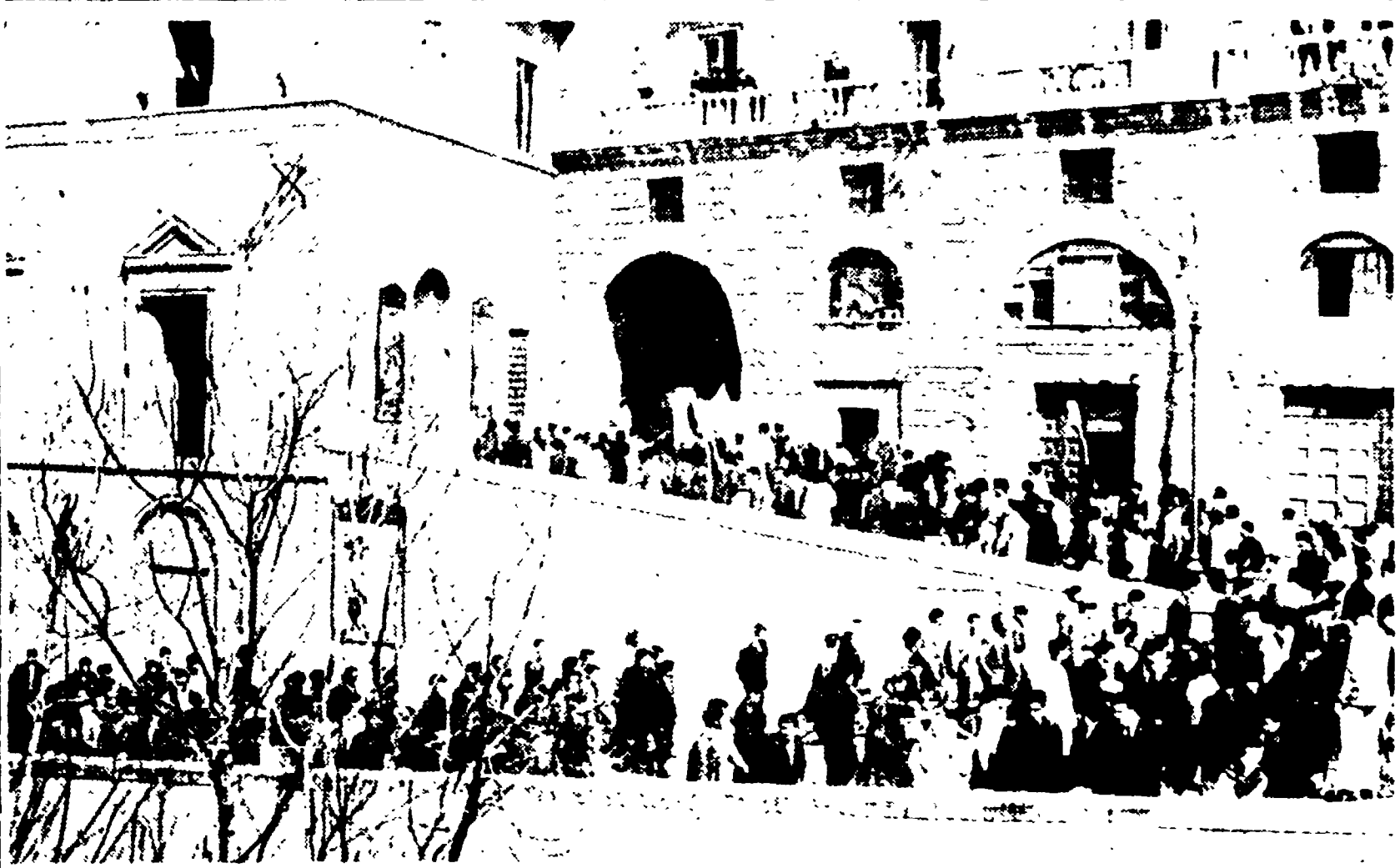
GUSPINI - Proseguono da sette giorni l'occupazione delle miniere Montevocchio (Montecatini). Nelle foto una manifestazione di solidarietà al centro del paese