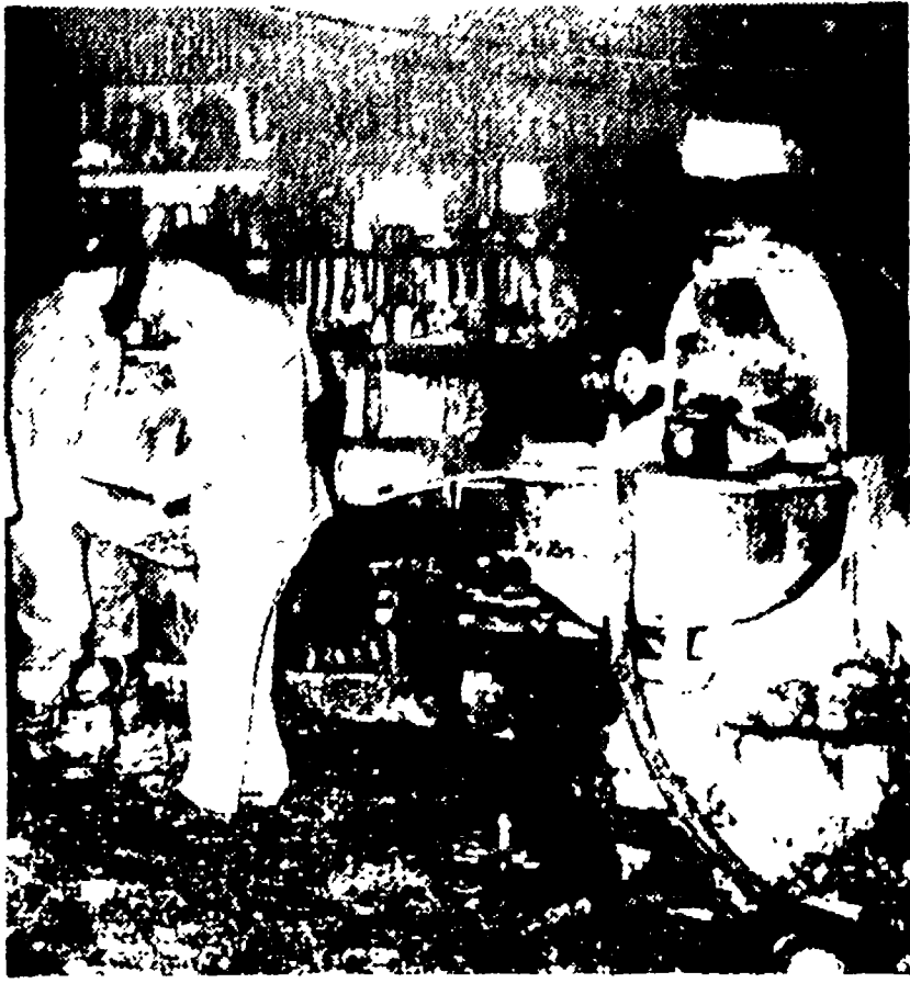
Il negozio distrutto dal fuoco

Il negozio, appena chiuso dal proprietario, è andato distrutto — Una saracinesca semifusa dal calore