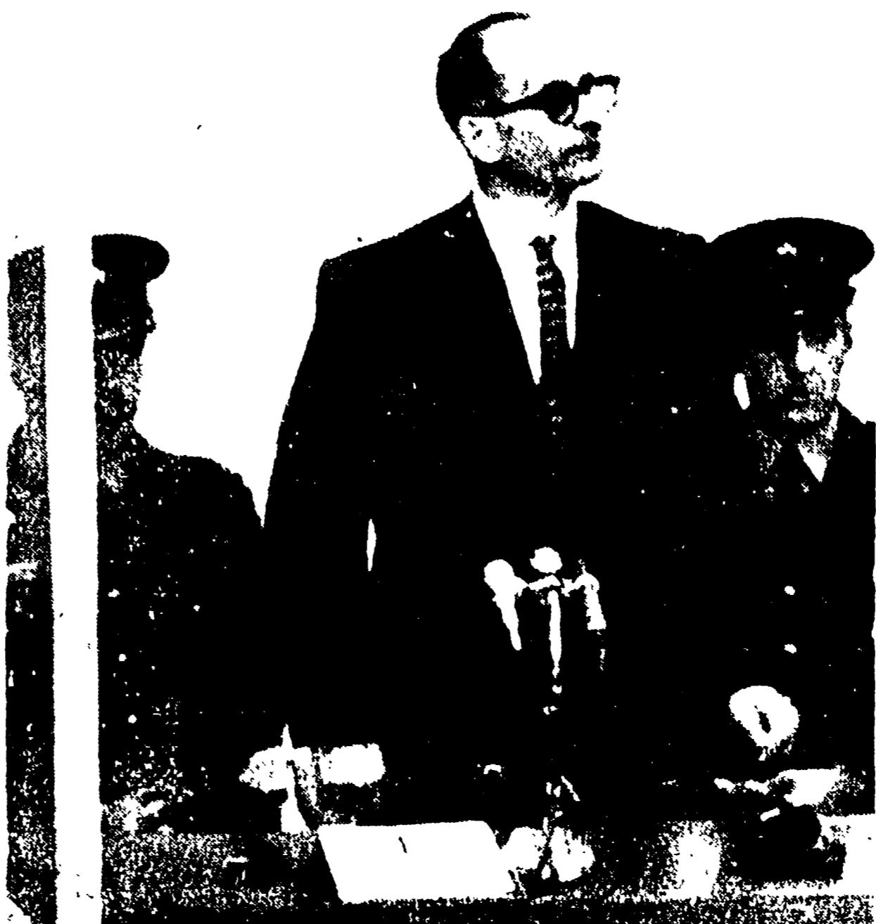
GERI SALIMMI - Il criminale Eichmann in piedi tra due agenti nella gabbia di vetro ascolta la lettura dell'atto di accusa