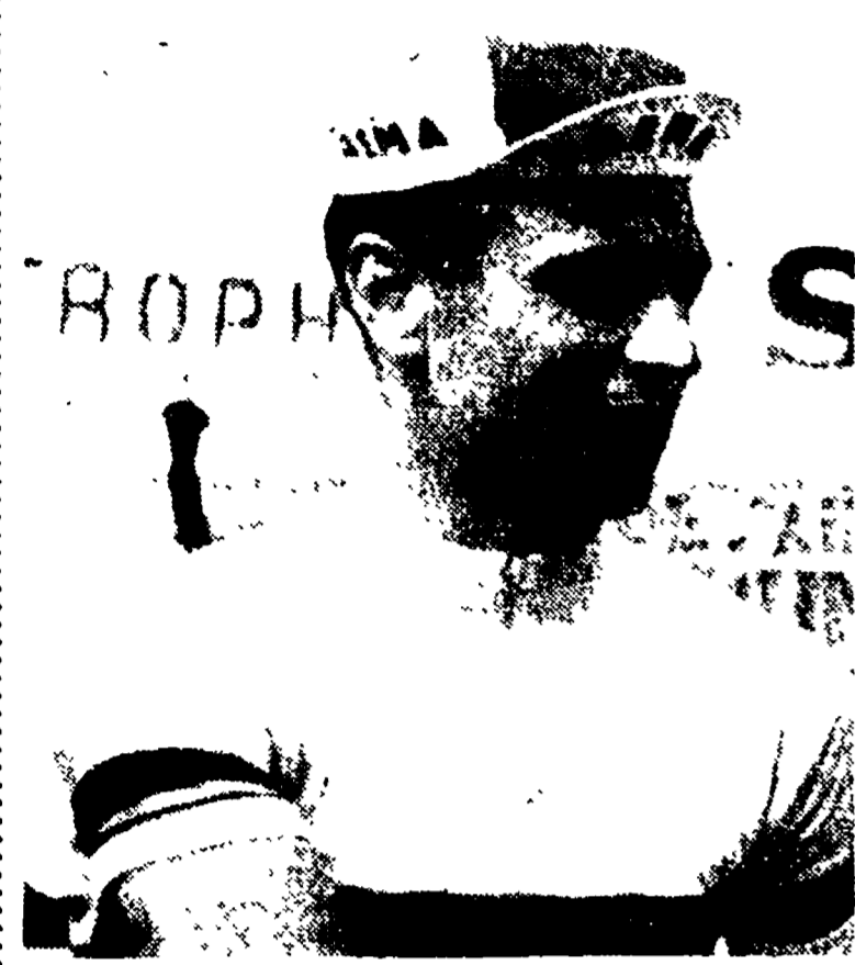
(Dal nostro inviato speciale)

PARIGI, 11. — Alla vigilia della Parigi-Bombay, Van Looy dichiara a l'Europe che grande è il suo desiderio di poter vincere, almeno una volta, la corsa che dalla Ville Lumière va nella città dell'inferno del Sud. Adesso che ha raggiunto uno dei suoi obiettivi, il fuoriclasse belga si dedica al lavoro. «Ho fatto un tour di lavoro, forse ho fatto di più che molti corroni in un'ora», dice Van Looy. «Ma non mi sento affatto stanco. La corsa della Pace, che si svolgerà dal 15 al 22 aprile, è un lavoro che mi piace molto. E' una prova di resistenza che mi serve per prepararmi alla Parigi-Bombay. Non mi sento affatto stanco. La corsa della Pace, che si svolgerà dal 15 al 22 aprile, è un lavoro che mi piace molto. E' una prova di resistenza che mi serve per prepararmi alla Parigi-Bombay. Non mi sento affatto stanco.