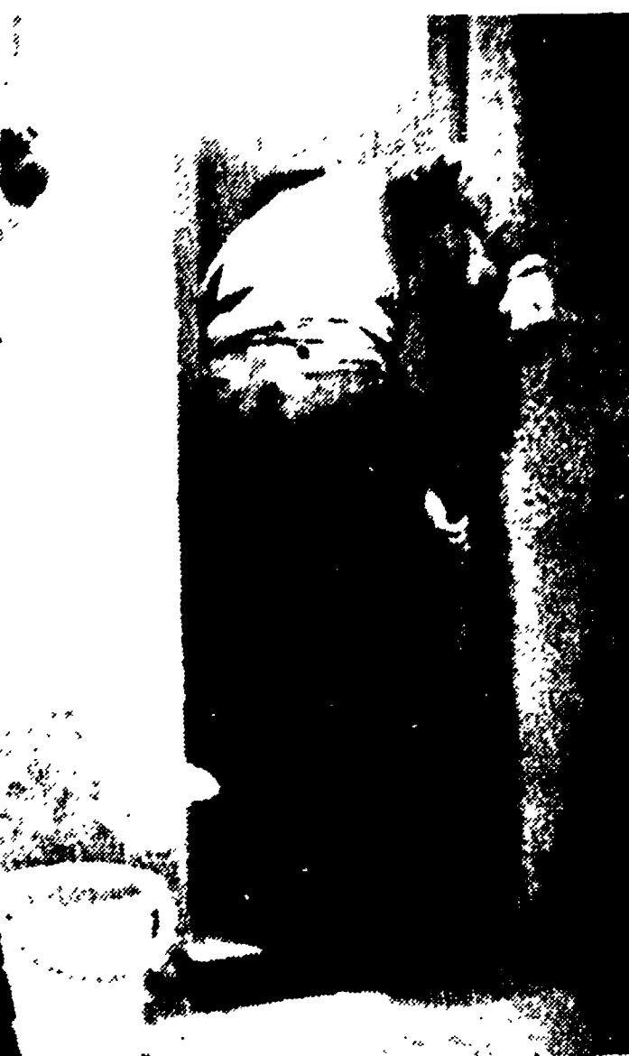
GIERUSALEMME — Eichmann fotografato mentre pulisce la sua cella.