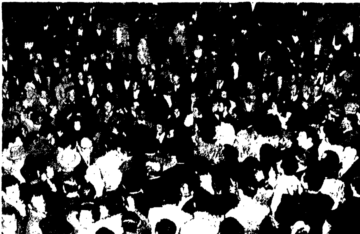
Continui gli «luttisti» - hanno partecipato ieri sera alla seduta del Consiglio comunale per chiedere il rispetto degli impegni presi dal Comune per la stipulazione di un contratto di sanità. Nella foto: la folla dei «luttisti» sul piazzale del Campidoglio

Nei commenti, la «fuga» del sindaco viene messa in relazione con la situazione che si è venuta a creare nella Dc romana in conseguenza del marasma in cui versa la giunta e dei contrasti fondamentali alle mosse difensive nel seno stesso del partito clericale. Le manovre intorno alla amministrazione Ciocchetti in questi giorni si sono fatte affannose. La convinzione che il ritiro di Ciocchetti divenga sempre più inevitabile si fa strada anche nelle file della Dc. Il colloquio tra Fanfani e il sindaco di ieri l'altro non può non essere