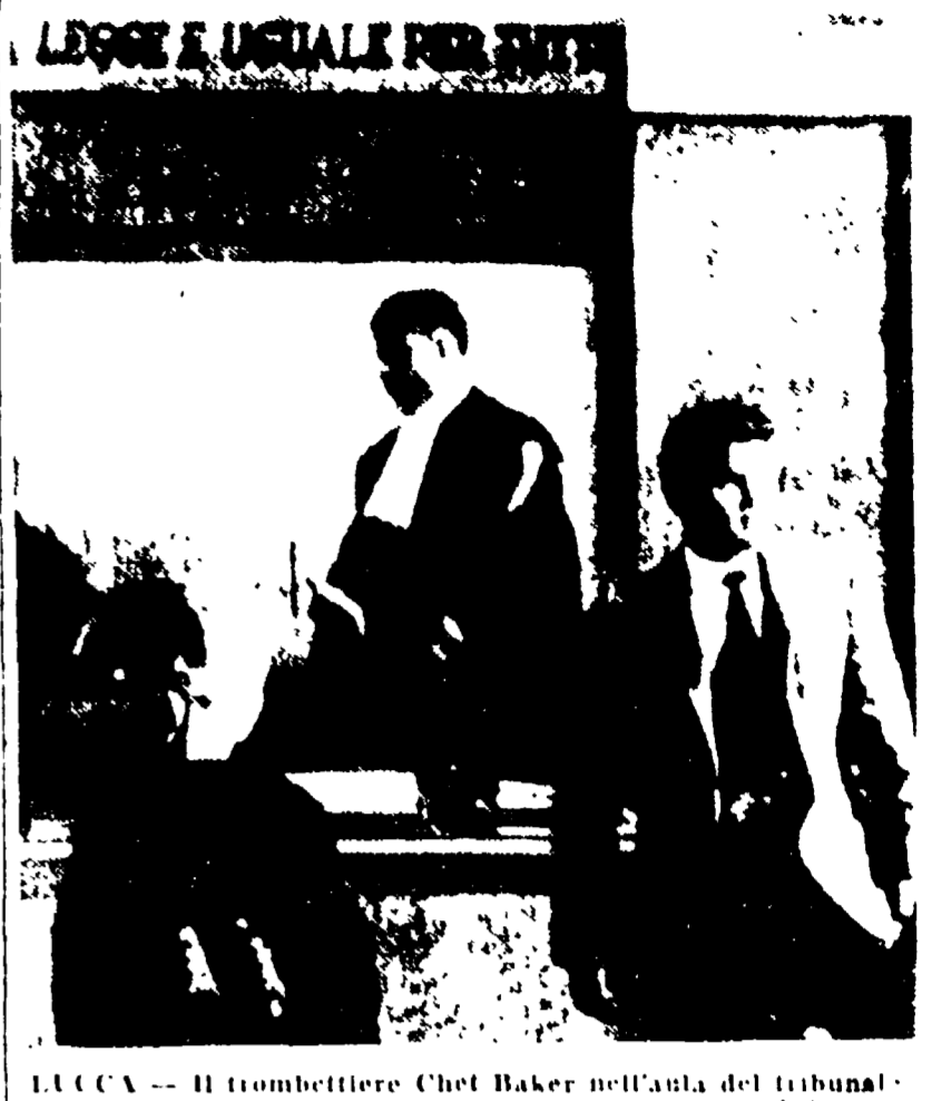
LUCCA — Il trombettiere Chet Baker nell'aula del tribunale

«Ero venuto in Italia per guarire» - Afferma di non avere importato la droga Nel suo arresto furono coinvolti medici e farmacisti - Il processo rinviato