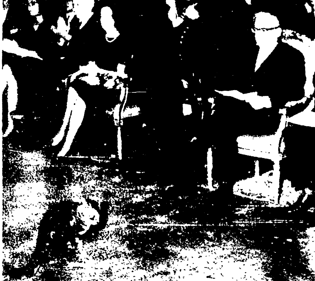
ALCIDE DE GASPERI - Un colloquio tra i due capi di governo italiani a Buenos Aires, in Argentina. A fianco: il ministro Martelli, il sottosegretario Russo, gli ambasciatori Strano e Babusio Rizzo, il ministro Sena, da parte argentina, il ministro degli Esteri Taboada, l'ambasciatore a Roma, Solanas Pacheco e altri funzionari della presidenza Sena, da parte italiana. Un altro incontro fra i due presidenti avrà luogo nella giornata di domani.