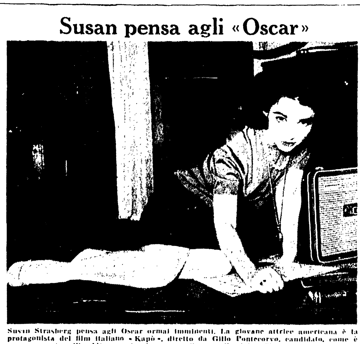
Susan Strasberg pensa agli Oscar ormai imminenti. La giovane attrice americana è la protagonista del film italiano «Kapò», diretto da Gillo Pontecorvo, candidato, come è noto, all'ambito premio cinematografico per il miglior film straniero.