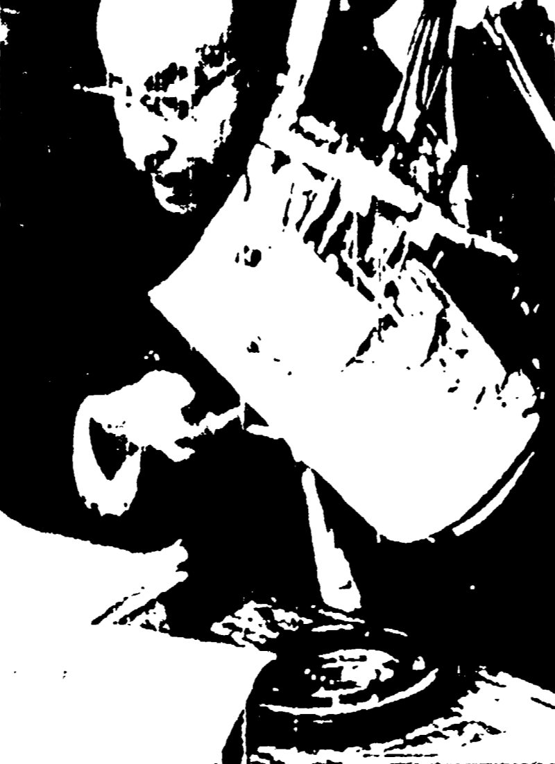
NEW YORK — Il ministro degli Esteri cubano Raul Roa durante la riunione del comitato politico dell'ONU, mostra una foto di equipaggiamenti militari di fabbricazione americana scoperti all'Avana in depositi di ribelli.