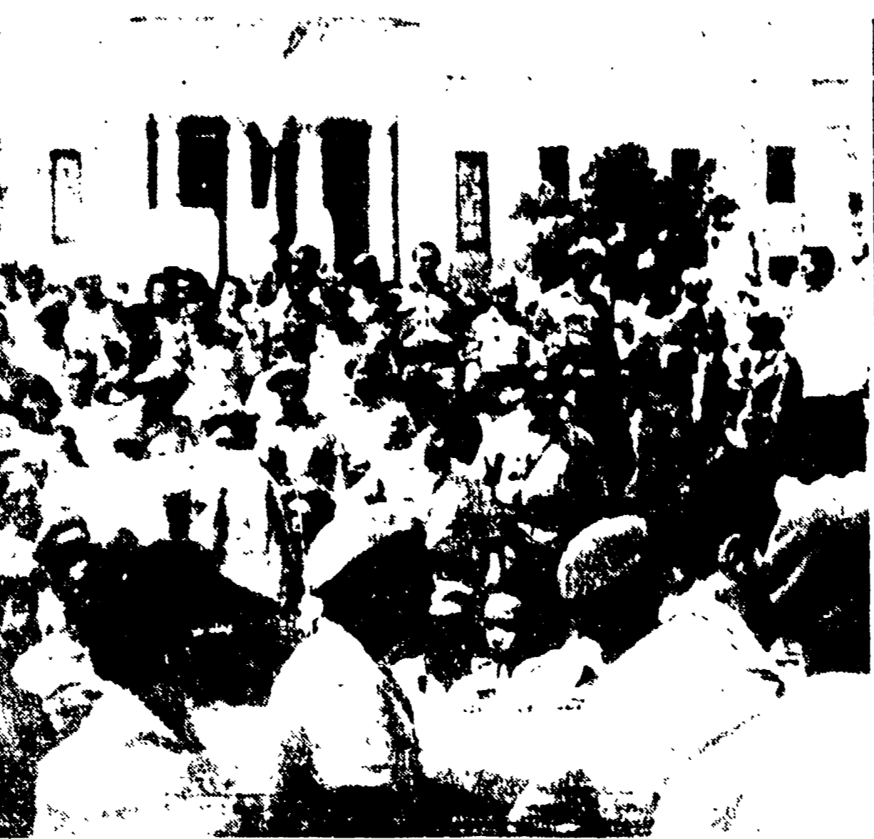
Avana — Membri dell'esercito popolare e donne trasportano a spalla le bare delle vittime del bombardamento aereo di sabato.