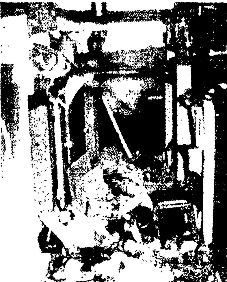
Termeno - L'interno del bar danneggiato dall'esplosione.

La polizia austriaca fu messa in allarme da una comunicazione anonima - Numerosi fermi a Termeno