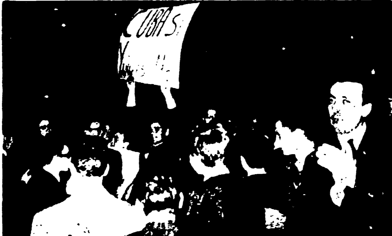
La manifestazione dei giovani a piazza di Spagna a Roma (segue in cronaca a pag. 1)

Appello di Dorticos e Castro ai cubani e al mondo - Il capo mercenario Cardona rivela che i ribelli sono stati addestrati negli Stati Uniti - Combattimenti nel sud dell'Isola - Il governo cubano vieta i voli dalla base americana di Guantanamo