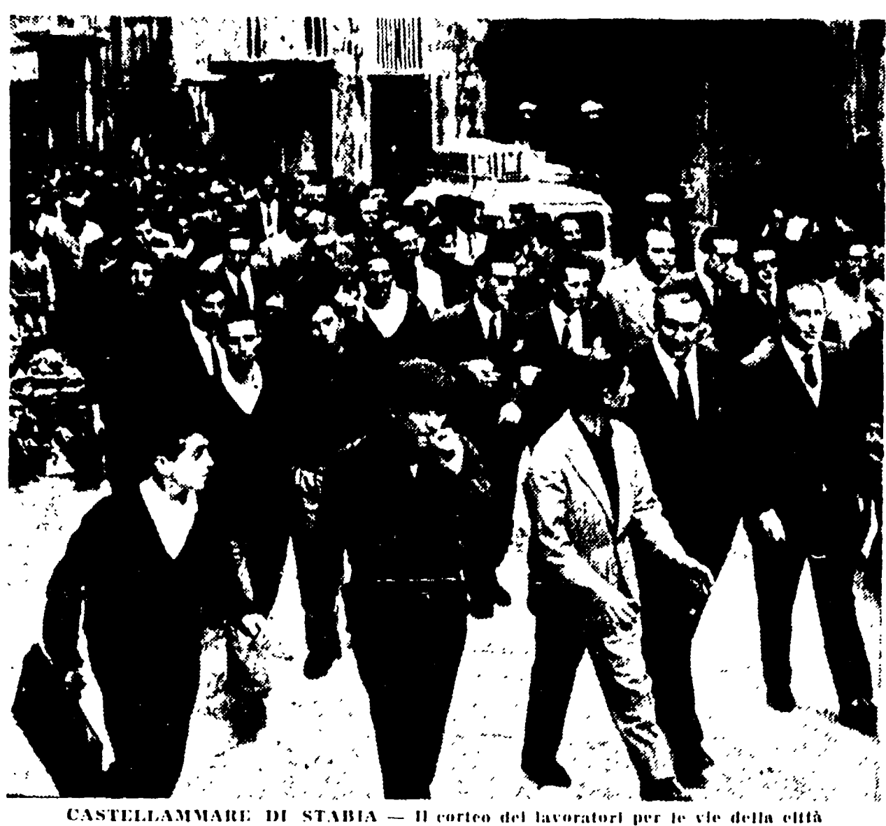
CASTELLAMMARE DI STABIA — Il corteo dei lavoratori per le vie della città