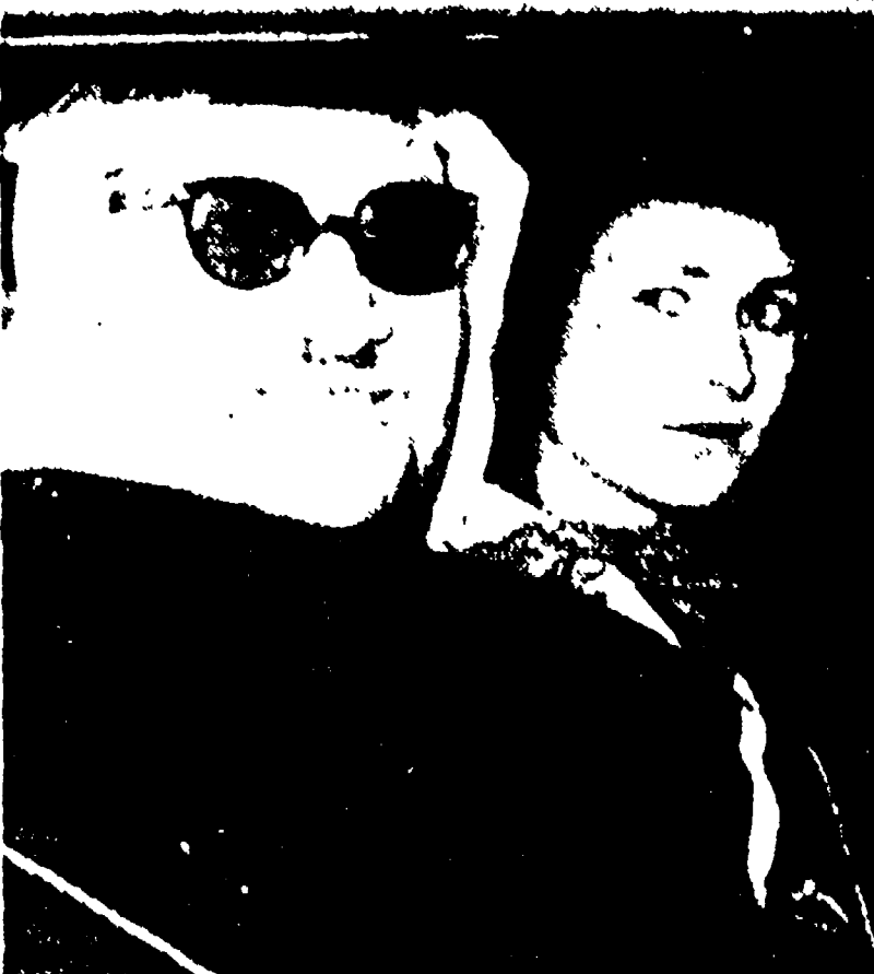
Il matrimonio di 20 giorni per la ragazza di Kiel. In alto: il principe arabo, in basso: la sposa.