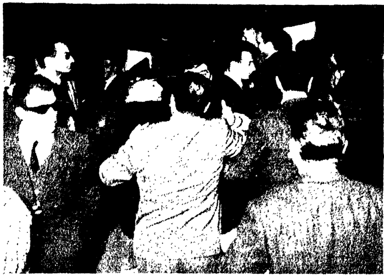
La polizia carica i giovani in Piazza di Spagna

Il traffico inteso sulla piazza è rimasto bloccato per centinaia di passanti si sono