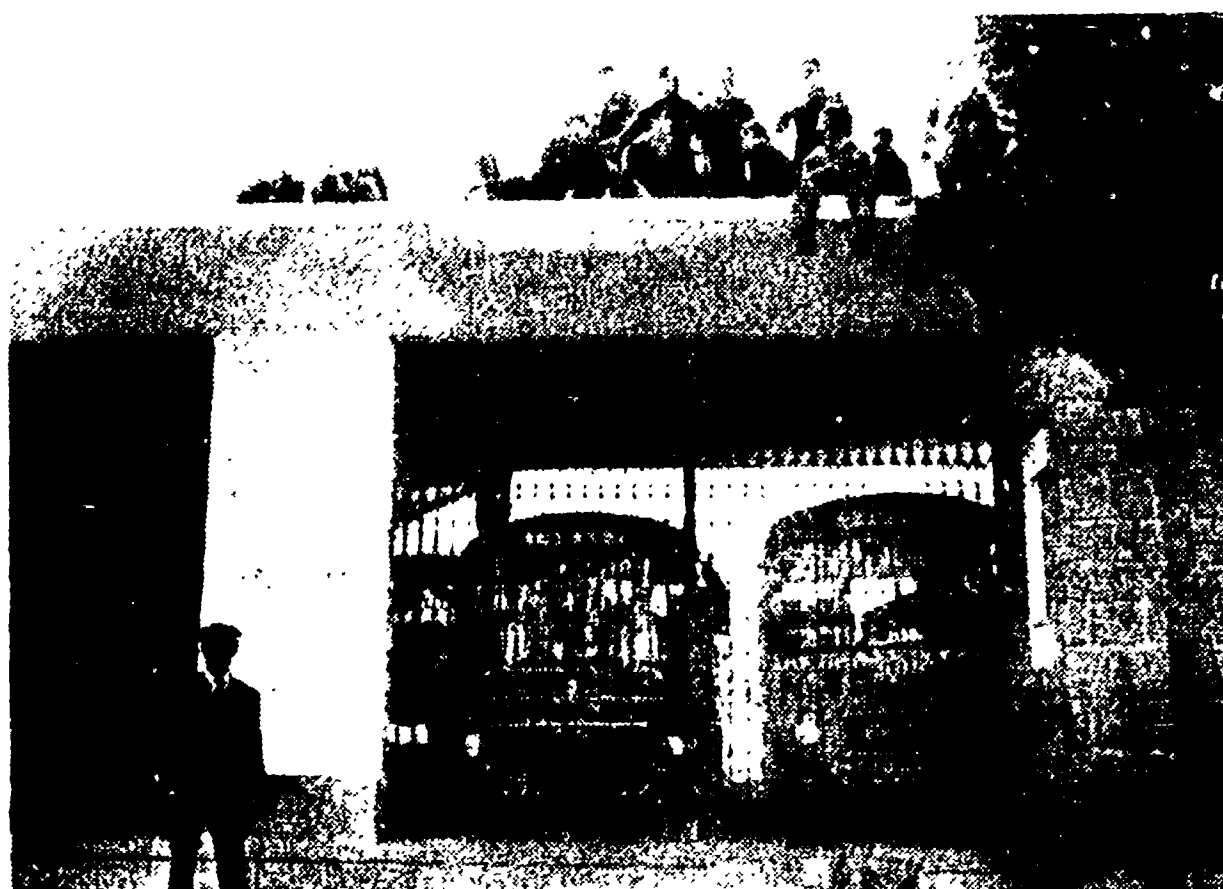
CAGLIARI — I dipendenti della SITA occupano per il quarto giorno il deposito e le officine di viale Monteponi...

Ancora occupati la rimessa della SITA e i pozzi della Monteponi - Costituito dai Comuni un Centro di sviluppo del Sulcis - Grave situazione nelle campagne