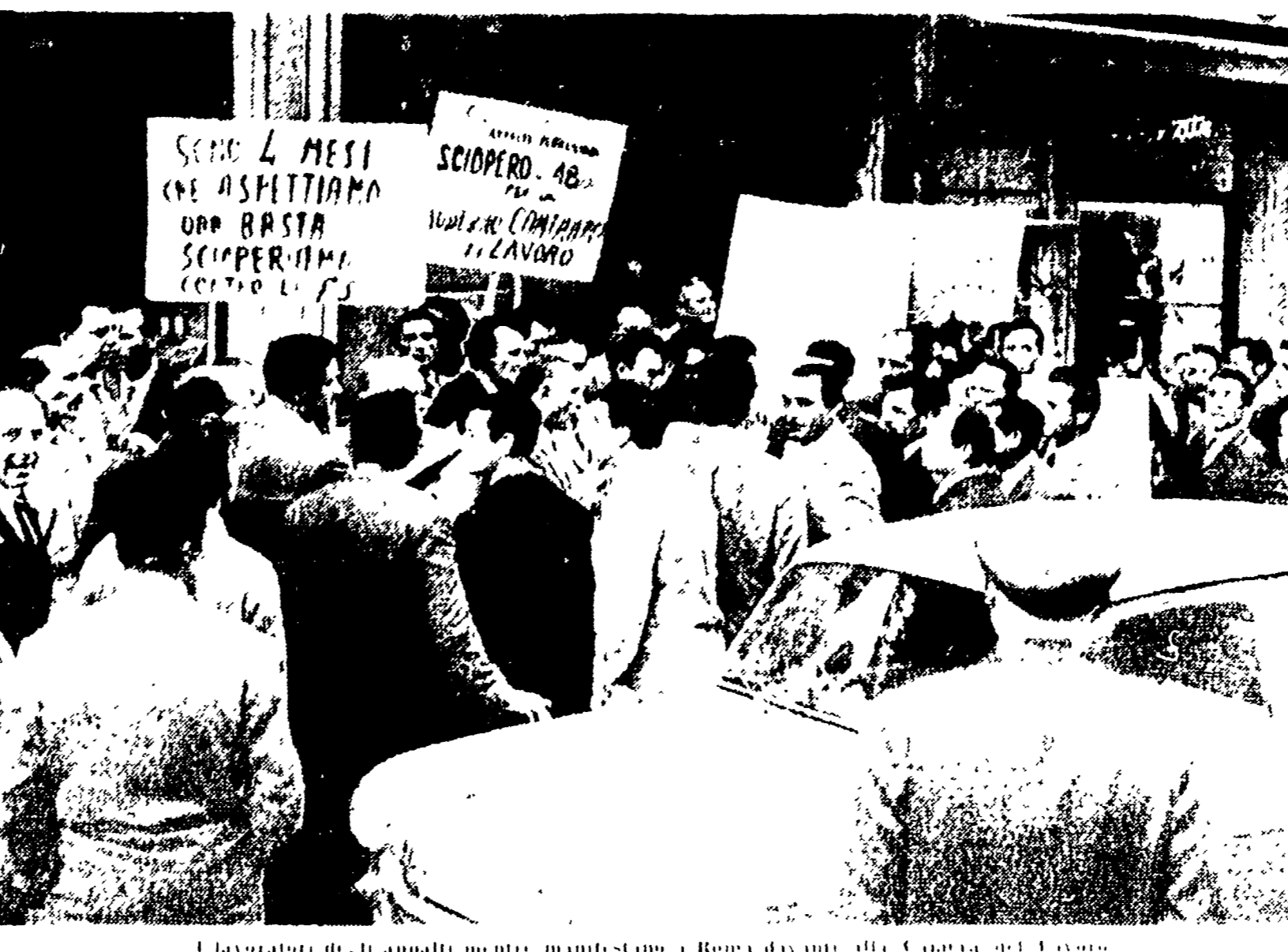
I lavoratori degli appalti mentre manifestano a Roma davanti alla Camera del Lavoro.

Successo dell'azione delle forze popolari