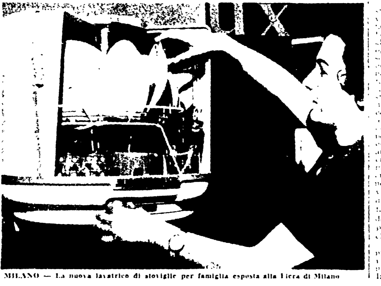
MILANO - La nuova lavatrice di stoviglie per famiglia esposta alla Fiera di Milano

La nuova lavatrice di stoviglie per famiglia è stata presentata alla Fiera di Milano. È una macchina moderna, compatta e pratica, che rivoluziona il modo di lavare i piatti.