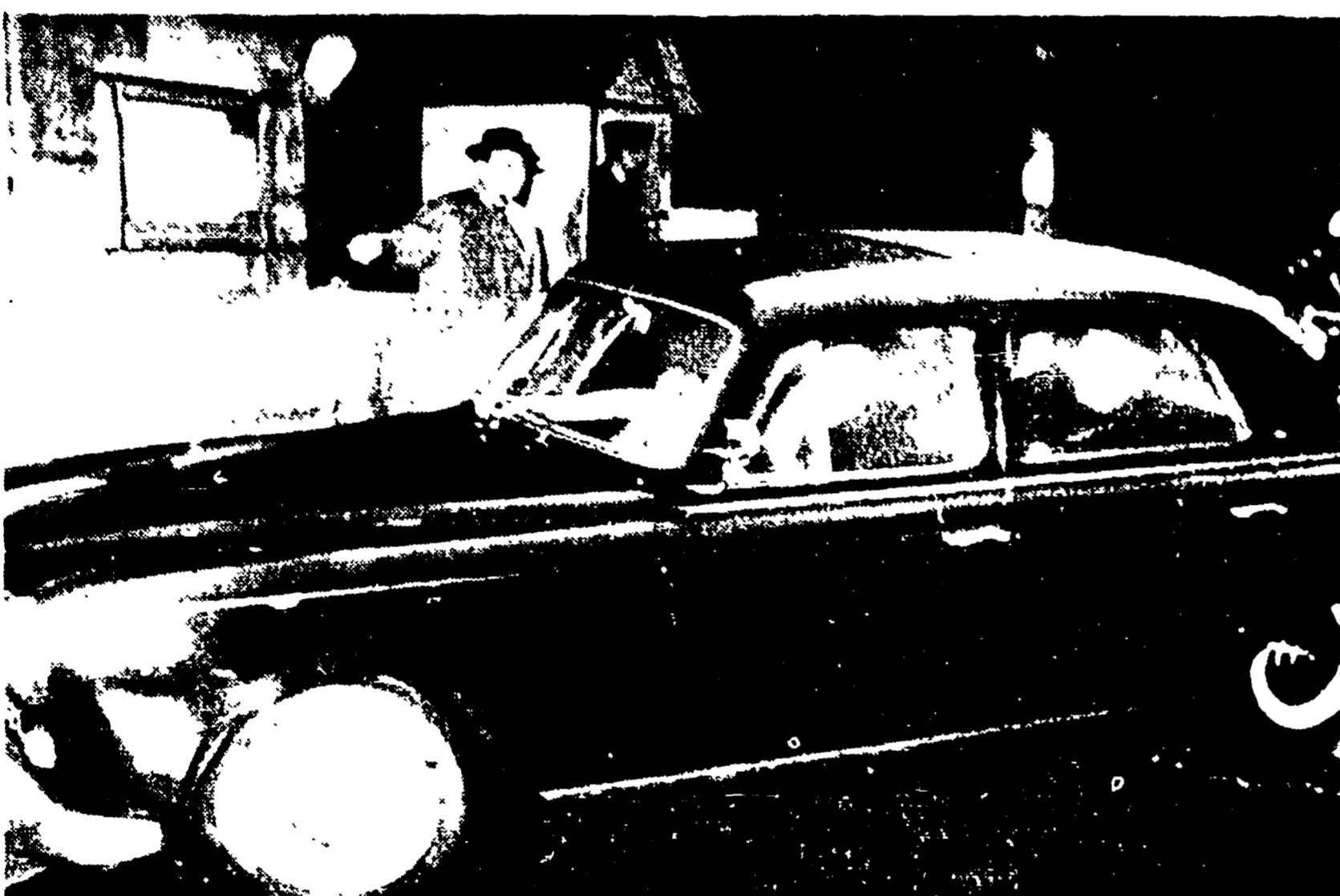
PARIGI - L'automobile con a bordo l'ex generale Challe, catturato in stato d'arresto all'aeroporto di Villamblanc con un apparecchio militare, entra nel carcere parigino della "Santo".

PARIGI 26 - L'ex generale Challe è stato arrestato a Parigi. Dopo aver cercato di nascondersi in un appartamento di rue de Valenciennes, è stato catturato il 25 aprile. Il generale Challe è stato arrestato a Parigi il 25 aprile. Dopo aver cercato di nascondersi in un appartamento di rue de Valenciennes, è stato catturato il 25 aprile. Il generale Challe è stato arrestato a Parigi il 25 aprile. Dopo aver cercato di nascondersi in un appartamento di rue de Valenciennes, è stato catturato il 25 aprile.