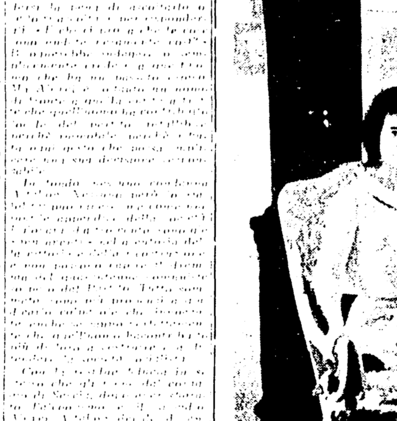
Alida Valli in «Alida»