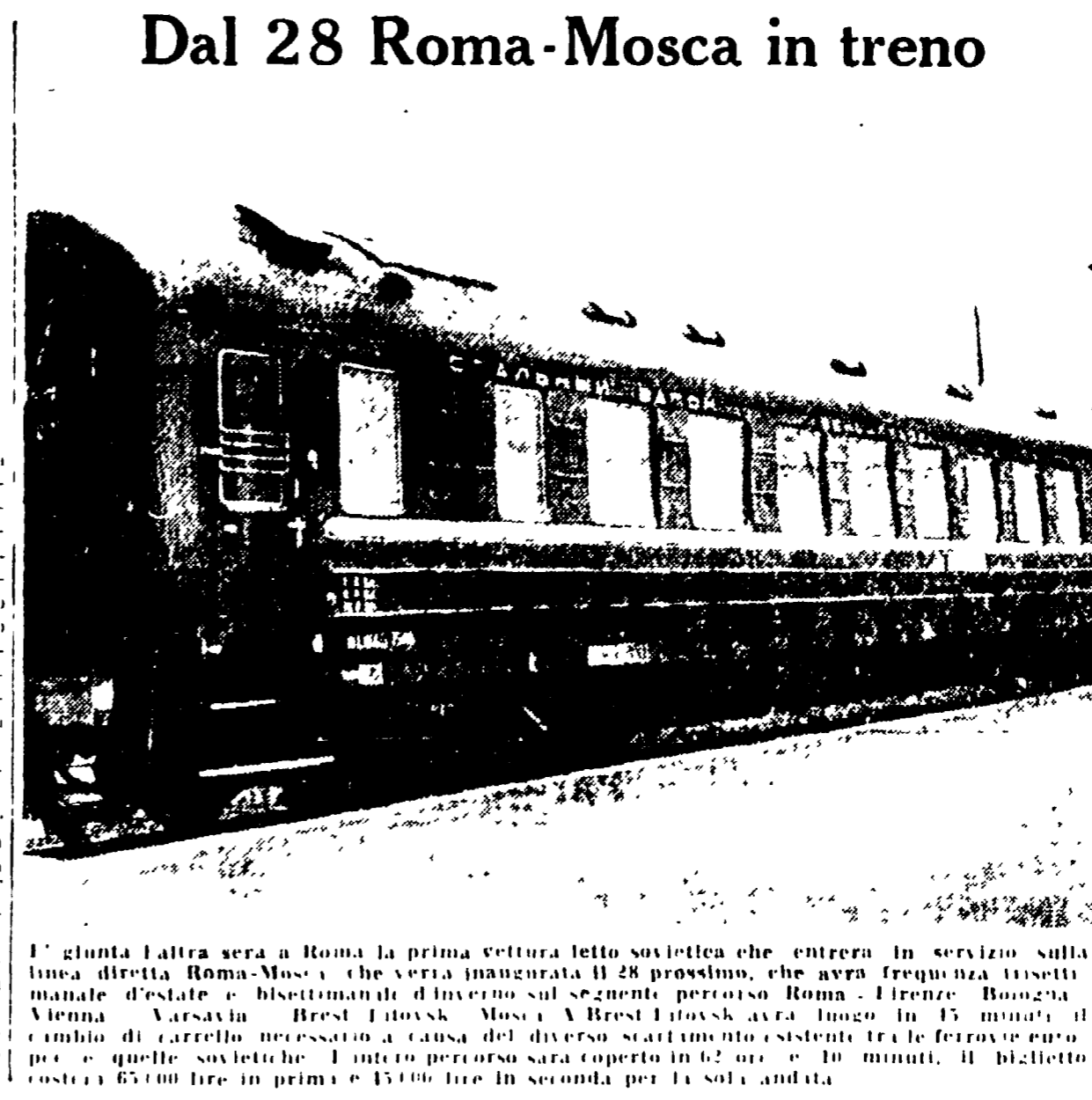
Dal 28 Roma-Mosca in treno

Il dibattito si è aperto con il discorso del senatore Zotta, che ha sostenuto che la mafia è un costume, un modo di vivere, e che per questo non può essere eliminata con le leggi. Ha criticato la proposta di legge Parri, ritenendola insufficiente per affrontare il problema della mafia.