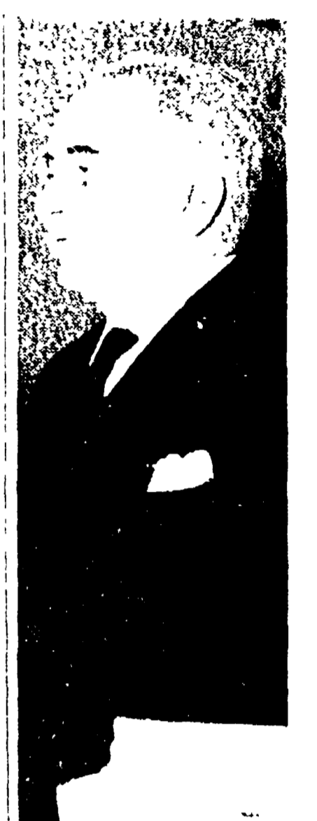
Il compagno Luigi Longo

Il Comitato centrale del PCI ha proposto un appello a tutte le forze democratiche per la difesa della pace e contro le avventure fasciste. L'appello è stato proposto dal compagno Luigi Longo.