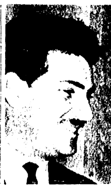
Il regista Ciukrai

MOSCA 26. — «Cielo pulito» della produzione di una nuova casa di Mosca, è un film che suscita discussioni e polemiche. Il regista Grigori Ciukrai, autore di «Quantunesimo» e della «Ballata di un soldato», ha colto con forza artistica e con coraggio civile, narrando la storia di un reduce e di sua moglie, alcuni aspetti drammatici del periodo del «culto della personalità».