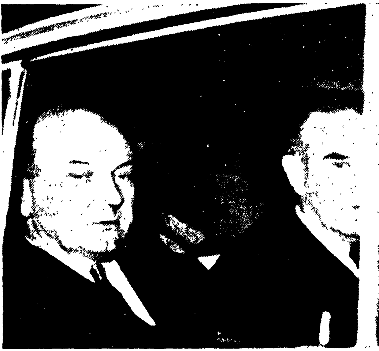
GINEVRA — Il segretario di Stato americano Rusk (a sinistra) e Harriman lasciano in auto la residenza di Lord Home.

(Continuazione dalla 1. pagina) tori. Esso si riferisce alla pressione esercitata dalla questura per impedire al proprietario del cinema Arma di distirire il permesso rilasciato ai fascisti. Il direttore di tale cinema, recatosi in questura per rendere nota la sua decisione, vi è stato trattenuto un'ora e mezza. Tutti i membri del Consiglio federativo della Resistenza di Modena hanno visto il documento che il gestore aveva portato con sé per esprimere la sua volontà di non consegnare il locale alla «Giovane Italia»; ma la questura, dopo aver parlato con Roma, ha affermato che il documento stesso «non è mai esistito». Poco dopo, agenti di polizia occupavano il cinema. Si voleva dunque che le cose andassero «fin» in fondo a rischio che capitassero verso il peggio.