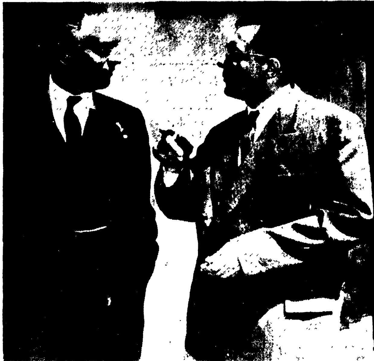
GINEVRA — Lord Home mentre conversa con Gromiko nella residenza di quest'ultimo a «Villa Rosa».

(Continuazione dalla 1. pagina) dese, il quale, non essendo stato avvertito del rinvio, si è presentato alle 3 in punto al palazzo delle Nazioni, e entrato nella sala della Conferenza e si è seduto al tavolo. Trascorsi dieci minuti senza che nessun altro arrivasse, il ministro ha avuto qualche sospetto e si è guardato attorno con aria interrogativa. Finalmente si è avvicinato un usciere, il quale gli ha cortesemente comunicato che stava perdendo il suo tempo. «Bene — ha ribadito imperturbabile il signor Green — la mia presenza qui serve a dimostrare che il Canada è sempre pronto a trattare»; dopo di che ha rimesso a posto le sue carte e se ne è andato.