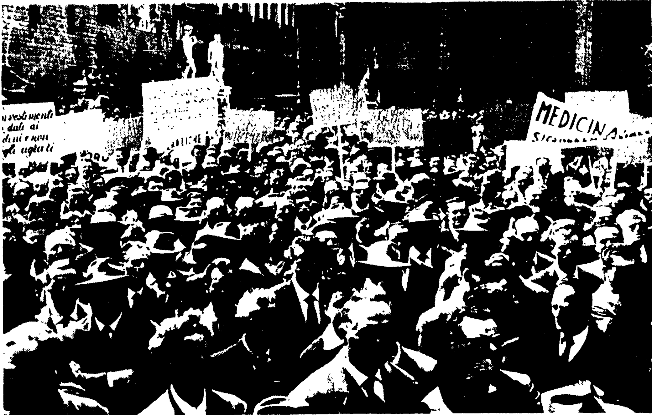
FIRENZE - Un aspetto della grande manifestazione dei mezzadri in piazza della Signoria

Il discorso del compagno Luciano Romagnoli - Sciopero in tutte le campagne toscane