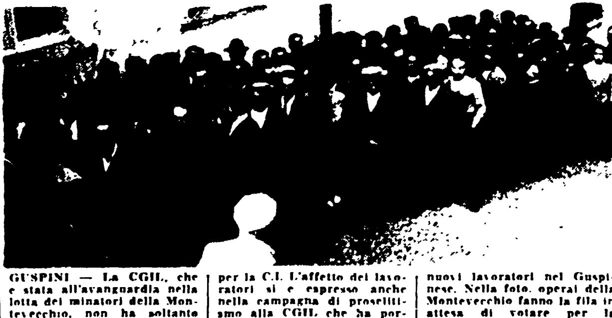
GIUNIPINI - La CGIL, che sta all'avanguardia nella lotta dei minatori della Montecatini, non ha soltanto solo giovedì mattina, quando la città era già tutta impregnata nella lotta. Chi ha pre-