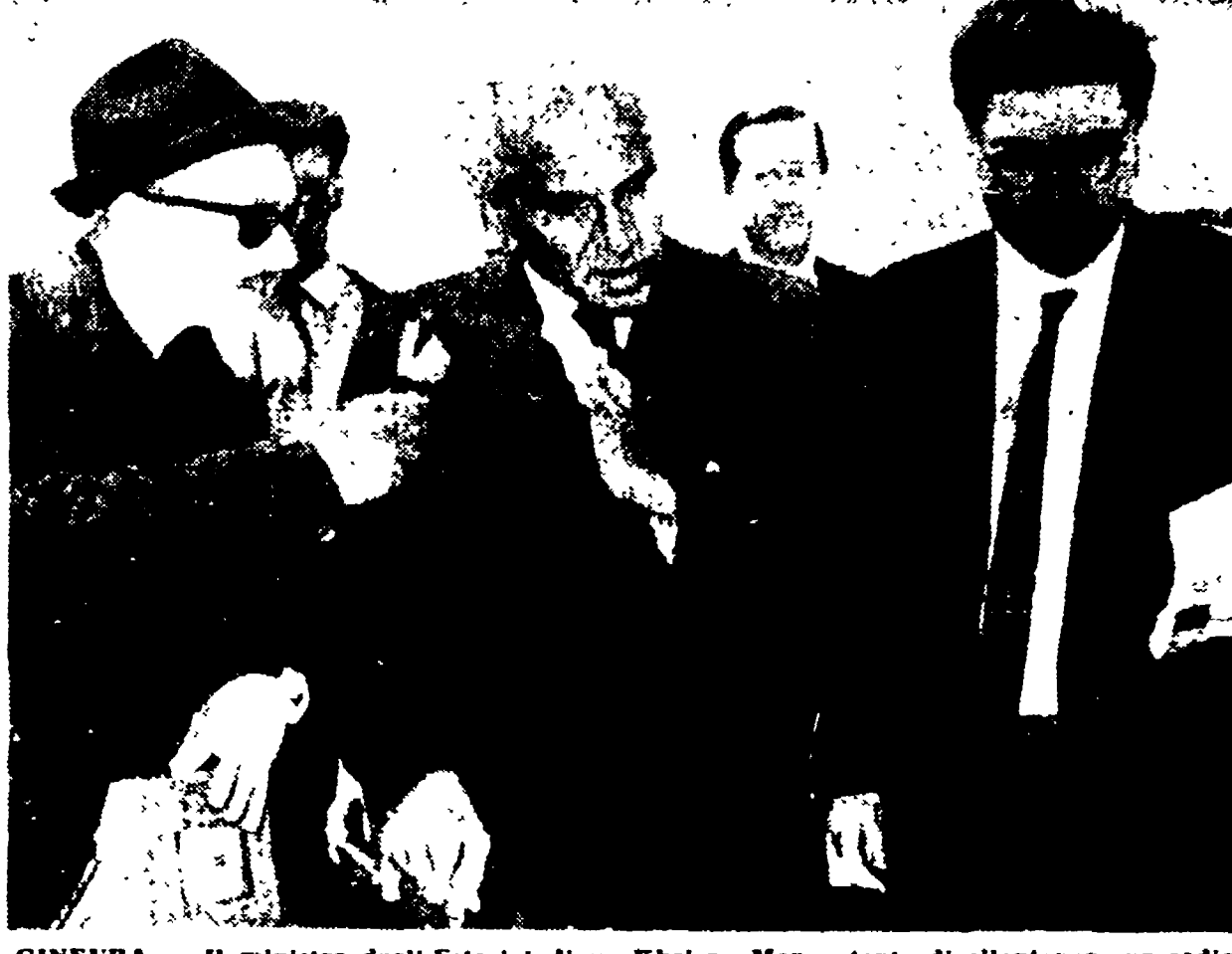
GINEVRA — Il ministro degli Esteri indiano Khitena Menon tenta di allontanare un radio cronista alla ricerca di dichiarazioni, all'aeroporto di Ginevra.