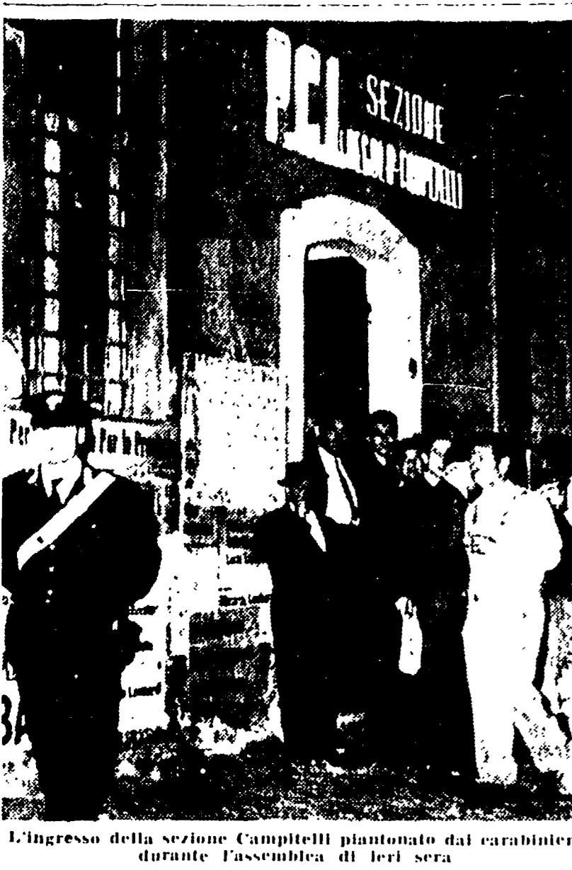
L'ingresso della sezione Campitelli piantonato dai carabinieri durante l'assemblea di ieri sera