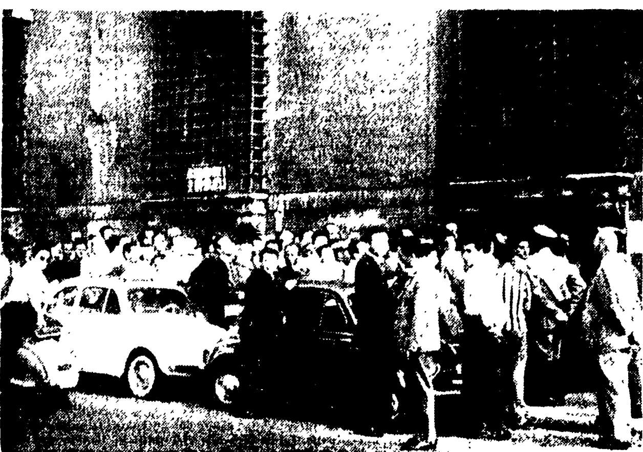
Fra sei giorni scendono le vecchie patenti. Numerosi sono ancora gli automobilisti che non hanno potuto ritirare il documento, ferri, come mostra la foto, una lunga coda si è formata in via di S. Eufemia, dove si apre l'ufficio della Prefettura che distribuisce le nuove patenti.