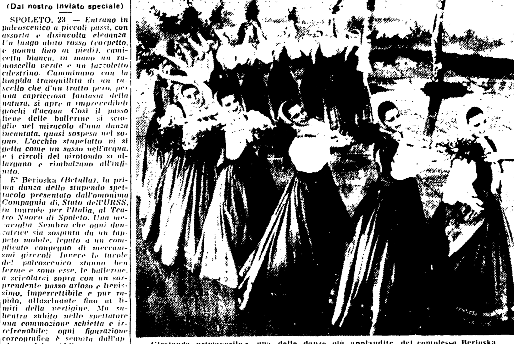
Girtondo primaverile, una delle danze più applaudite del complesso Berioska

Coreografie che hanno il fascino aereo e leggiadro della giovinezza - Entusiasmante festa di colori - Una raffinatezza estrema che non esclude mai il riferimento alla realtà, al racconto della vita