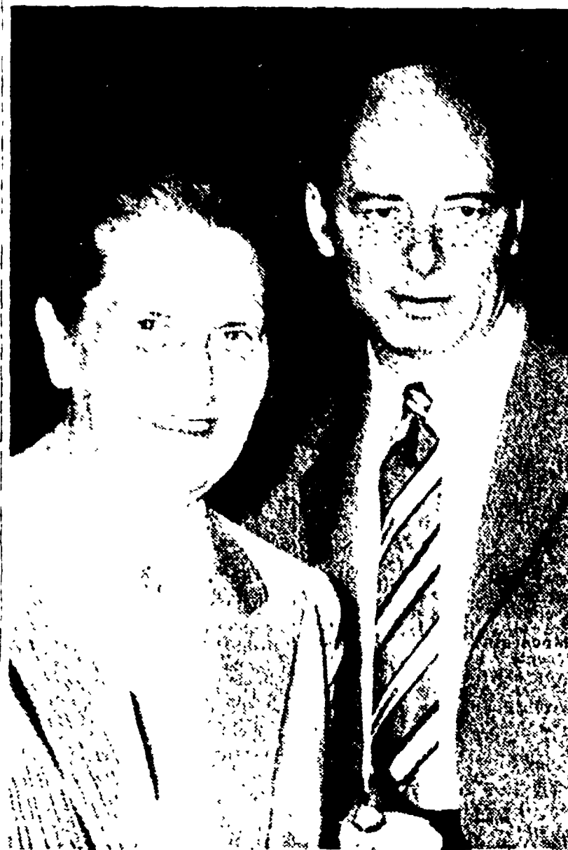
Il compagno Giancarlo Pajetta con la mamma Livia

Credo che nessuno possa mettere in dubbio l'eccezionale personalità del compagno G. Pajetta, così ricca di intelligenza e di sensibilità umana di esperienza e di capacità creativa. Tali compagni ed amministratori che non commettono in una realtà così complessa e di grande portata, in una superiore concezione della vita, non fanno solo un lavoro di routine, ma un lavoro di creazione, di ricerca, di impegno, di sacrificio, di dedizione, di amore, di fede, di speranza, di fiducia, di coraggio, di tenerezza, di generosità, di generosità, di generosità.