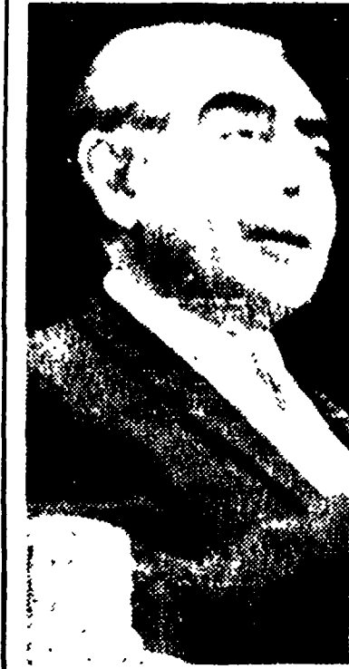
Il primo ministro Amin