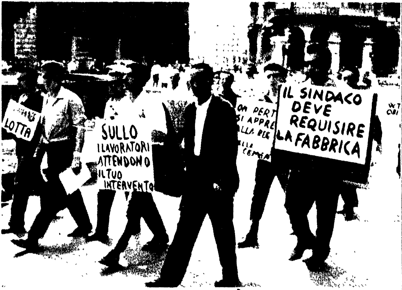
GENOVA - Un corteo di operai dell'Italcementi in sciopero ha percorso ieri mattina le vie della città. Nei numerosi cartelli recati dai lavoratori era scritta la richiesta avanzata al sindaco requisire lo stabilimento se non si può giungere subito a risolvere la vertenza con la trattativa sindacale (Telefoto)

Sottolineato da comunisti, socialisti e d.c. il contrasto fra monopolio e interessi dei lavoratori e dell'economia nazionale - Discussa la proposta di requisire le fabbriche paralizzate - Chiesti colloqui con Sullo e Fanfani