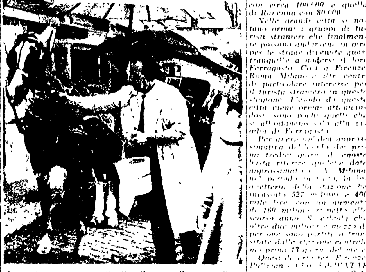
Un vettura romana sotto il soffione, nella zona attesa di un cliente. Rinfesta il cavallo.

La forte diminuzione di temperatura verificata in questi giorni in tutta l'Italia — con moti «secche» e di 15 gradi — ha provocato un esodo di turisti verso le spiagge e qualche temporale si è verificato in alcune zone. Il traffico motoristico è in aumento su tutti i principali assi viari. Si registrano 25 auto al minuto sulla Napoli-Salerno e 15 morti sulle strade. Venezia è invasa dai turisti, mentre Milano, Torino e Firenze sono semideserte.