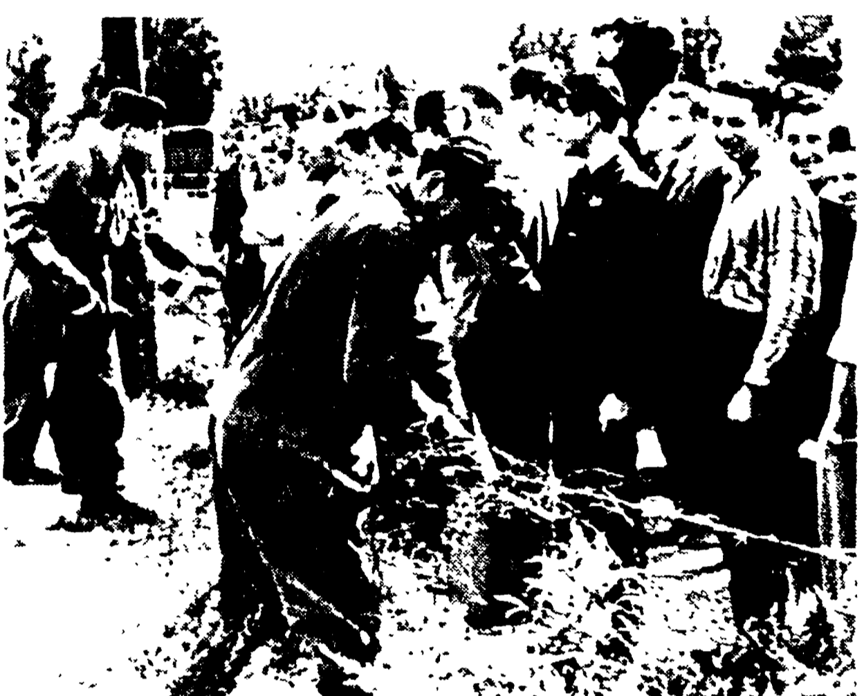
BERLINO — Soldati della Repubblica democratica tedesca erigono lo sbarramento di filo spinato al confine con Berlino Ovest.

BERLINO, 13 — Dalle due di questa notte al confine di settore fra Berlino democratica e Berlino ovest sono stati istituiti i controlli che ogni Stato sovrano pone alle proprie frontiere. Analoghe misure sono state istituite al confine fra la RDT e Berlino ovest. Il Consiglio dei ministri della Repubblica democratica ha adottato queste decisioni in base alla dichiarazione del governo del Trattato di Varsavia, che contiene un invito ad instaurare sui confini di Berlino ovest un regolamento del traffico che sbarrerà la strada alle attività di spionaggio, sobillazione e diversione che, approfittando della anormale situazione della città, vengono condotte dalle centrali di Berlino ovest. L'organo del Comitato centrale della SED, il "Neues Deutschland", è uscito stamane pubblicando nella prima pagina cinque documenti: 1) la decisione del Consiglio dei ministri della Repubblica democratica tedesca; 2) la dichiarazione dei paesi del patto di Varsavia; 3) un comunicato del ministero degli Interni della RDT; 4) un comunicato del ministero dei Trasporti; 5) un comunicato dell'Amministrazione economica di Berlino democratica la quale ha diviso in cittadini di Berlino ovest di lavorare in aziende di Berlino ovest.