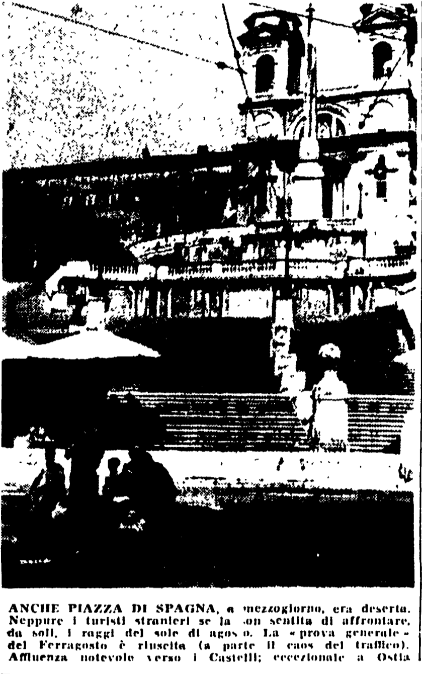
ANCHE PIAZZA DI SPAGNA, a mezzogiorno, era deserta. Neppure i turisti stranieri se la sentivano di affrontare, da soli, i raggi del sole di agosto. La «prova generale» del Ferragosto è riuscita (a parte il caos del traffico). Affluenza notevole verso i Castelli; eccezionale a Ostia.