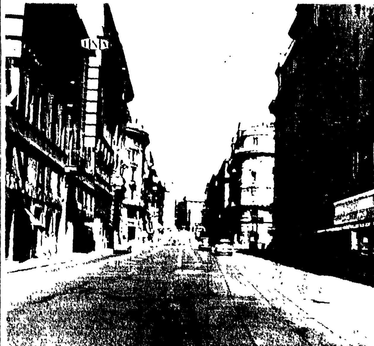
Via del Tritone a Roma alle 12 di ieri. Esodo di Ferragosto e già in atto.

Venezia invasa dai turisti - Semideserte Milano, Torino, Firenze Sulla Napoli-Salerno 25 auto al minuto - 15 morti sulle strade