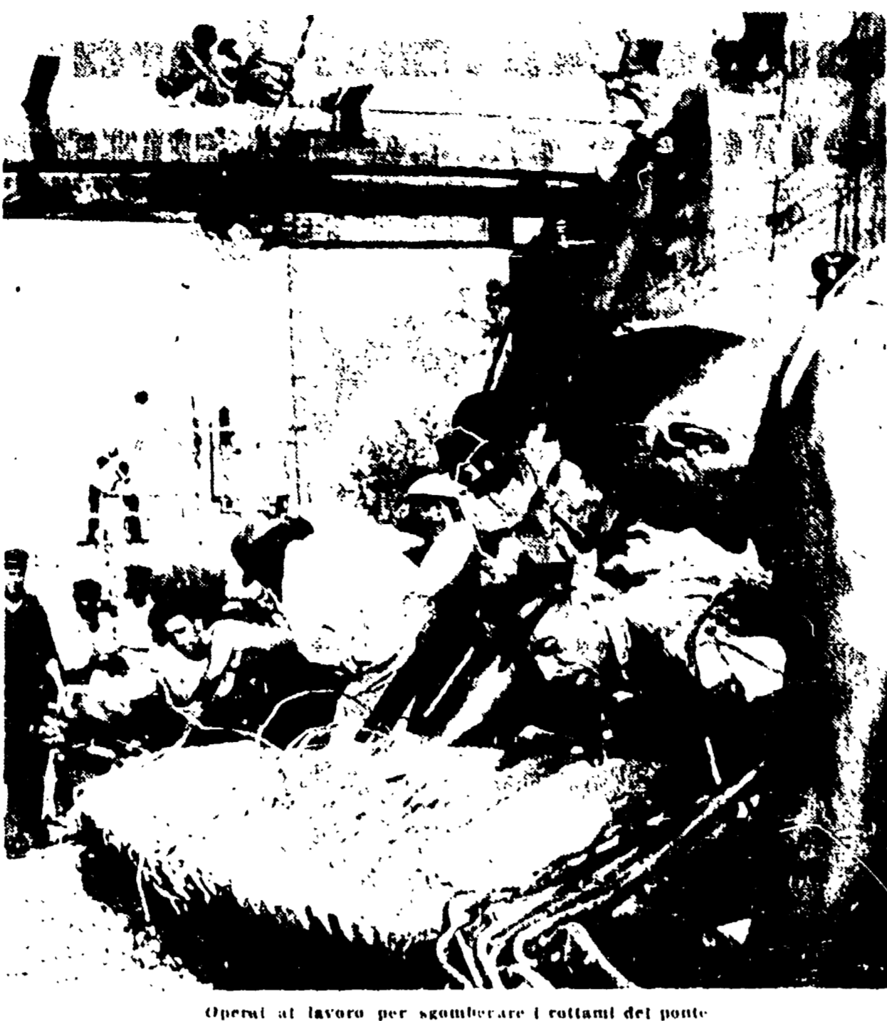
Operai al lavoro per sgombrare i rottami del ponte