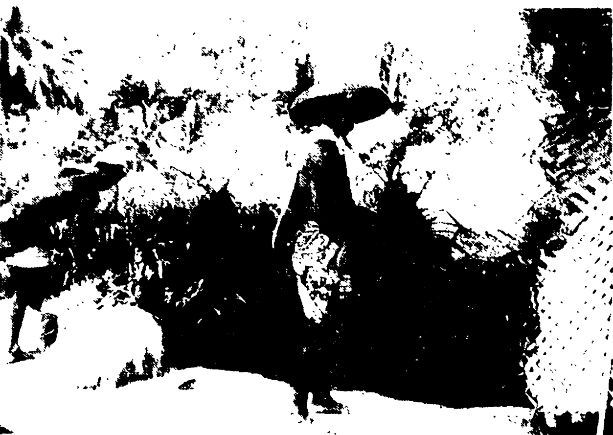
BALI - Contadini al lavoro in una piantagione di riso. I lavoratori della terra conducono una dura lotta per strappare ai padroni alcune ripartizioni dei prodotti