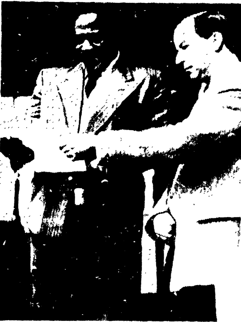
GATUNDU - M. Chubbis (a destra), capo del governo del Ruanda, con un documentario del Distretto di Gatundu consegnato a Kenyatta.