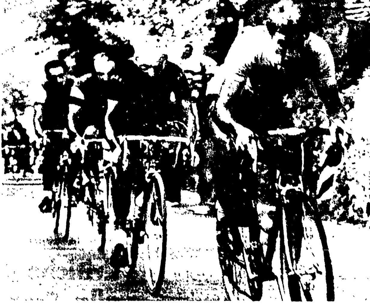
Quattro atleti - accanto - G. P. Industria e Commercio a Prato; da sinistra: N. C. T. G. P. Industria e Commercio a Prato; da sinistra: N. C. T. G. P. Industria e Commercio a Prato...

In caso di completo fallimento non è escluso che a Berna si ripeta (tre anni dopo) l'imprisa di Baldi a Reims (Van Looy permettendogli...) - Il pericolo di giuoco tra gli uomini delle marce - La posizione del C.T. che deve spalleggiare l'U.V.I.