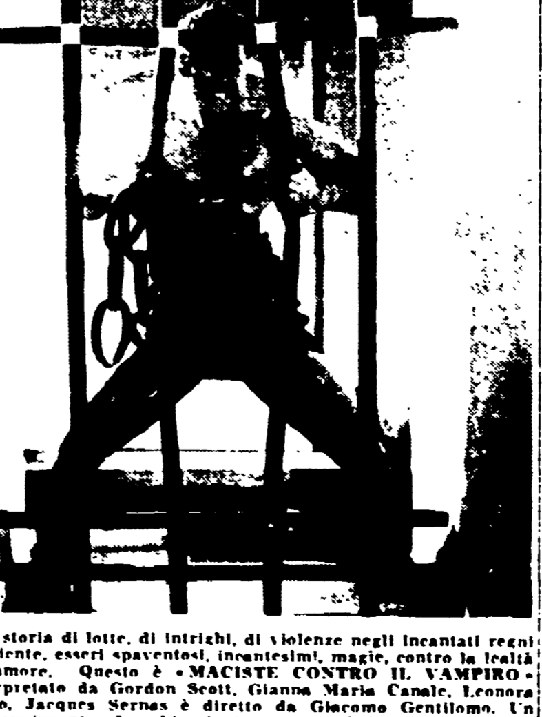
Una storia di lotte, di intrighi, di violenze negli incantati regni d'Oriente, esseri spaventosi, incantevoli magici, contro la vita e l'amore. Questo è «MACISTE CONTRO IL VAMPIRO» interpretato da Gordon Scott, Gianna Maria Canale, Leonora Ruffo, Jacques Sernas è diretto da Giacomo Gentilomo. Un film avvincente ed agghiacciante, come è più dei suoi personaggi