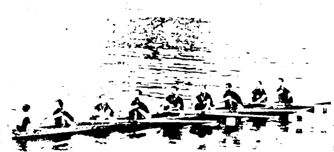
● PRAGA. I quattro senza azzurri sabato dopo la clamorosa vittoria nell'otto. (Dalla pagina 2) Continúa en la pag. 4

I canottieri sovietici (vittoriosi in tre prove) sono i veri trionfatori - Delatono i tedeschi che si aggiudicano solo due titoli