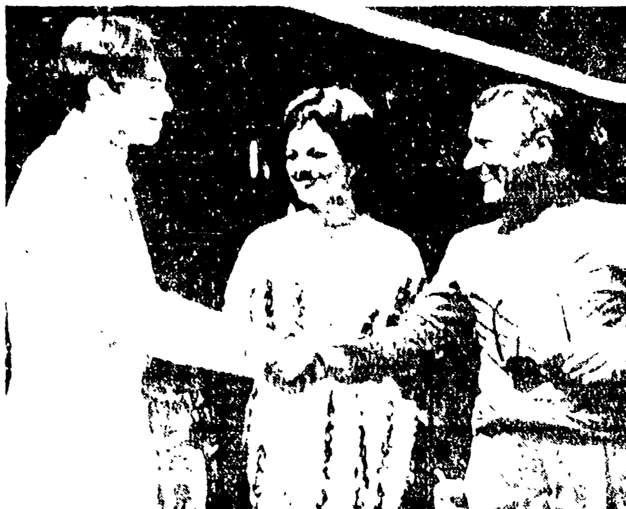
VENEZIA. L'attrice Sandra Milo e il regista Rossellini. In alto: il film «Vanina Vanini» di Rossellini. Sotto: il regista Rossellini con la moglie e i figli.

«Da uno dei nostri inviati» VENEZIA. Da una settimana il Festival di Venezia è in pieno svolgimento. Il pubblico ha già visto una serie di film di grande interesse. Tra questi, il film di Rossellini «Vanina Vanini». Il film è un affresco storico che delude. Una certa efficacia descrittiva dell'ambiente non basta a salvare quest'opera malriuscita. Inaccettabile la prestazione di Sandra Milo. Il finale trascina a il racconto stendhaliano di un'epoca di aperture.