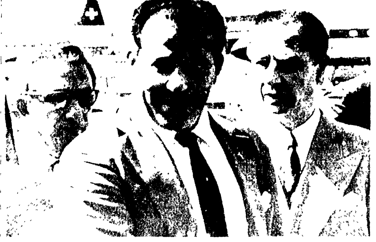
ZURIGO — Il vice presidente brasiliano Juan Goulart (a sinistra) all'arrivo all'aeroporto di Kloten. A destra, l'ambasciatore del Brasile in Svizzera.

attenzione che la Germania e l'Unione Sovietica, come si è visto, hanno avuto un ruolo importante nel processo di disarmo nucleare. Si chiede che il disarmo nucleare sia attuato in modo equo e reciproco, e che non avvenga prima che non siano state risolte le questioni di disarmo convenzionale.