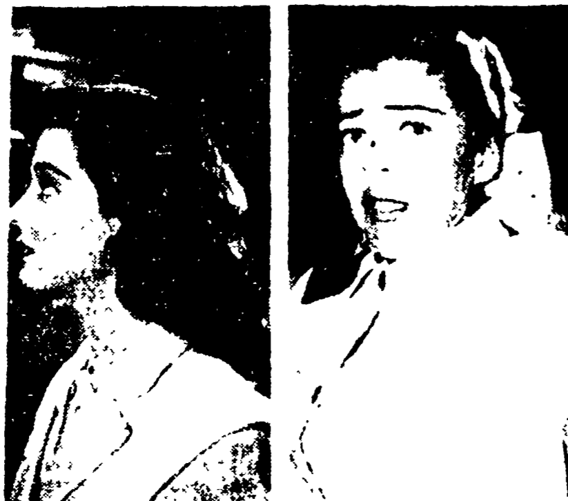
Prima (a sinistra) e nel momento del tramonto (a destra) Gail Russell. Nel 1941, dopo il suo matrimonio con un attore, si trasferì a Hollywood. Fu la prima attrice a produrre i propri film, spesso in partnership con il marito.

Vicino al suo cadavere sono state trovate alcune bottiglie di vodka vuote