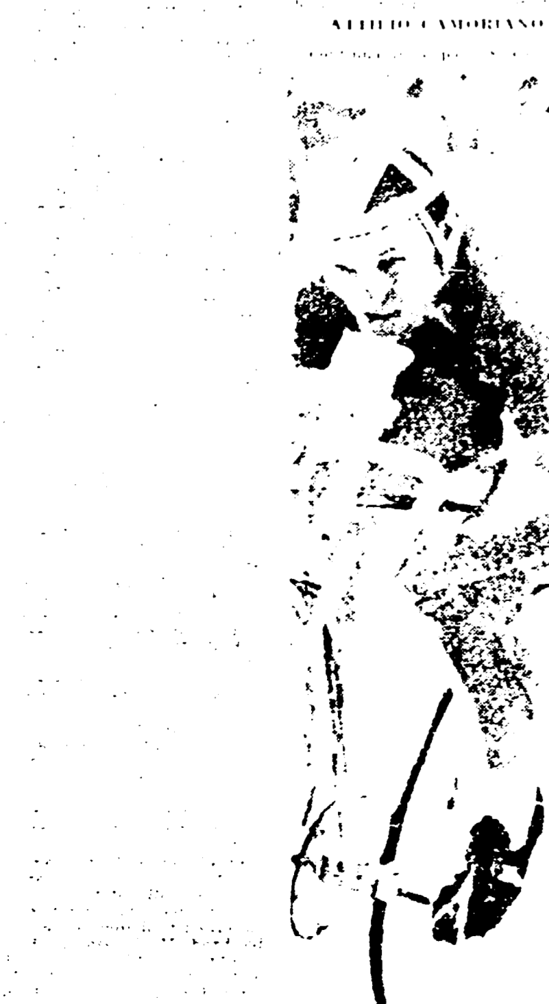
DINO RIVINHI... ● PRAGA...