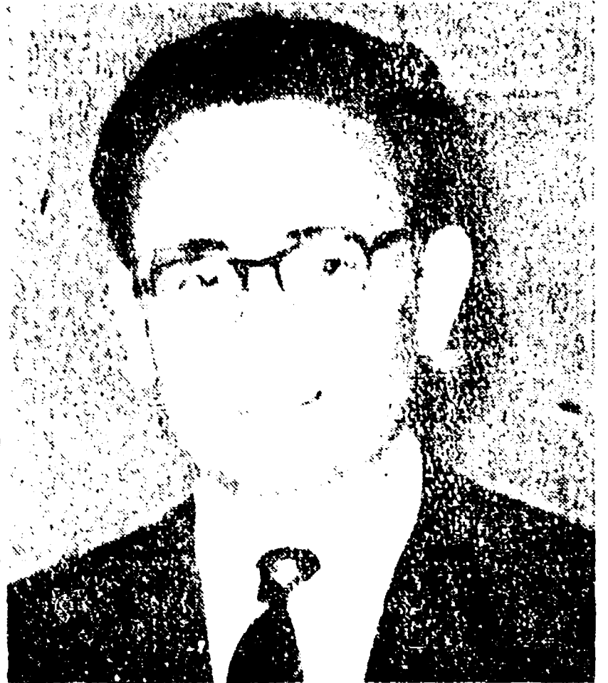
Il nuovo premier algerino Ben Khedda

NEW YORK, 27 agosto. - Il premier dell'Urss, Nikita Krusciov, ha dichiarato oggi che il suo paese è pronto a garantire lo stato libero di Berlino Ovest. Krusciov ha detto che l'URSS è disposta a firmare un trattato con gli occidentali che garantisca lo stato libero di Berlino Ovest e che il trattato sia firmato entro il 1961. Krusciov ha detto che l'URSS è disposta a firmare un trattato con gli occidentali che garantisca lo stato libero di Berlino Ovest e che il trattato sia firmato entro il 1961.