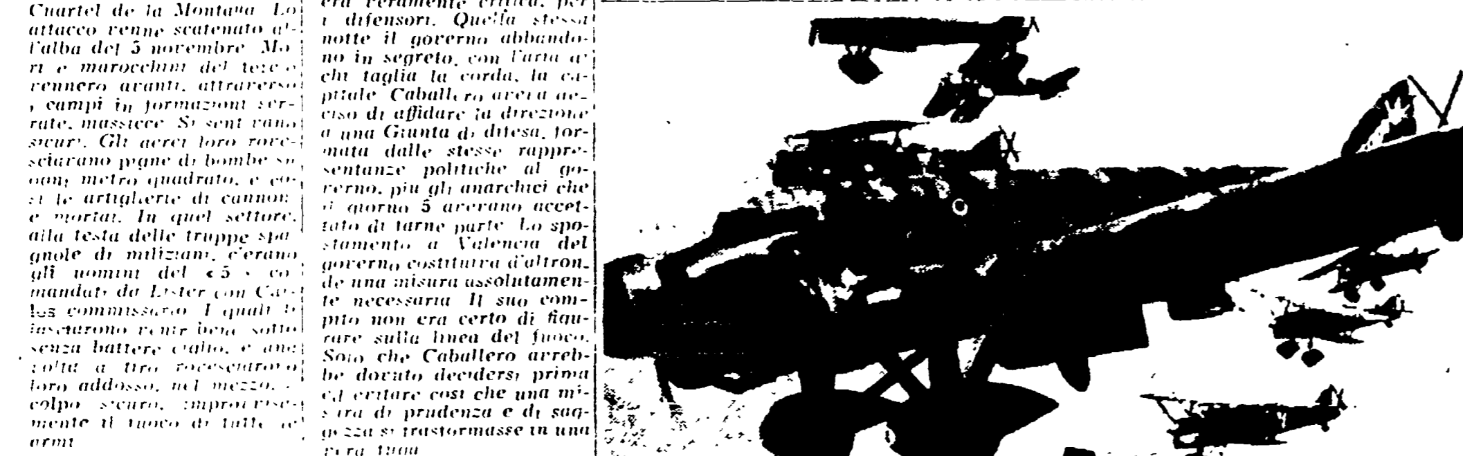
Bombardieri dell'aviazione di Mussolini in azione - sul cielo di Madrid il bombardamento della città fu particolarmente intenso ed effarato nel corso della battaglia dell'autunno 1936.