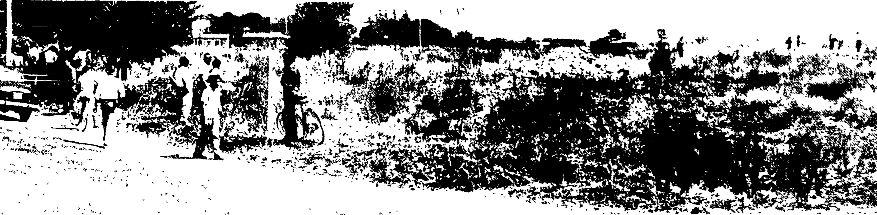
La teca vicino alla quale è stato consumato il delitto. In alto a destra si scorge il gruppetto degli investigatori ancora intenti ad effettuare i primi rilievi. Su un lato attende il furgone della polizia mortuaria.

L'uccisa era madre di 4 bambini - Due operai che percorrevano un sentiero in bicicletta hanno scoperto il cadavere per caso - Un giovane e la sua amante lungamente interrogati - Si indaga negli ambienti delle mondane e dei protettori ma gli investigatori non escludono il delitto occasionale