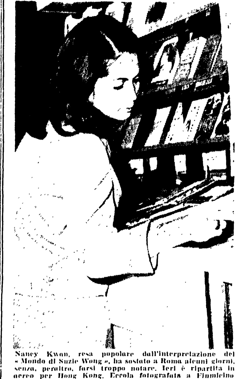
Nancy Kwai, resa popolare dall'interpretazione del «Mondo di Suzie Wong», ha sostituito a Roma all'Alibi...