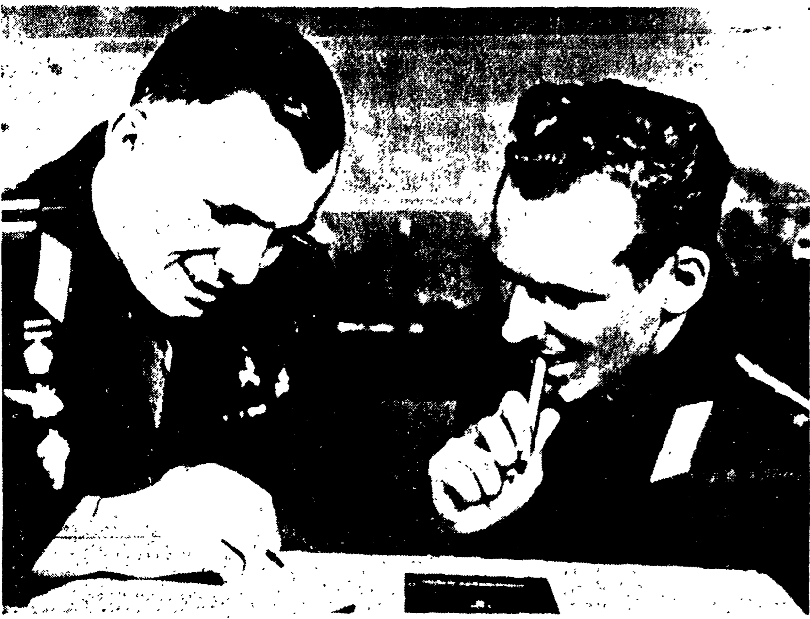
MOSCA — Yuri Gagarin (a sinistra) e Gherman Titov, mentre studiano su un grafico la rotta seguita da Titov durante il volo spaziale dello scorso agosto