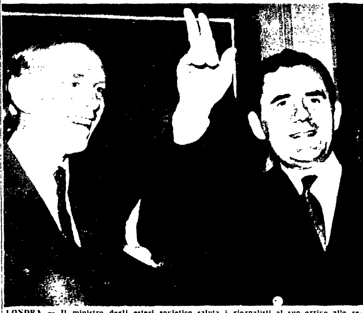
LONDRA - Il ministro degli esteri sovietico saluta i giornalisti al suo arrivo alla residenza di Lord Home...

Il colloquio con il premier definito utile e interessante - «Una soluzione pacifica è possibile: tutti devono cercarla» - Consegnato un messaggio di Krusciov