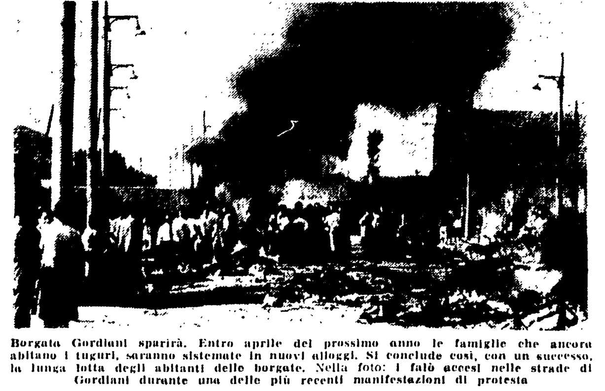
Borgata Gordiani sparirà. Entro aprile del prossimo anno le famiglie che ancora abitano i tuguri saranno sistemate in nuovi alloggi. Si demolisce così un successo. La lunga lotta degli abitanti delle borgate. Nella foto: i fatti accesi nelle strade di Gordiani durante una delle più recenti manifestazioni di protesta.